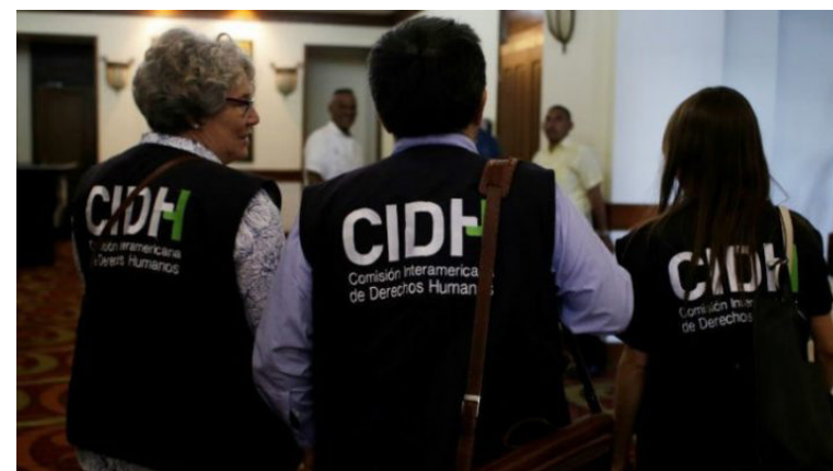
La Comisión Interamericana de Derechos Humanos (CIDH) actúa como “órgano consultivo” de la Organización de los Estados Americanos (OEA) en esta materia.

La Comisión Interamericana de Derechos Humanos (CIDH) tiene en su mandato la promoción, observancia y la defensa de los derechos humanos en la región y actúa como “órgano consultivo” de la Organización de los Estados Americanos (OEA) en esta materia.