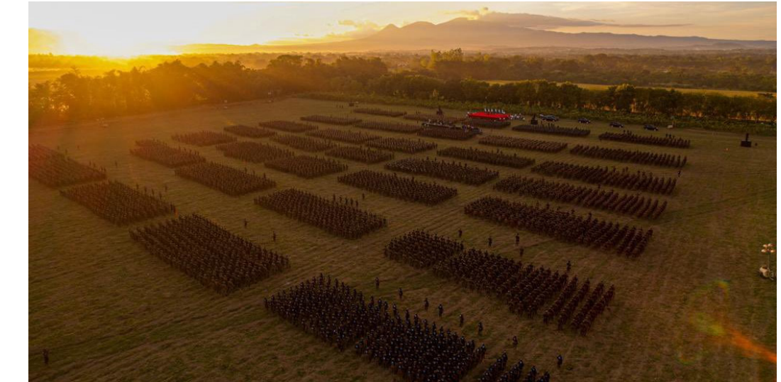
Serán 14 mil soldados los que se desplegarán para la implementación de la fase 5 del Plan Control Territorial.

Cabe recordar que el 2 de octubre de este año, el Gobierno de El Salvador impuso un cerco militar en Comasagua, La Libertad, bajo el argumento de frenar el accionar de la clica “Witmer Locos Salvatruchos”, del programa Libertad de la MS13, ya que esta estructura delincencial asesinó a