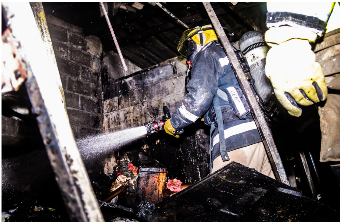
La pronta atención del Cuerpo de Bomberos, evitó que el fuego de una casa, en San Marcos se propagara a otras viviendas.