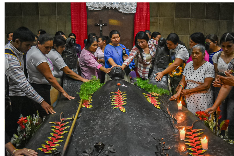
Un grupo de católicos hondureños visita la Cripta de Catedral Metropolitana de San Salvador para conocer el mausoleo de Monseñor Romero.

“Para nosotros es un Santo porque nos dio mucho ejemplo a todos los católicos y al mundo entero y por eso estamos aquí, para conocer su tumba; ya conocemos de sus homilias, él fue un gran pastor para el mundo”,