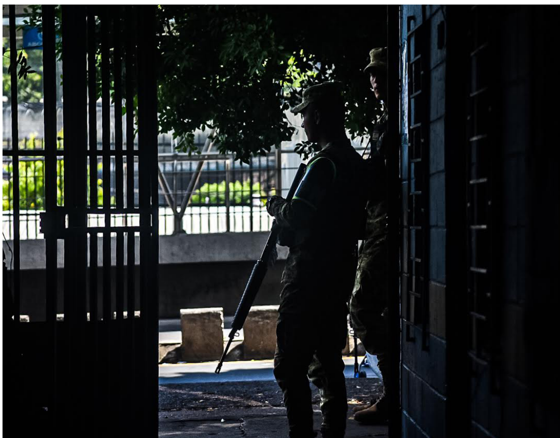
Agentes militares son los encargados de controlar cada pasaje de la Comunidad Tutunichapa; en esa zona se ha instalado un cerco militar.

“Las víctimas saben que no están solas, porque el gobierno