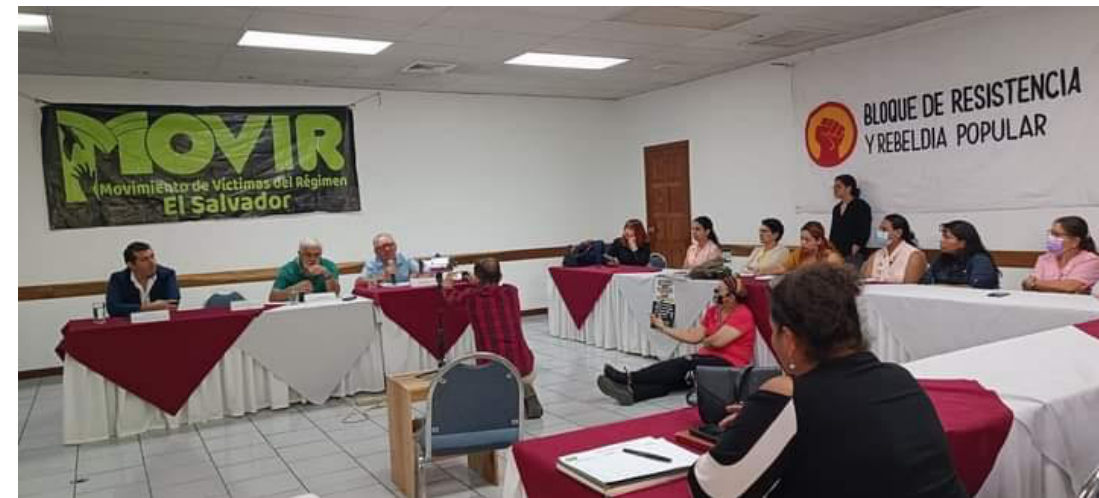
El MOVIR y el BRP realizan un foro para enlistar las afectaciones del régimen de excepción a un año de haberse implementado.

cólogo del IDHUCA, habló sobre las afectaciones en la salud mental de los niños y adultos mayores de los detenidos injustamente, ya que incluso niños han visto cómo los agentes golpean a sus padres y se los llevan. “Hay niños que incluso