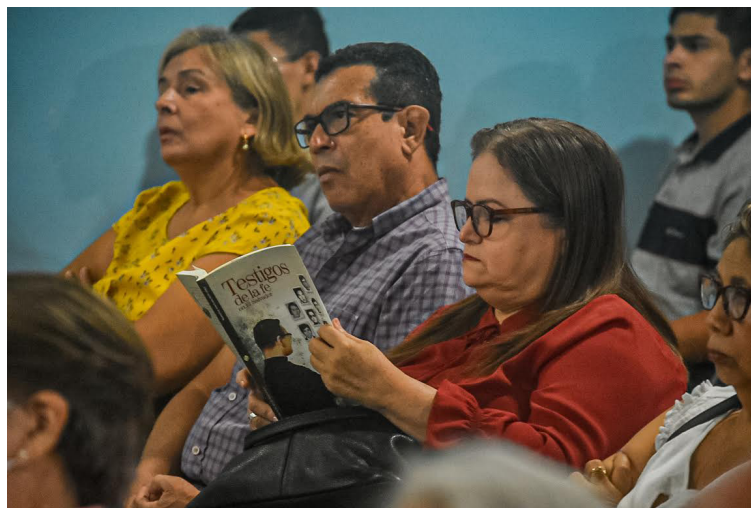
El libro presenta 10 casos de cristianos que fueron asesinados en el ejercicio de su fe. A la Capilla de la Divina Providencia llegaron el triple de personas de las esperadas.

El libro consta de cuatro 4 capítulos; el primero sobre el martirio, testimonio perenne de