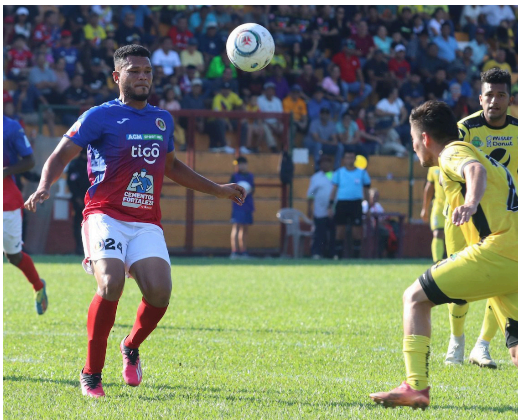
FAS empata sin goles ante Once Deportivo en el inicio de la segunda vuelta del torneo Clausura 2023.