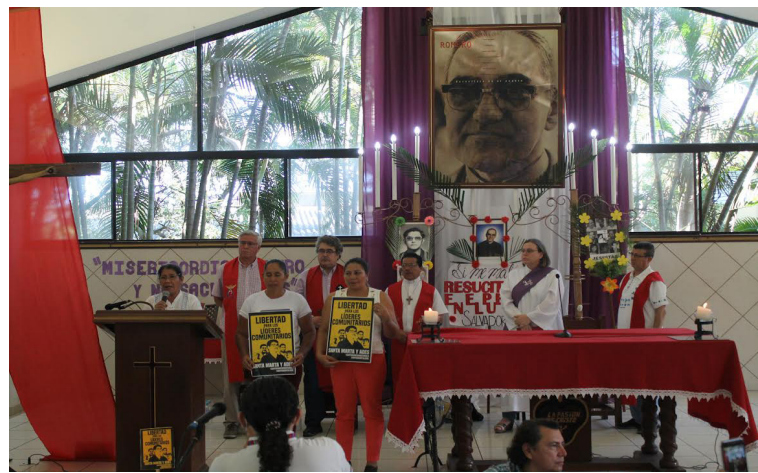
Los organizadores esperan constituir este espacio de expresión popular y estudio permanente de la palabra de Mons. Romero.