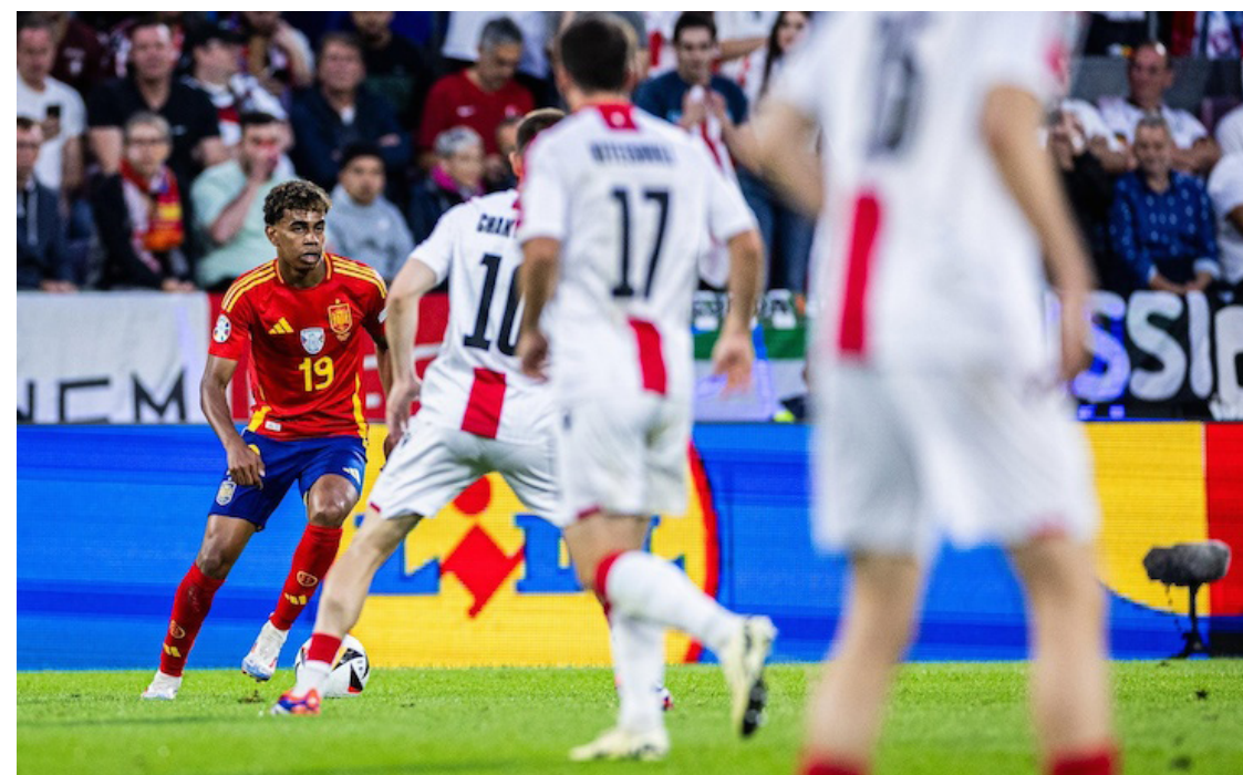
España vence 4-1 a Georgia y se enfrentará a Alemania en los cuartos de la Euro 2024.

Desde los 11 metros CD Titán careció de definición y ese defecto lo aprovechó el cuadro migueleño para ser completamente distinto a su rival y poder sentenciar el boleto y la victoria en el "Coloso de Monserrat", y con ello consiguió el boleto para convertirse en el Benjamín del torneo Clausura 2024.