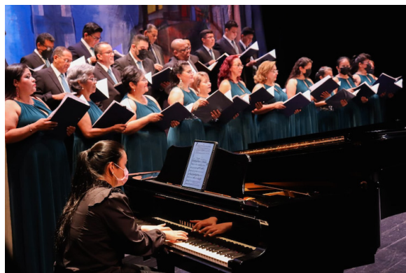
Una de las primeras acciones del nuevo ministro fue disolver el Coro Nacional de El Salvador.

El actual presidente de facto, Nayib Bukele, anunció hace algunos días que el nuevo ministro de Cultura, destituiría a