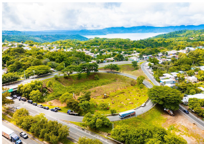
Con el Plan Nacional de Reforestación se distribuirán más de 50,000 árboles y plantas en puntos estratégicos a escala nacional.

La campaña se inició con la entrega de árboles que se extenderá durante 20 sábados hasta el 9 de noviembre de 2024. Se distribuirán más de 50,000 árboles y plantas en puntos estratégicos a lo largo de los 14 departamentos del país. Cada sábado, se establecerán puntos de entrega en parques, centros comerciales y sitios turísticos,