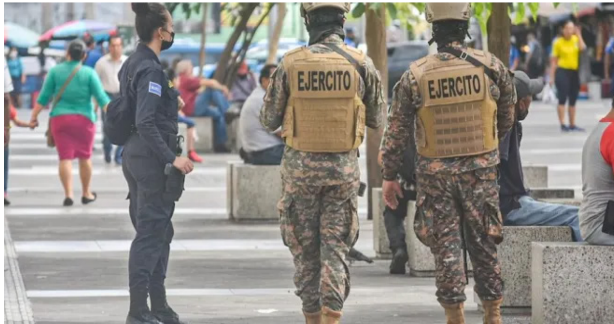
La población salvadoreña considera que viven más tranquilos luego que pandilleros fueron sacados de las colonias.

Desde que se implementó, se han capturado a más de 80 mil presuntos pandilleros; entre ellos a miles de personas inocentes, es decir, que nada tienen que ver con pandillas. De hecho, el Gobierno reconoce que ha dejado en libertad a más de 7 mil personas porque no se les encontró vínculos con las pandillas.