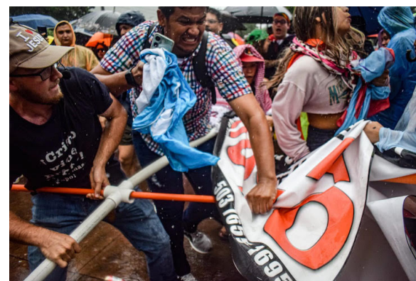
Destruyen carteles de religiosos que se hicieron presentes en la marcha para "persuadir" a la comunidad LGBTIQ+ de su orientación sexual.

Esta tendencia a la baja contrasta con las estadísticas generales de homicidios intencionales reportadas por la FGR. En 2022 se registraron 496 homicidios totales, cifra que disminuyó a 154 en 2023. En lo que va de 2024, hasta mayo, se han reportado 51 homicidios totales. A pesar de la reducción de homicidios, la judicialización de casos específicos de personas LGBT ha sido significativa. Entre los casos resueltos más notables se encuentra el de Yasuri Orellana, asesinada en febrero de 2017. El caso, con expediente judicial 2652-