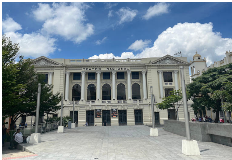
La reforma aprobada hace unos días, establece que un bien inmueble monumental, declarado cultural podrá ser intervenido para su puesta en valor, en consideración del alto tráfico de usuarios del mismo, su mantenimiento, y el uso y goce de la población salvadoreña.

“Consideramos que estas terminaciones cruciales sobre la cultura y el patrimonio nacional deberían ser tomadas por expertos técnicos como arqueólogos, historiadores, arquitectos o museólogos, y no basarse en criterios políticos como sugiere la reforma propuesta. Esta modificación pone en grave riesgo la preservación adecuada del patrimonio