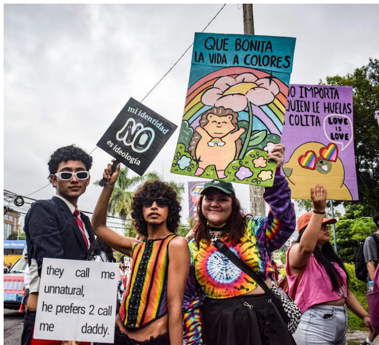
Con banderas, pancartas, trajes coloridos y más, salvadoreños celebran el Día Internacional del Orgullo LGBTI o Día del Orgullo Gay.

La Fundación de Estudios para la Aplicación del Dere-