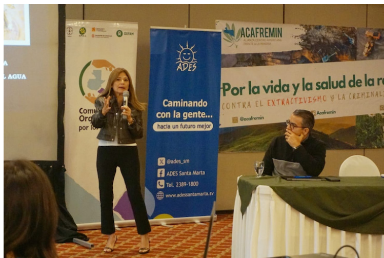
Abogada indica que el actual modelo de desarrollo está basado en un paradigma de dominación y explotación de la naturaleza.

«Siempre se nos ha hecho creer que el agua es escasa, (...) esta es una posición totalmente simplista y engañosa», explicó Cortez, en el «Foro Regional Comunitario por la Vida y la Salud de la Región Contra el Extractivismo y la Criminalización». «La mayoría (de las personas) que no tienen acceso al agua viven en entornos naturales», señaló la abogada. «El agua está ahí, pero esa agua está con-