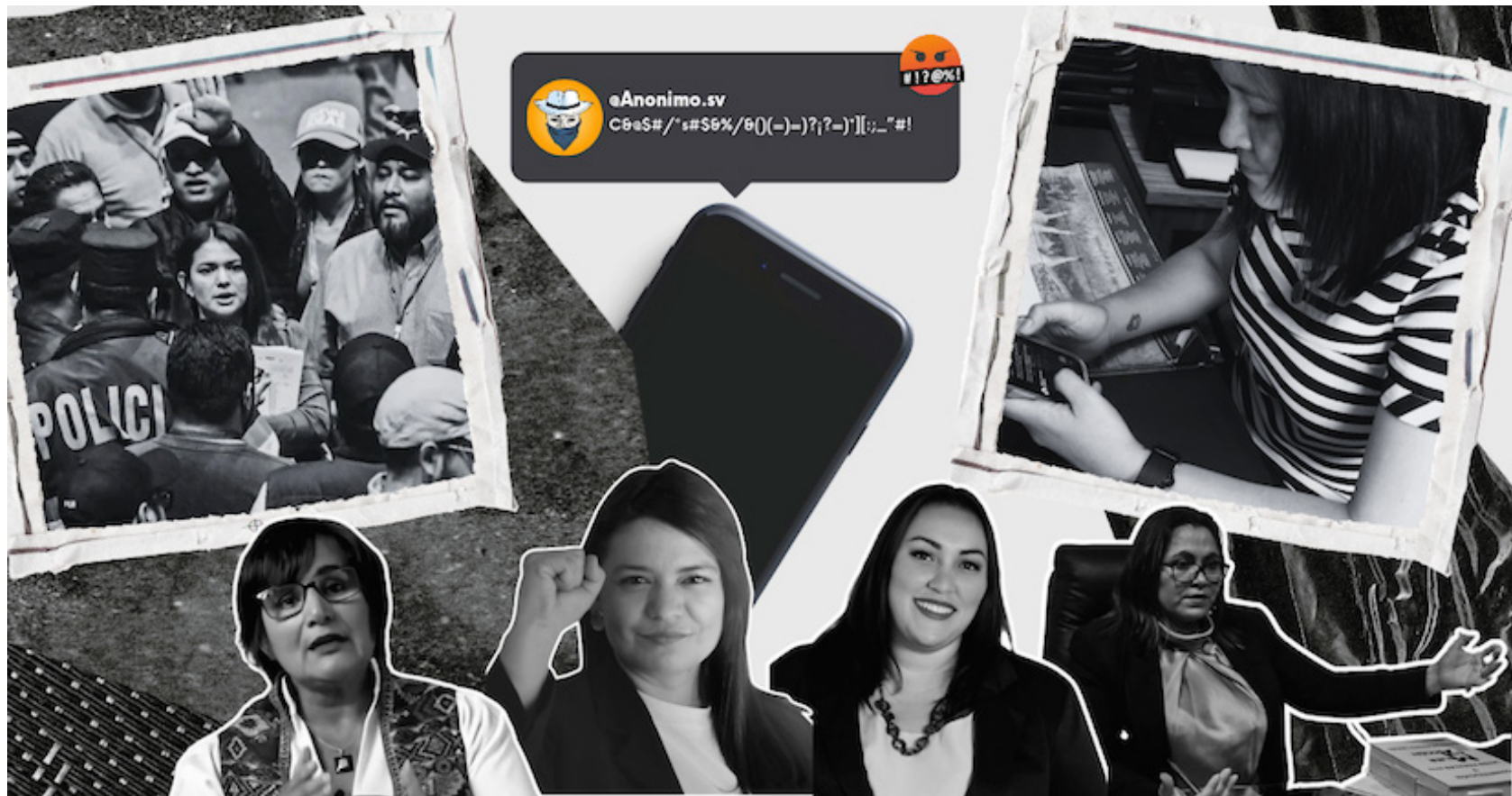
Desde burlas por su aspecto físico y acoso sexual, hasta amenazas de muerte. Esa es la realidad de mujeres defensoras de DD.HH. y políticas, quienes sufren violencia en redes sociales.

Rebeca Henríquez Samuel Amaya @DiarioCoLatino