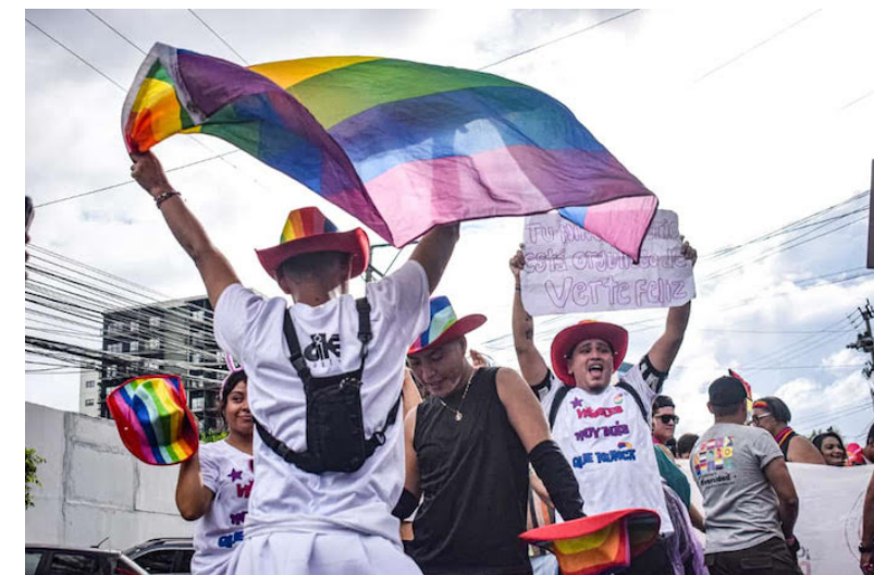
Miembros de la comunidad LGBTIQ+ salen a las calles de San Salvador a exigir el cumplimiento de sus derechos.