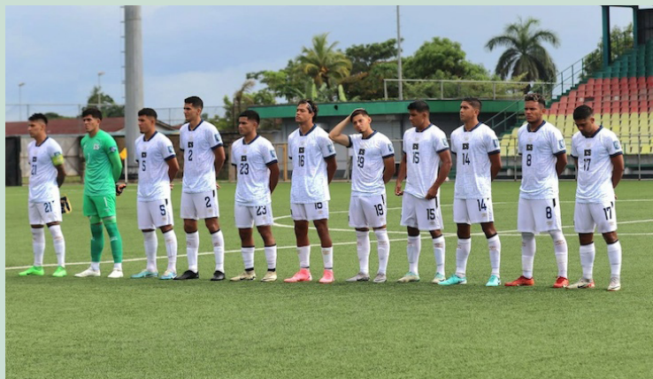
El Salvador vence a San Vicente y las Granadinas 1-3 en el segundo partido de las eliminatorias de la CONCACAF.