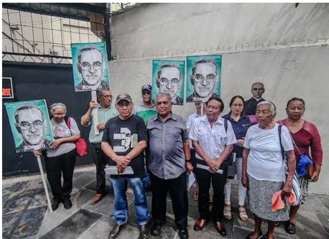
Miembros del Comité Nacional Monseñor Romero se pronuncian ante los problemas coyunturales del país.

Dicho cuadro fue inaugurado el 16 de enero de 2014, y gozaba de medidas de protec-