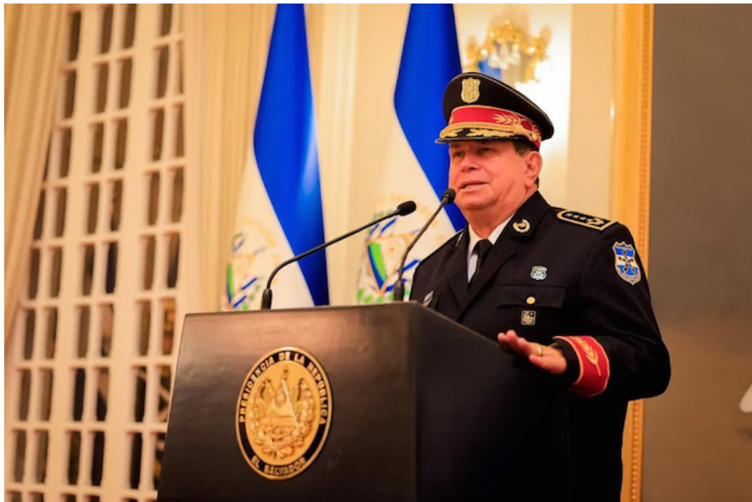
Mauricio Arriaza Chicas seguirá al frente de la Policía Nacional Civil en el periodo inconstitucional de Nayib Bukele.