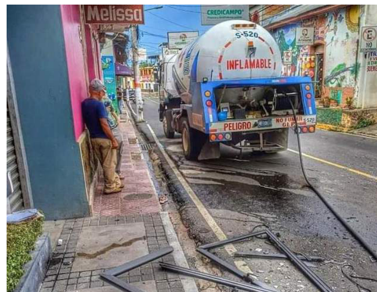
Una explosión de gas ocurrió cuando un camión cisterna abastecía a un restaurante en el barrio El Calvario, Ilobasco, Cabañas, aproximadamente ocho personas resultaron lesionadas.

La recomendación es que mientras una pipa esté suministrando gas licuado, no es debido tener ninguna cocina encendida, porque si existiera una fuga ya sea del depósito donde están suministrando o en la manguera proveniente de la cisterna, es cuestión de segundo en generar un incendio o explosión, por la acumulación de gas en el interior y hacer contacto con el fuego utilizado para cocinar.