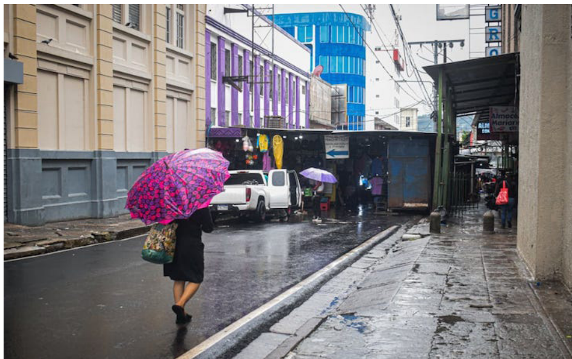
Para este lunes se prevé el paso de lento de una onda tropical, sumado a la humedad desde el Pacífico y el Caribe, contribuyen a generar las lluvias y tormentas en el país.

La Dirección General de Protección Civil dejó sin efecto la alerta naranja emitida el sábado 22 de junio, a su vez declaró alerta amarilla a escala nacional por lluvias y tormentas en la cordillera volcánica y zona norte.