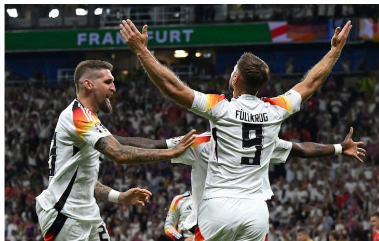
Niclas Füllkrug, de Alemania, empata ante Suiza en la Euro 2024.

A los 83', en el que parecía ser el segundo para que Suiza sentenciara el primer lugar del grupo y la victoria, el juez desvalidó la acción, que más tarde el equipo lamentaría a minutos de gritar la victoria porque Niclas Füllkrug apareció a los 90+2' para empatar 1-1 en el Deutsche Bank Park.