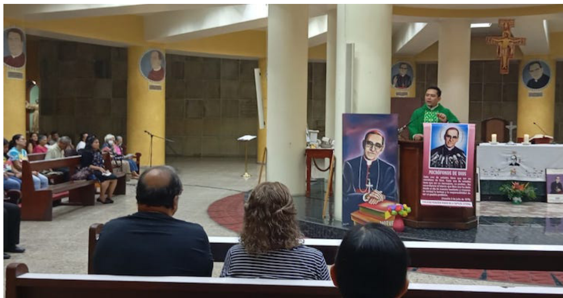
Durante la eucaristía dominical, Comunidad de la Cripta de Monseñor Romero reflexiona junto a la feligresía el mensaje profético del obispo mártir.

Hasta la fecha su asesinato no ha sido esclarecido y los responsables no han sido juzgados por la ley.