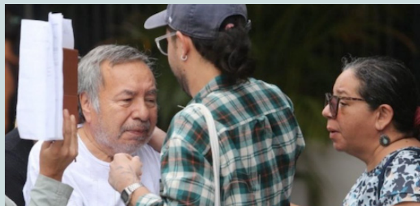
El Estado salvadoreño no respeta el derecho humano a la salud y la vida de los veteranos y ex combatientes capturados arbitrariamente, al negarles medicamentos para sus enfermedades crónicas.

nal Civil (PNC) no cumplió con la orden del Tribunal y trasladó al dirigente de la ex guerrilla del FMLN y firmante de los Acuerdos de Paz, a las bartolinas conocidas como el “El Penalito”, en San Salvador.