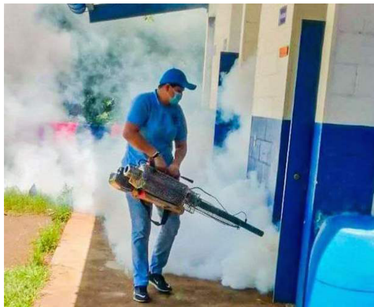
El Ministerio de Salud hace un llamado a la población para sumarse a las diferentes labores, a fin de erradicar los criaderos de zancudos.

Recordó que el pasado 18 de junio la Organización Panamericana de la Salud (OPS) emitió una alerta para la región de las Américas, donde el número de casos de dengue asciende a 9.3 millones, el doble