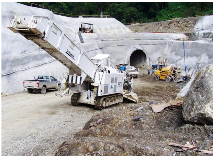
El Ministerio de Medio Ambiente y Recursos Naturales (MARN) de Guatemala, al dejar sin efecto la resolución dictada en el caso del proyecto minero Cerro Blanco, que autorizó la actualización del estudio de impacto ambiental.

“Este es un hecho irrefutable, y, sustentado con varios estudios a lo largo de los años por profesionales calificados. Además, es la voluntad del pueblo miteco expresada en la consulta de vecinos del 18 de septiembre de 2022; la decisión del gobierno guatemalteco obedece a varias anomalías encontradas en los expedientes, entre ellas, pre-