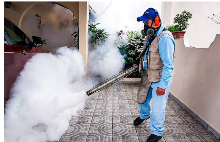
Protección Civil y el Ministerio de Salud inician la campaña de fumigación para reducir el riesgo de la proliferación del zancudo transmisor del dengue, zika y chikungunya.

El ministro de Salud, Francisco Alabí, manifestó que hasta la fecha circulan cuatro cepas del dengue, siendo la del tipo 2 la de ma-