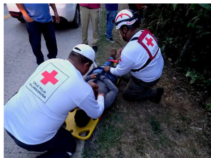
“Los socorristas exponen su vida y dan voluntariamente su tiempo para servir a quien lo necesita” concluyó Saldaña.

Los síntomas suelen comenzar de 4 a 10 días después de la picadura de un mosquito infectado, lo más común es la fiebre acompañada de náuseas, vómitos, sarpullido, dolor muscular, en las articulaciones y molestias generalmente detrás de los ojos.