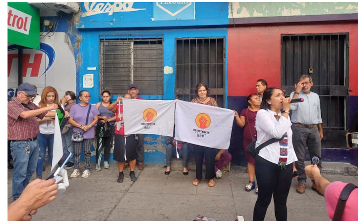
El BRP señaló que esta actividad es en solidaridad a los veteranos y ex combatientes, así como para denunciar las condiciones de salud y pedir su inmediata libertad.