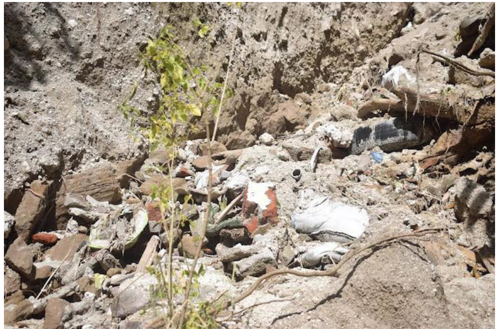
La cárcava, que inicialmente comenzó con un árbol caído, avanza hacia las casas cercanas.

sión de invertir en aquellos lugares en donde se necesita”, puntualizó Figueroa.