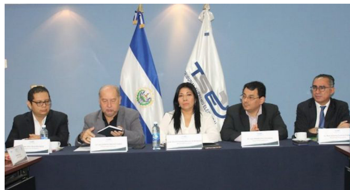
Observa El Salvador 2024 considera que los principios de democracia, pluralismo, participación, y transparencia deben guiar la elección de los nuevos magistrados al TSE.

Además, es necesario que la Asamblea Legislativa de más recursos, para reforzar la Fiscalía, opina el representante de FESPAD. Pero sugiere que la Fiscalía tenga controles adecuados sobre el ejercicio de la acción penal y evitar que personas inocentes sean procesadas.