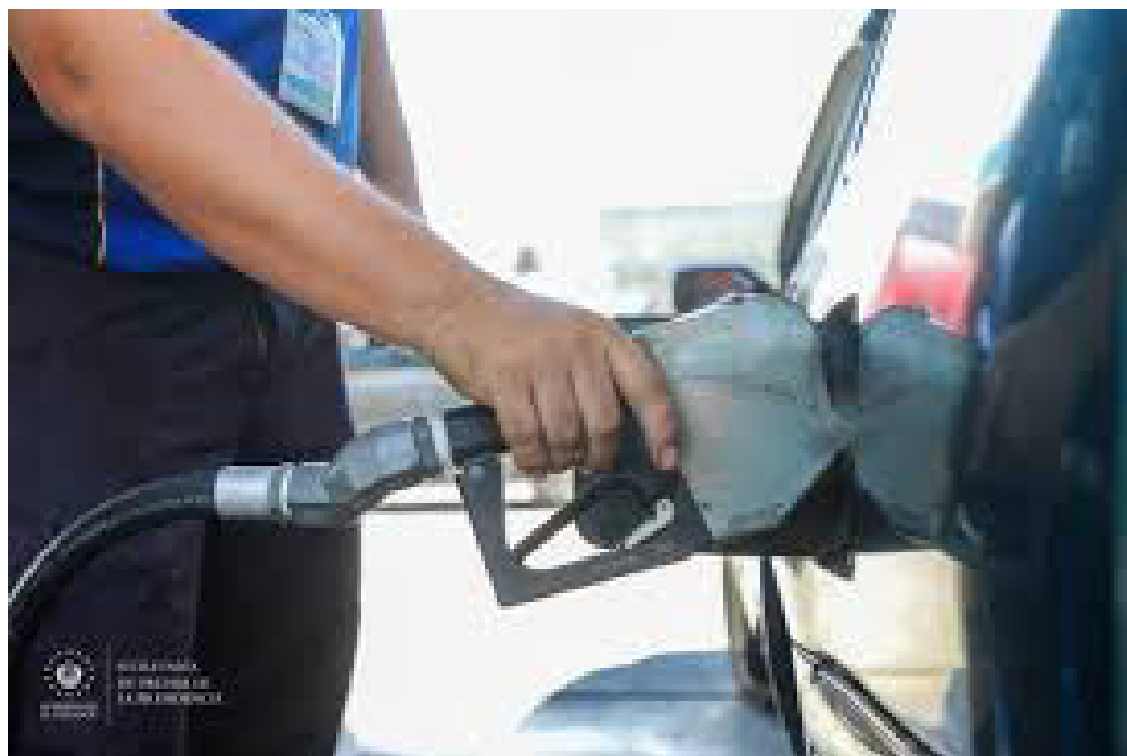
Para el período del 25 de junio al 8 de julio de 2024, el precio del Diésel se sitúa en $3.67 en la zona central, la Gasolina Regular en $3.94 y la Gasolina Especial en $4.19. Estas cifras representan una ligera variación respecto al mismo período del año.

A la fecha del 25 de junio al 8 de julio de 2024, en la zona central del país, el Diésel se vende a $3.67 por galón, la Gasolina Regular a $3.94 y la Gasolina Especial a $4.19. Estos precios muestran una ligera variación en comparación con el mismo período del año