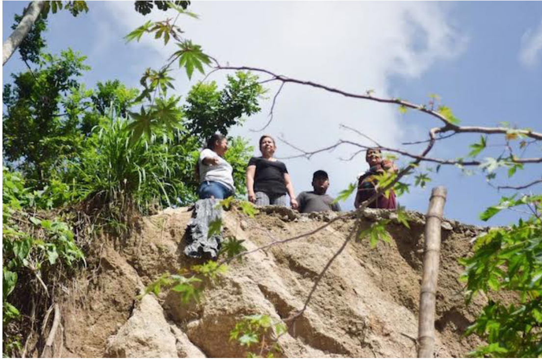
Líderes comunitarios denuncian que las autoridades, luego de meses de gestiones, no resuelven el problema de una cárcava.

“En la asamblea comunitaria se llegó al acuerdo de presentar la problemática de