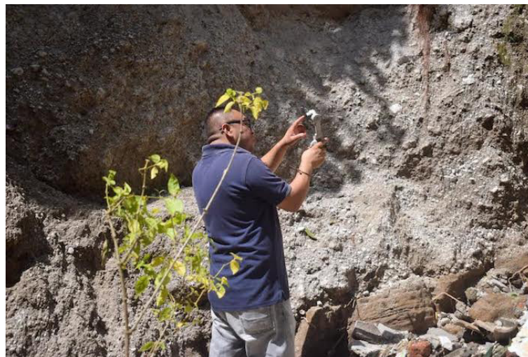
Familias afectadas señalan la falta de atención a la comunidad Brisas del Sur de Santo Tomás por parte de la alcaldía de San Salvador Sur.