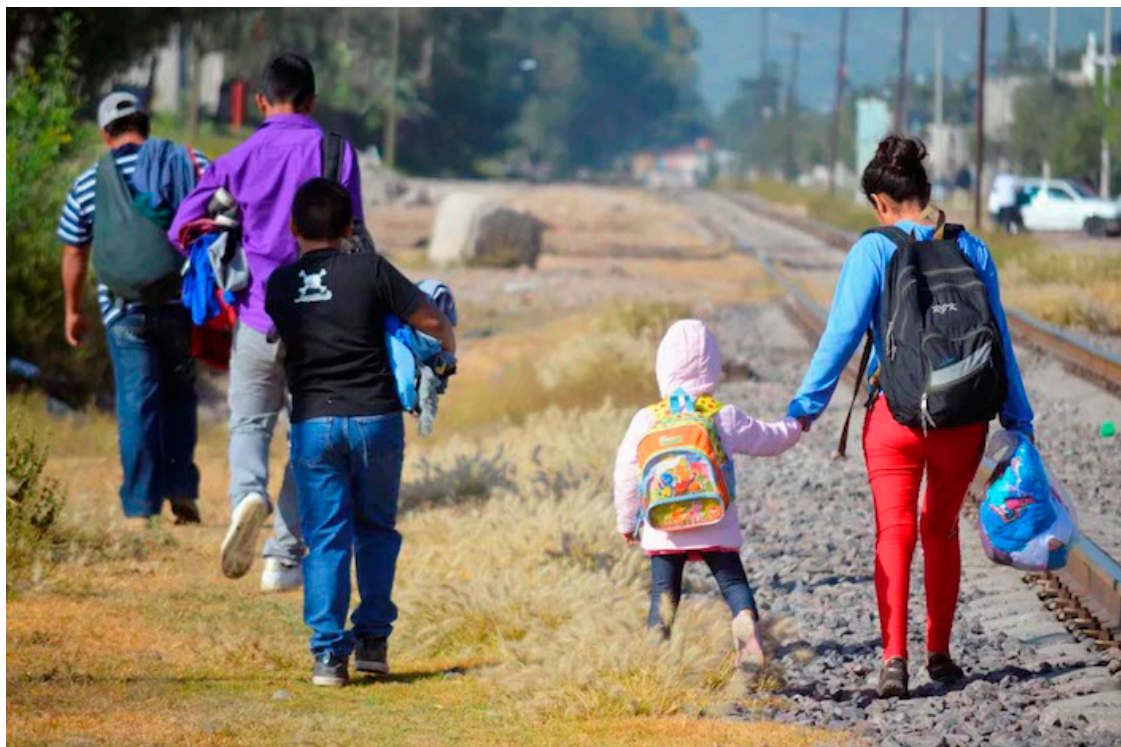
El flujo migratorio de El Salvador a Estados Unidos se ha reducido, con 17,179 migrantes registrados de enero a abril de 2024, en comparación con 19,271 en el mismo período de 2023.

Según el Departamento de Estado, para 2023 las autoridades iniciaron 38 nuevas investigaciones de casos sospechosos de trata -de un total de 78 casos supuestos-, un leve aumento respecto a los 36 casos investigados en 2022. Además, se iniciaron procesos contra 43 sospechosos en 17 casos, que representa un incremento significativo en comparación con el año anterior.