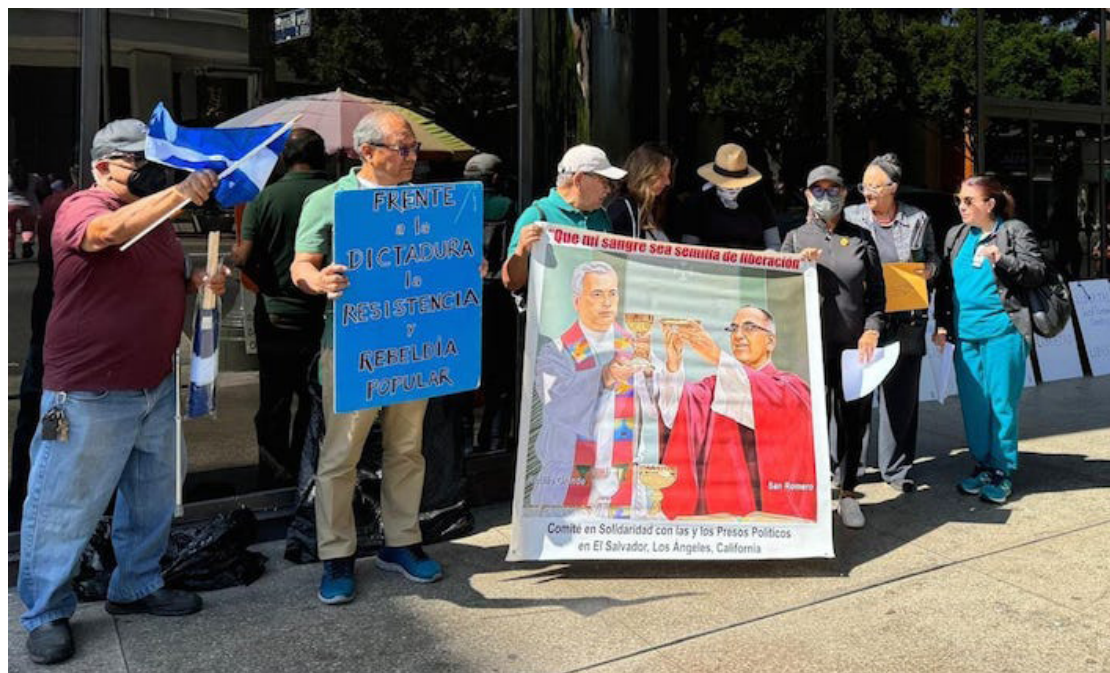
Salvadoreños se reúnen en California para exigir la liberación inmediata de veteranos detenidos.

En este contexto, Alma de Izote, La Chiltota Rebelde, Comité en Solidaridad con el Pueblo de El Salvador, Diáspora Democrática en Resistencia, Nación Salvadoreña en El Exterior, Movimiento de Víctimas del Régimen-USA, respaldados desde El Salvador por: Bloque de Resistencia y Rebeldía Popular, Comité de Familiares de Personas Presas y Perseguidas Políticas, MOVIR, y Socorro Jurídico Humanitario, solicitaron que se garantice la integridad física y el pleno