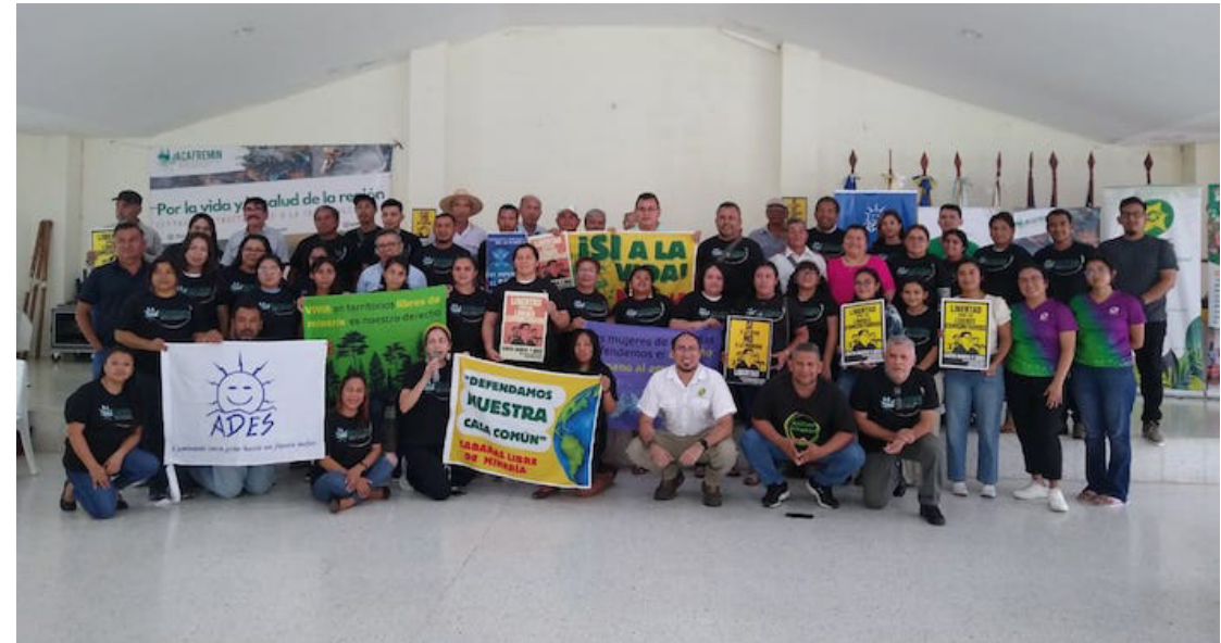
ACAFREMIN, realiza su IX Encuentro Regional: Por la Vida y la Salud de la Región contra el Extractivismo y la Criminalización, que se desarrolla entre el 26 al 28 de junio, a fin de analizar y compartir experiencias sobre el proceso de “regresión democrática”, en la región.

“En Centroamérica, el tema de los defensores y los periodistas, incluso, hay que hacer una lucha articulada en alianza con otros autores y también explorar más la espiritualidad. Yo