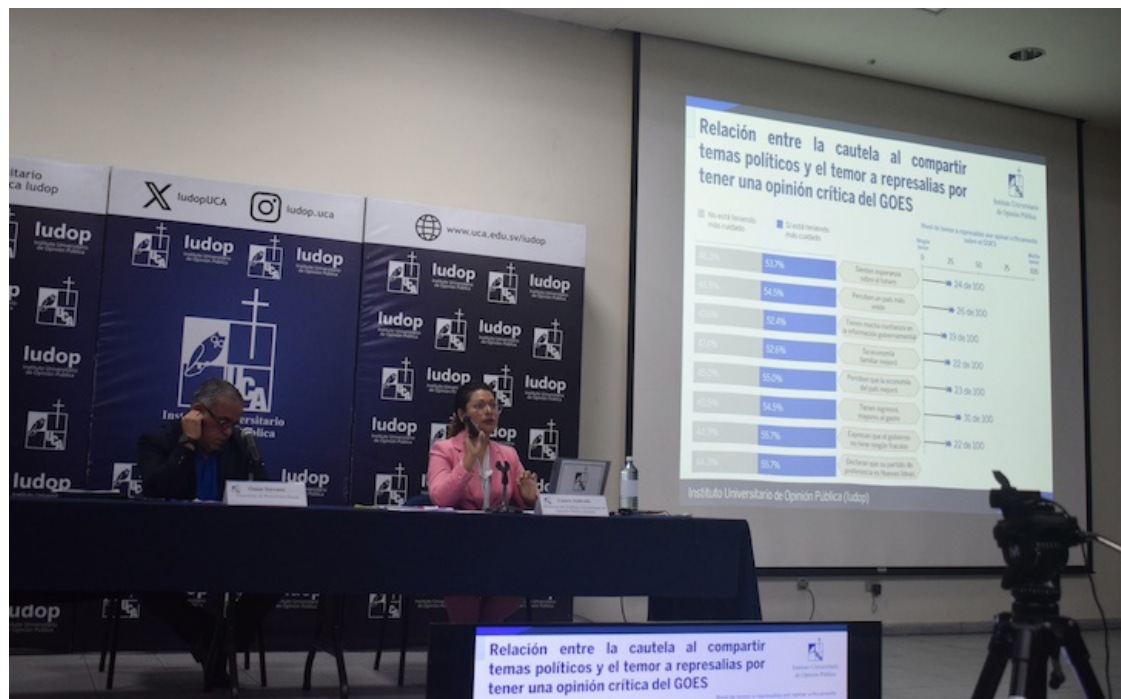
La encuesta de la UCA indica que 5 de cada 10 personas siente algún nivel de temor a sufrir represalias, por expresarse sobre las acciones gubernamentales.

El 38.2% de la población consideró que la situación económica del país ha mejorado, mientras que, el 36.8% afirmó que ha empeorado y un 23.7% no ha tenido cambios significativos. Además, el 45.3% sostuvo que su situación económica familiar con el actual gobierno se ha mantenido igual, el 29.3% que ha mejorado y el 23.9% ha empeorado.