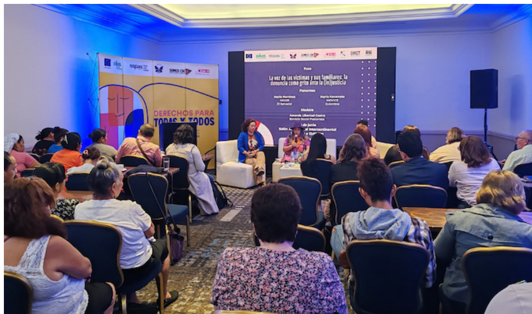
En esta ocasión se realizó un foro abierto donde las organizaciones de víctimas de estos procesos compartieron su experiencia.

Este jueves 27 de junio se realizará otro foro sobre el rol de la comunidad interna-