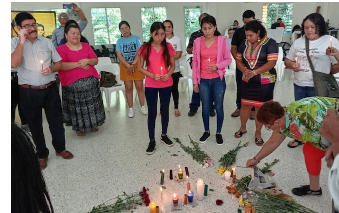
Los pueblos Chortí y Q'eqchi' realizan la ceremonia de agradecimiento a la madre tierra en el IX Encuentro de ACAFREMIN, en donde participan organizaciones sociales y ambientales de la región centroamericana.

“Son casos como Nicaragua, Guatemala, El Salvador que podemos ver, cuando se han comenzado a remodelar instituciones, reformado las leyes, y también están empezando a instalar operadores