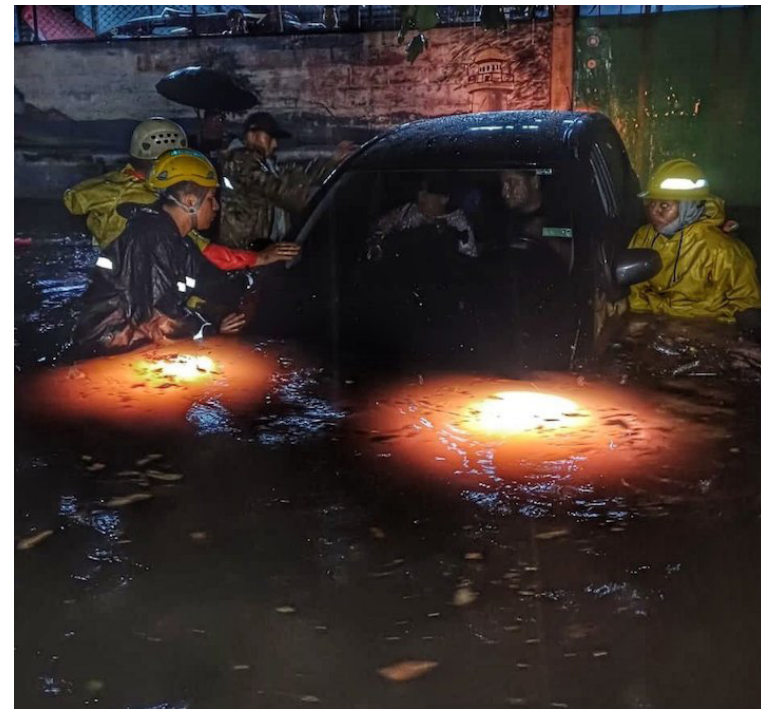
Un vehículo fue arrastrado por la fuerza del agua debido a la inundación de una calle, en la colonia Santa Lucía, Ilopango.

Este sistema encontrará condiciones para un desarrollo gradual cuando alcance las costas caribeñas de Honduras o suroeste del Golfo de México a finales de esta semana.