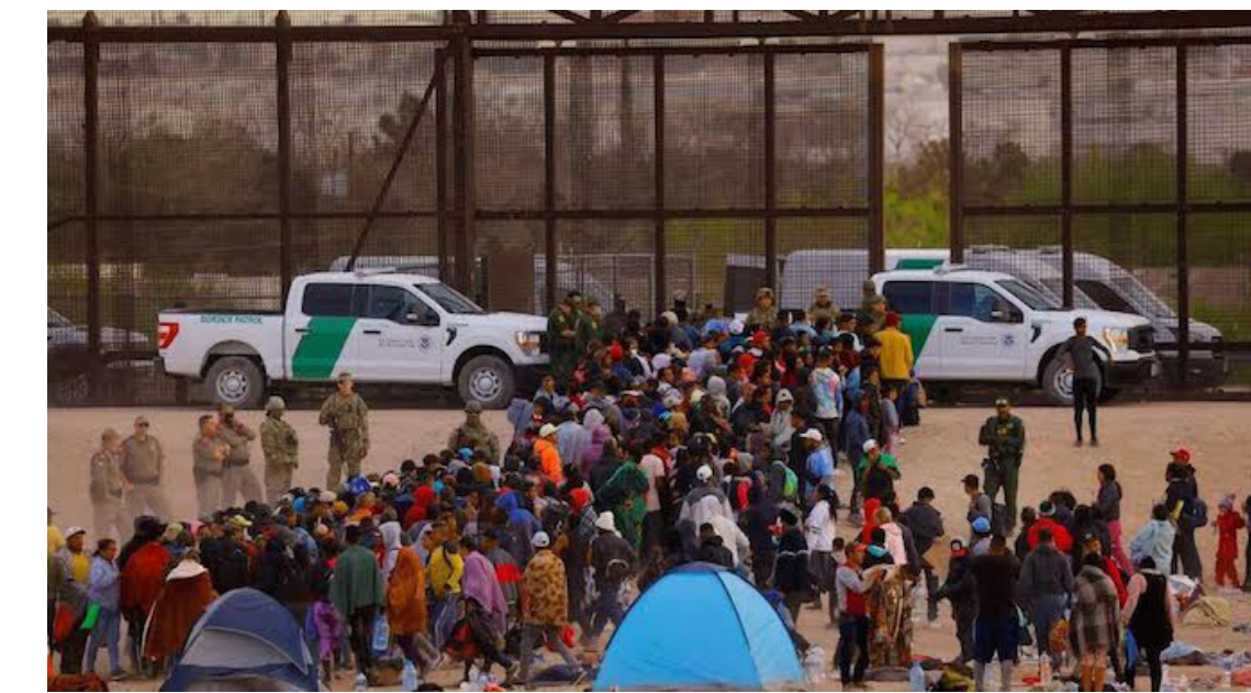
La CBP identifica una disminución en el flujo migratorio irregular desde El Salvador a EEUU. En enero de 2024 se registraron 3,661 migrantes salvadoreños, frente a los 3,885 de enero del 2023.

Cuba está en el 5º lugar, con 100,190 migrantes, un incremento notable del 128.79% en comparación con los 43,747 de 2023. Guatemala, en 6º lugar, registró 86,819 migrantes, un aumento del 21.64% frente a los 71,372 de 2023. Ecuador, en 7º lugar, registró 62,438 migrantes, un aumento del 67.30% frente a