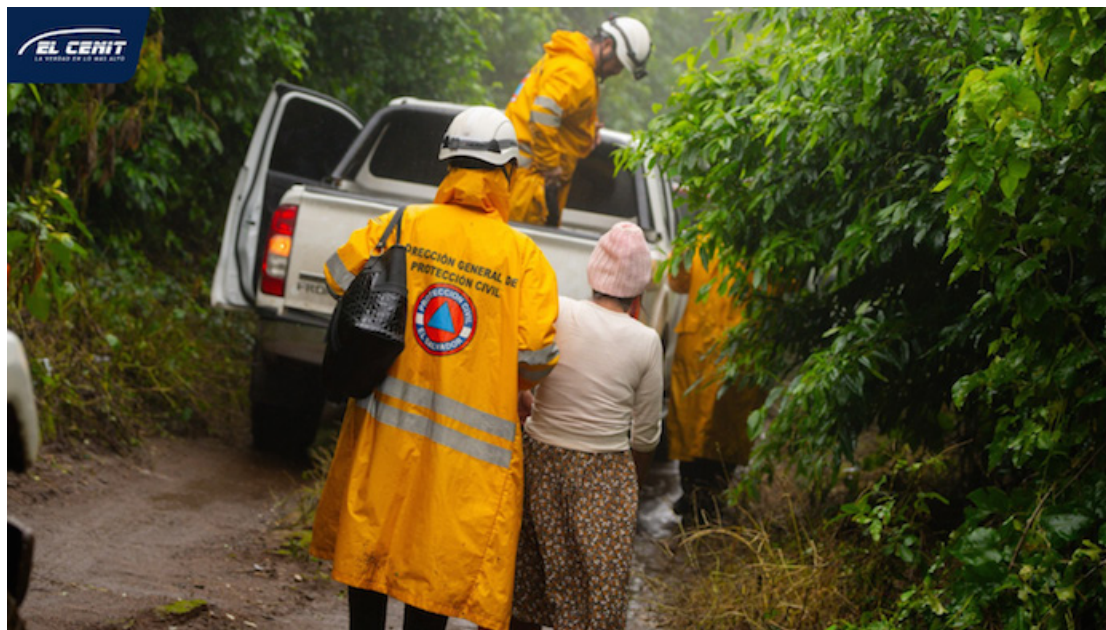
La gestión de riesgo debe ser preventiva, correctiva y reactiva o emergencia para que cumpla con una atención integral.