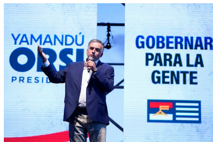
Yamandú Orsi, del Frente Amplio.

Esto generó algunos silbidos como muestra de rechazo entre los militantes que de-