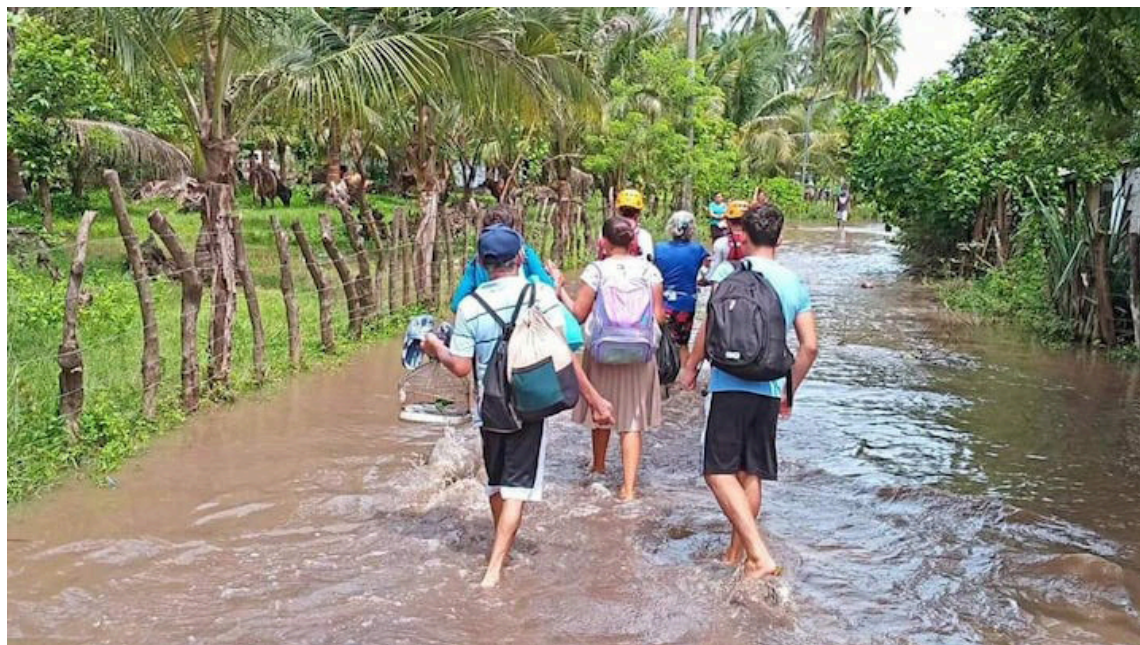
Varias familias de las comunidades del cantón de Puerto Parada, Usulután, fueron evacuadas, por el desbordamiento del río Grande, de San Miguel.

Según el funcionario, esta será una temporada de huracanes por encima de lo normal, para el país significa lluvias de dos tipos: tormentas eléctricas que pueden ser intensas, muy fuertes por las tar-