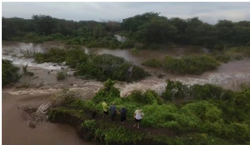
Debido al desbordamiento del río Grande de San Miguel, colapsó la borda en el sector conocido como La Cañada, Puerto Parada, Usulután.

Las condiciones de lluvia pronosticada para las próximas horas y la acumulación de humedad en el suelo, debido a las lluvias registradas, indican probabilidad media de flujos de escombros, deslizamientos y caída de rocas que pueden generar impactos significativos y producir daños en carreteras, caminos e infraestructura.