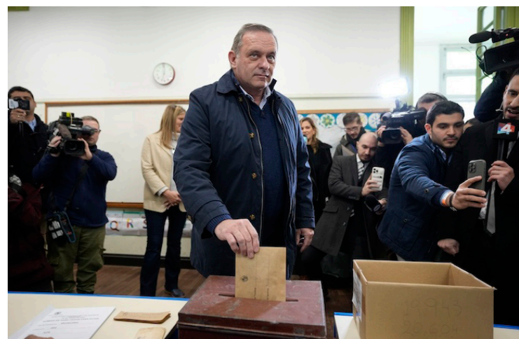
Alvaro Delgado, candidato del Partido Nacional.