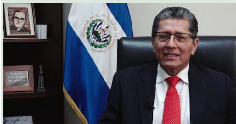
El ex funcionario es procesado por irregularidades, según comentó el Ministerio Público Fiscal.

Miranda Flamenco fue viceministro de Cooperación para el Desarrollo del Ministerio de Relaciones Exteriores entre 2009-2013 y 2014-2018. Luego fue ministro de Relaciones Exteriores entre 2013 y 2014. Por último, fue viceministro de Integración y Promoción Económica, periodo 2018-2019.