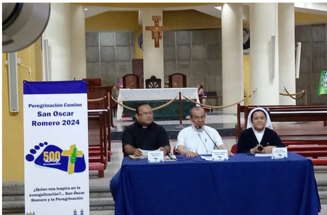
La Iglesia Católica en El Salvador invita a la población a participar de la Séptima Peregrinación “Camino de San Oscar Romero”, a realizarse los días 01, 02 y 03 de agosto de 2024.

La peregrinación, el 1 de agosto, comenzará con la Santa Eucaristía, en la cripta de Catedral Metropolitana, a