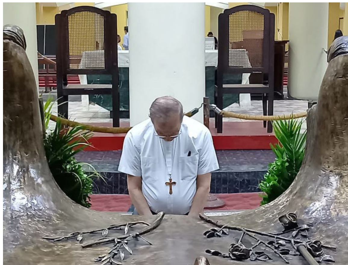
Cardenal Gregorio Rosa Chávez., afirma que en una democracia no se puede tomar lo anormal como normal en el marco del respeto de los derechos humanos de la población.

El cardenal dijo que hay hechos tan ejemplarizantes sobre el concepto de democracia y citó las elecciones de Francia e Inglaterra, en la cual, su población “se expresó con toda libertad”, y por lo mismo, las autoridades han aceptado la decisión de la gente y por su opción en particular.