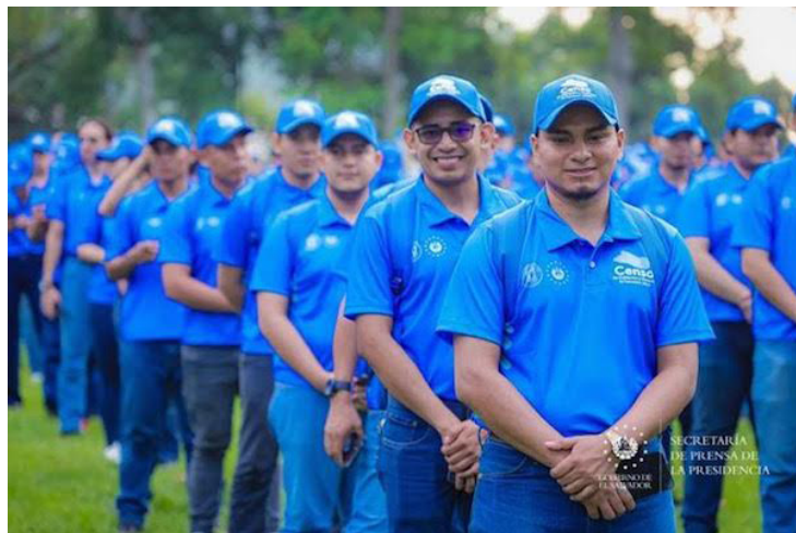
La ley establece un régimen presupuestario especial para la función estadística y censal, en donde los “gastos de funcionamiento, censos, inversión, proyectos y otros de la Oficina Nacional de Estadística y Censos formarán parte del presupuesto anual del Banco Central.

La Asamblea Legislativa de El Salvador aprobó, con 56 votos a favor, una reforma a la Ley Especial de Estadística y Censos, contenida en el Dictamen No. 2. La reforma interpreta auténticamente el artículo 57 de dicha ley, ampliando las exenciones tributarias para proveedores y sub-proveedores del Banco Central de Reserva (BCR) en el marco de la realización de censos nacionales.