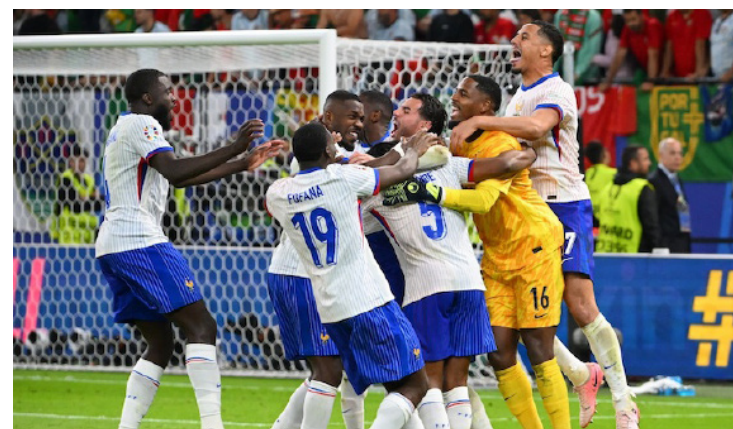
Francia clasifica a las semifinales de la Euro 2024.

Para Francia marcó en penales: Hernández, Barcola, Koundé, Fofona y Dembélé, mientras