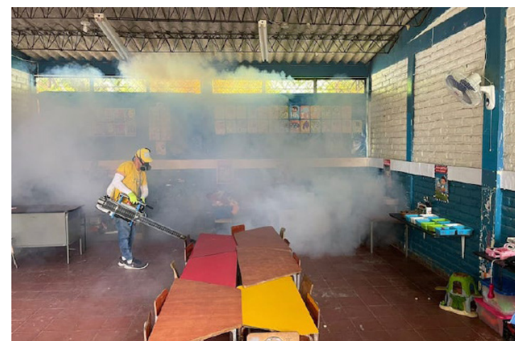
El Ministerio de Medio Ambiente intensifica las jornadas de fumigación, para reducir los criaderos de zancudo transmisor del dengue, zika y chikungunya.

Francisco Alabi, ministro de Salud, informó que por el momento hay tres fallecidos por dengue y siete pacientes ventilados en estado grave, sin embargo, uno de ellos está progresando para poderse extubar. El total de pacientes ingresados