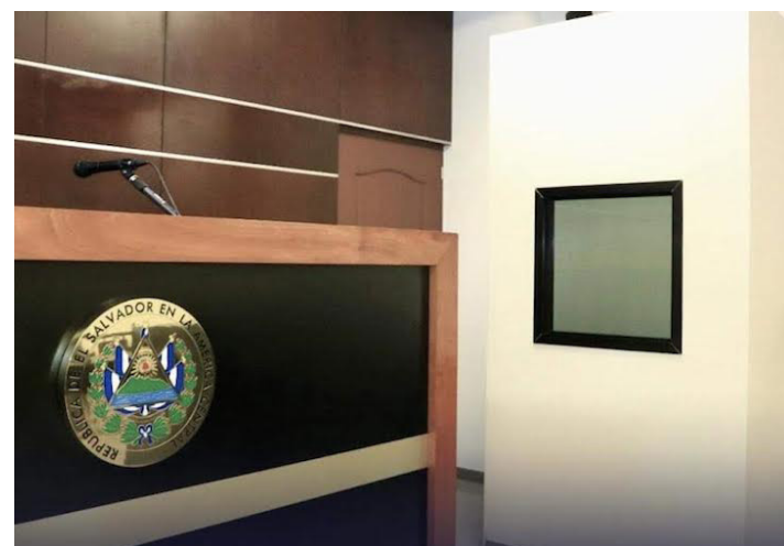
En redes sociales muchos son víctimas de estafadores quienes piden depósitos por la venta de un producto o servicio.

Al no recibir el celular, decidió consultar y le manifestaron que debía depositar los otros $110.00, para entregarle el aparato ese mismo día por la tar-