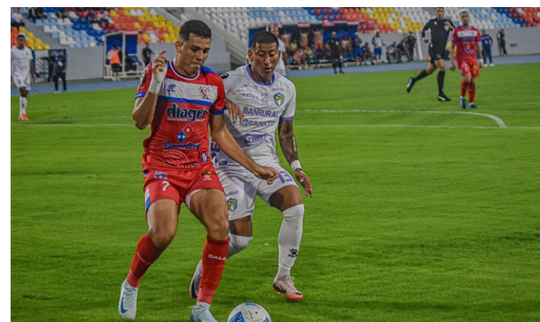
Firpo empata 1-1 con Comunicaciones en el primer encuentro de Copa Centroamericana.