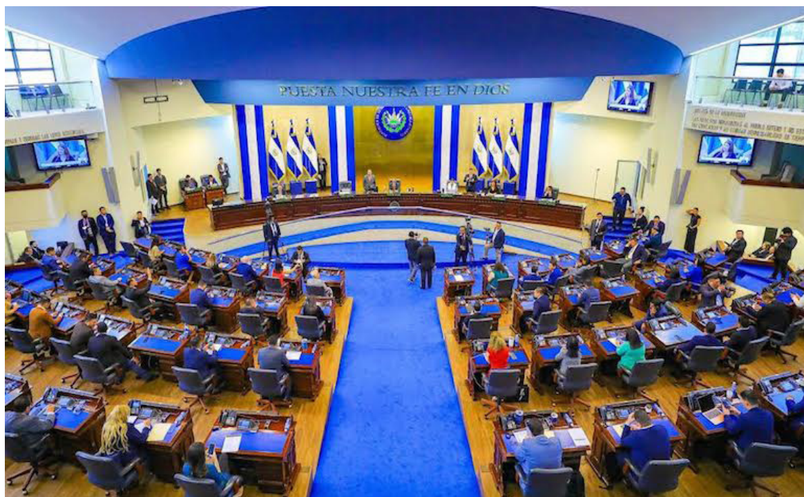
Asamblea Legislativa aprueba asignar $204 millones para diversas instituciones del Estado sin especificar para qué serán utilizados.

Ministerio de Justicia y Seguridad Pública, $78.7 millones; Ministerio de Educación $74.4 millones; Dirección Gene-