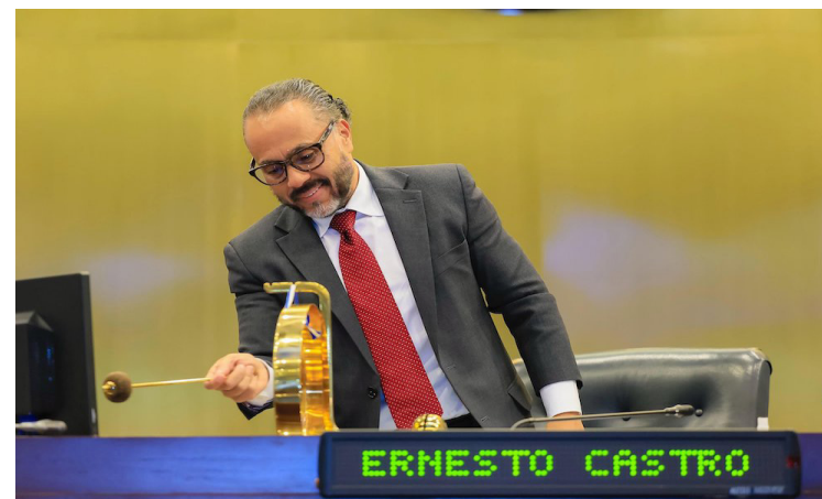
La Asamblea Legislativa regresa a estudio de comisión el dictamen donde contenía todos los aspirantes a magistrados del TSE.