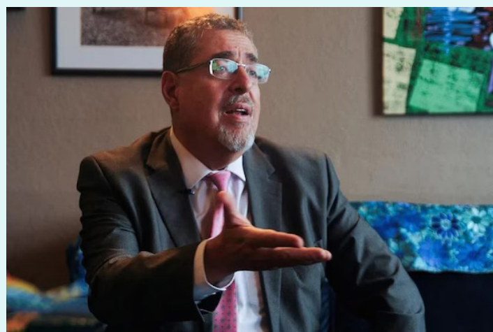
Ciudad de Guatemala/Prensa Latina