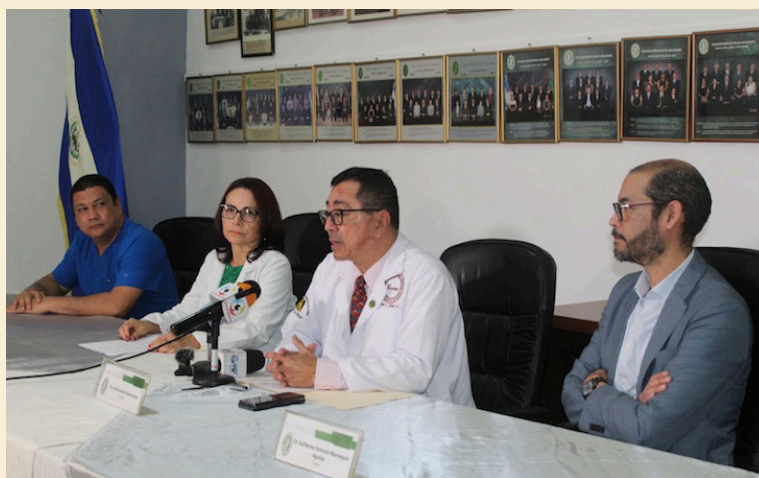
El Colegio Médico recomienda a la población continuar en estas vacaciones agostinas, con las medidas para prevenir el dengue. Foto Diario Co Latino/@colmed_es.

“El dengue no ha llegado a su mayor cantidad de casos, estamos por entrar al fenómeno