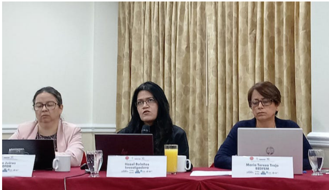
La presentación del Informe sobre la Situación de Derechos Humanos de las Mujeres en El Salvador (2012-2022), lo presenta la colectiva de organizaciones vinculadas a la Red Feminista Frente a la Violencia contra las Mujeres (REDFEM), Las Dignas, Las Mélidas y ORMUSA.