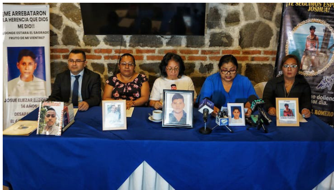
Familiares denuncian que muchos de los casos de personas desaparecidas han sido archivados y se mantienen en impunidad.