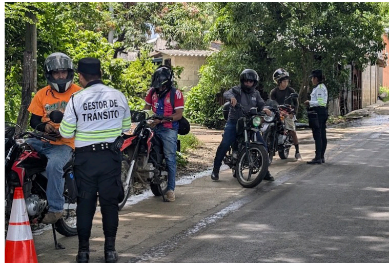
El VMT intensifica los dispositivos de control antidoping a escala nacional, durante la temporada vacacional de agosto.

Asimismo, recaló que para este período vacacional lanzaron la campaña de seguridad vial “No Fue Un Accidente”, con el objetivo de hacer conciencia en la población sobre la importancia de una conducción segura, a ello se suma la campaña de asistencia vial de MOP Te Asiste, con el servicio de grúa totalmente gratis, para hacer uso solo es necesario llamar al