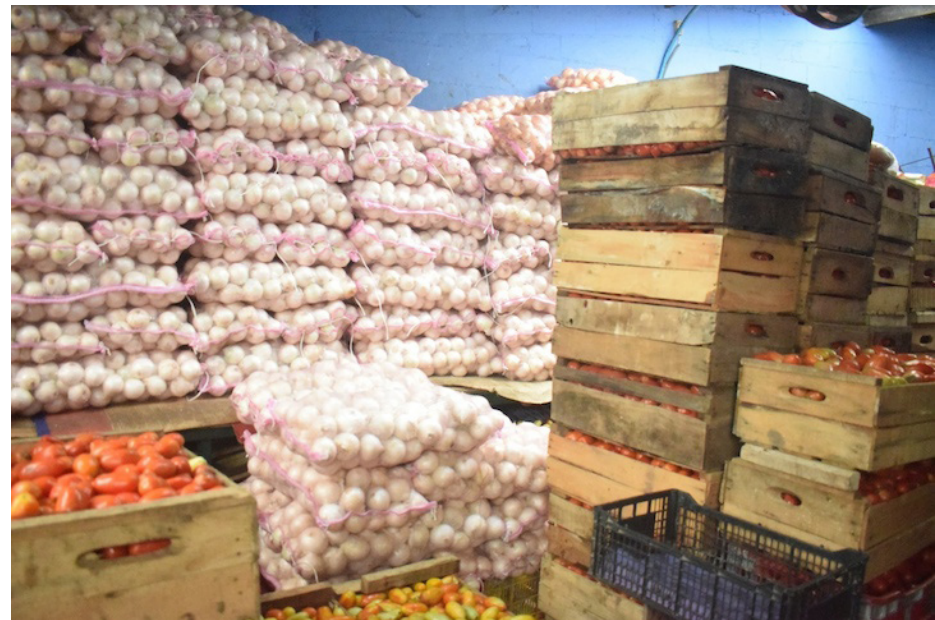
Según algunos comerciantes, los mayoristas no han rebajado precios a pesar de las “amenazas” del presidente Nayib Bukele.

“Nosotros no tenemos la culpa de que él diga una cosa, nosotros sabemos cómo compramos. Solo ganamos dos dolaritos con las cosas, como digo, él debería ir donde los mayoristas porque acá solo nos venden ellos y cómo nos va a amenazar si pagamos mensualmente los impuestos, no se puede”, concluyó una vendedora.