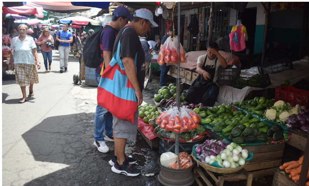
Compradores exigen a vendedores el mismo precio que los “Mercados a precios justos”.