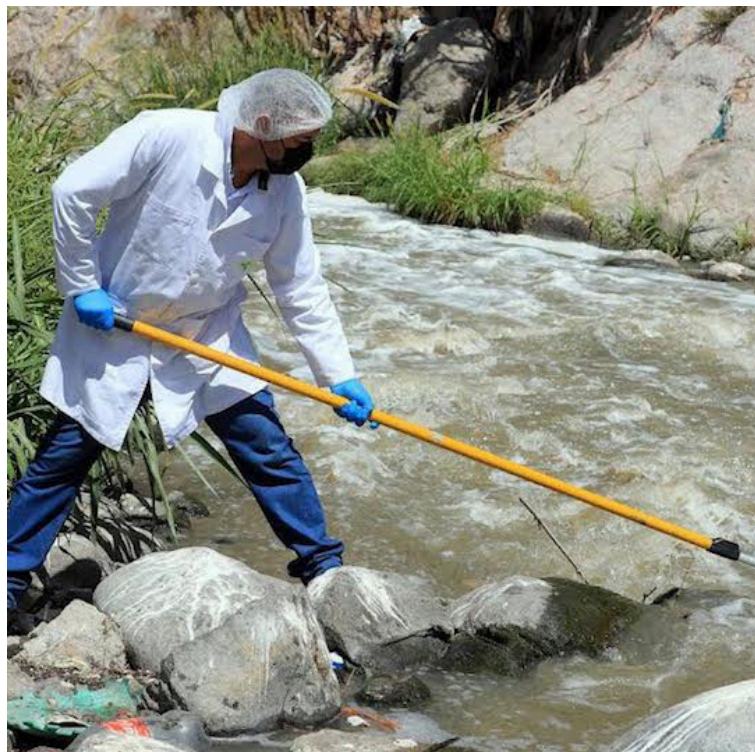
La aprobación de este préstamo siguió un proceso legislativo que comenzó el 20 de febrero de 2024, cuando la Asamblea Legislativa, mediante el Decreto Legislativo No. 952, autorizó al Órgano Ejecutivo en el Ramo de Hacienda a suscribir el Acuerdo de Préstamo con el Fondo Saudita para el Desarrollo.

La Asamblea Legislativa de El Salvador aprobó con 59 votos a favor el Dictamen Favorable No. 21, autorizando la incorporación de 311,250 millones de riales saudíes (equivalentes a $83 millones de dólares estadounidenses) provenientes del Fondo Saudita para el Desarrollo al Presupuesto General de la Nación. Estos fondos, destinados al Ramo de Hacienda y Especial de Presupuesto, se dirigirán específicamente a la Unidad Presupuestaria de Inversión para financiar el proyecto “Instalación de una Planta de Generación Eléctrica con Biogás en el Río Acelhuate”, con el objetivo de mejorar la infraestructura hídrica y energética de El Salvador.