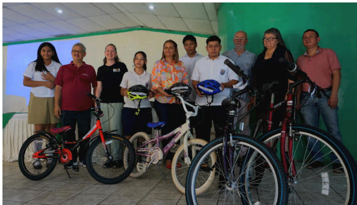
El Centro Salvadoreño Tecnología Adquirida (CESTA), entregó 35 bicicletas a los centros escolares “Cantón Los Mango” y “1° de julio de 1823” del municipio de San Salvador Norte.

Añadió que uno de sus programas más exitosos es “Sin bicicletas no hay planeta” el cual dio inicio en 2014 y busca incluir a centros educativos de diferentes zonas. “Decidimos trabajar con centros educativos porque consideramos que son los jóvenes los que van a cambiar dife-