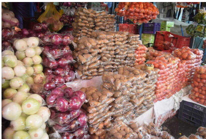
Vendedores comentan que las amenazas de Bukele deberían dirigirse solamente a los mayoristas.