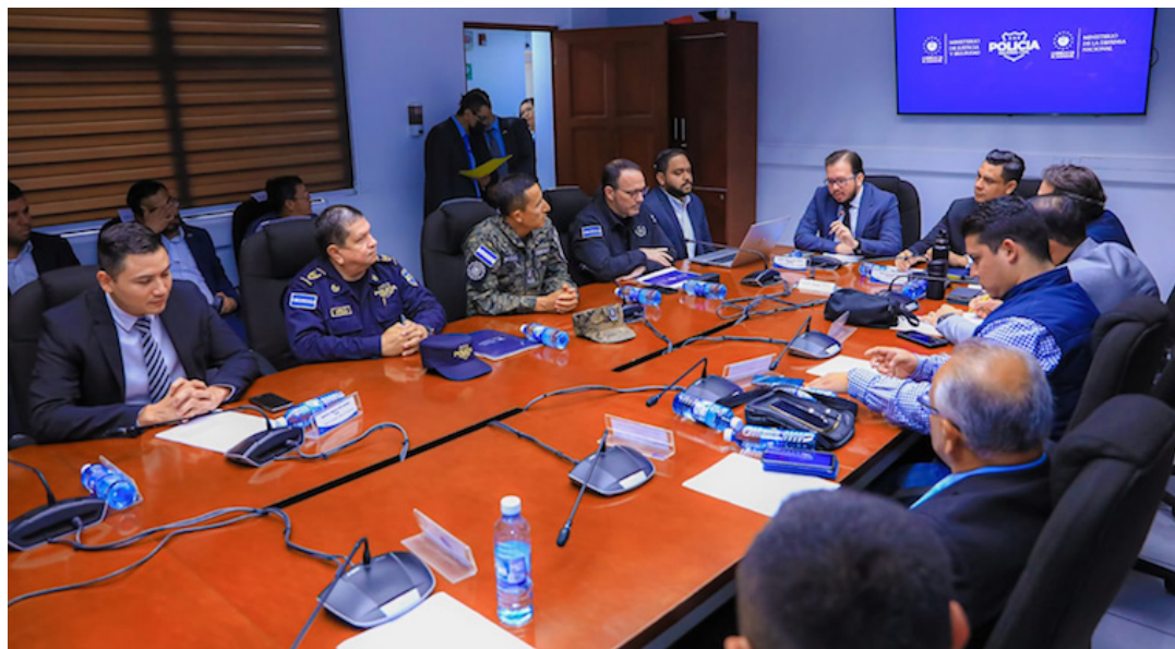
Comisión de Seguridad estudiará reforma para ampliar la detención provisional para delitos leves y graves.

En cuanto a las reformas al Código Penal, se pretende incrementar la pena por el delito de robo y