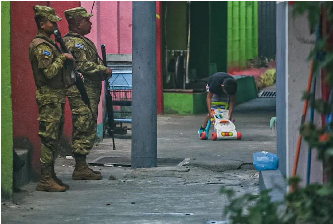
Menores de edad han sido víctimas de graves abusos en el régimen de excepción según plantea HRW en su último informe.

Al respecto, la directora de la División de las Américas de Human Rights Watch, Juanita Goebertus, sostuvo que el gobierno salvadoreño debería implementar una política de seguridad efectiva y respetuosa de los derechos humanos que desmantele las pandillas, prevenga el reclutamiento de niños y les proporcione protec-