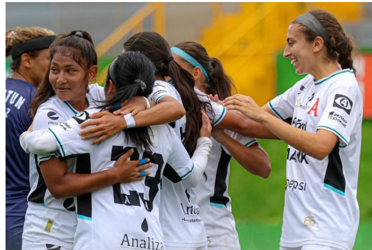
Alianza Women conquista la segunda victoria en la Copa Interclubes de UNCAF.

El grupo B está conformado por Unifut Antigua, de Guatemala, Santa Fe FC, de Pana-