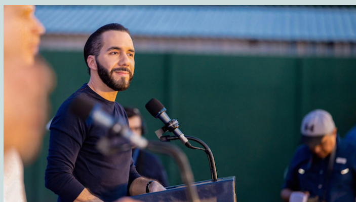
Donald Trump acusa a El Salvador de enviar a sus asesinos a Estados Unidos; entre tanto, Bukele no ha respondido de manera oficial.

Trump calificó al presidente salvadoreño como “un chico jo-