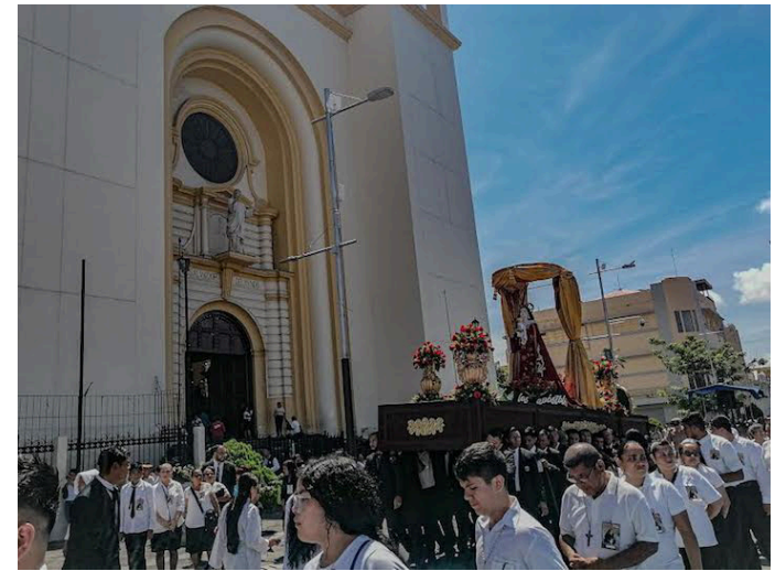
Feligresía católica recuerda a María Magdalena, la primer mujer discípula de Jesús.

“Para nosotros significa un testimonio de fe porque, así como María Magdalena en el pleno siglo XXI es un testigo fiel de que no solamente para los hombres hay oportunidad de salvación, porque si nos fijamos, dentro de los discípulos de Jesús únicamente hubo hombres, pero ella rompe con todos los esquemas, dando la oportunidad de ser testigo de aquel que anunció el evangelio,