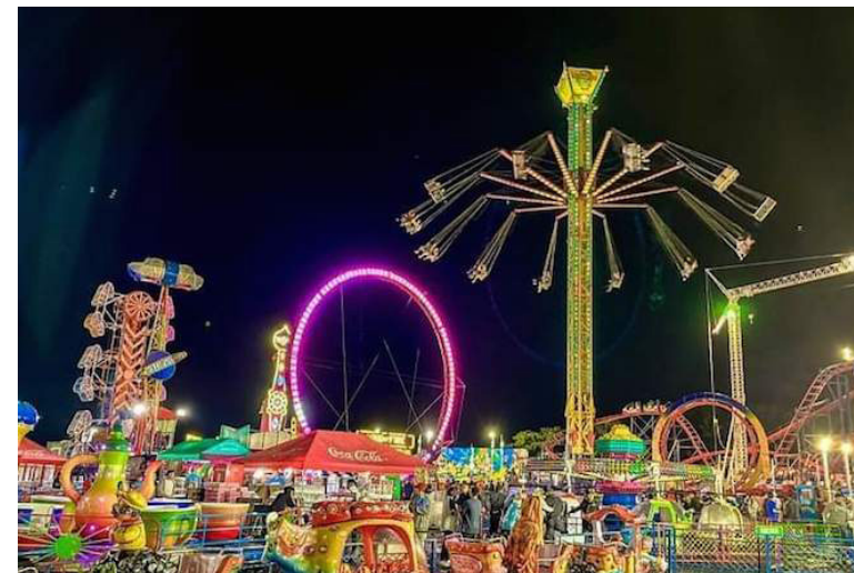
Desde el 1 al 6 de agosto la población podrá disfrutar del parque de diversiones "Sívar Land", donde podrán gozar de diferentes juegos mecánicos, presentaciones artísticas y una variedad de platillos.

var Land se gestionará el uso gratuito de los juegos mecánicos, para los niños de las comunidades del Distrito Capital, pero también se incluirá a los pequeños de los demás distritos