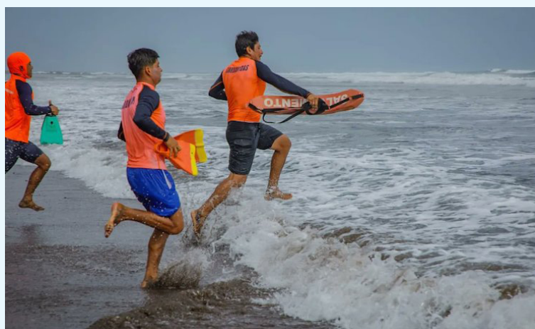
La Unidad de Guardavidas estará activa durante las vacaciones agostinas, en 110 puntos estratégicos de 28 playas a lo largo de la costa salvadoreña.

ción, Juan Carlos Bidegain, explicó que una de las principales actividades incluye la reducción de la accidentabilidad y concientizar a los conductores sobre la importancia de cumplir con las normas de tránsito.