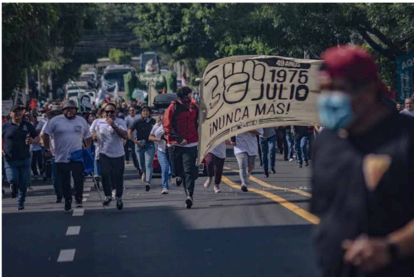
La marcha sale desde la Universidad de El Salvador hasta el paso desnivel entre la 25 avenida norte y Alameda Juan Pablo II, lugar donde en 1972 fueron masacrados estudiantes de la UES en una protesta.