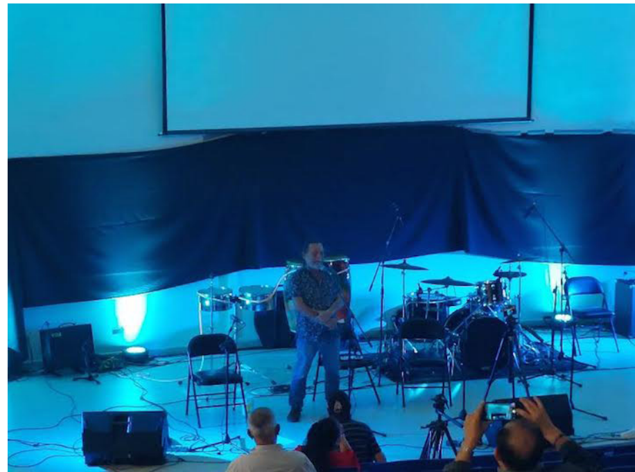
Con un acto cultural se conmemora la histórica y fatídica fecha del 30 de Julio, y cierran las actividades conmemorativas en este mes.