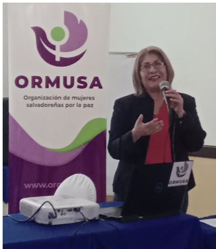
La Organización de Mujeres Salvadoreñas por la Paz (ORMUSA), a través del Observatorio Género y Justicia Ambiental, realizan el conversatorio sobre el impacto de la contaminación ambiental de la industria en El Salvador.