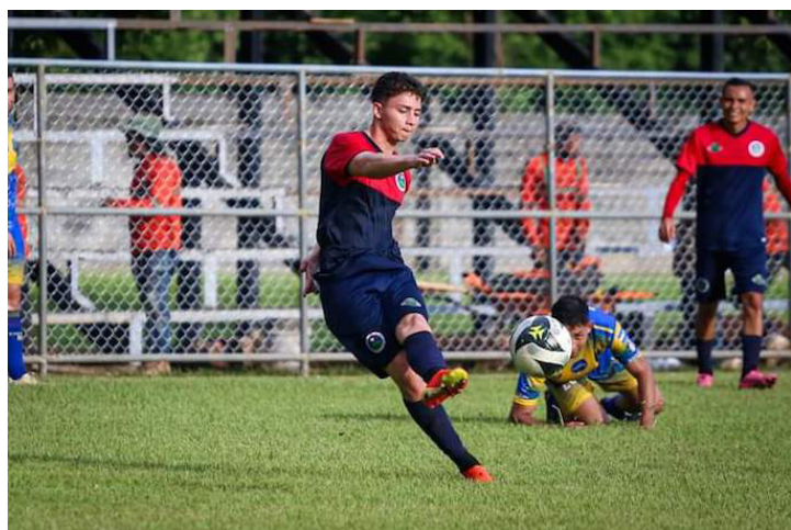
Cacahuatique debutará en Primera División contra Alianza en la jornada 2 del Apertura 2024.