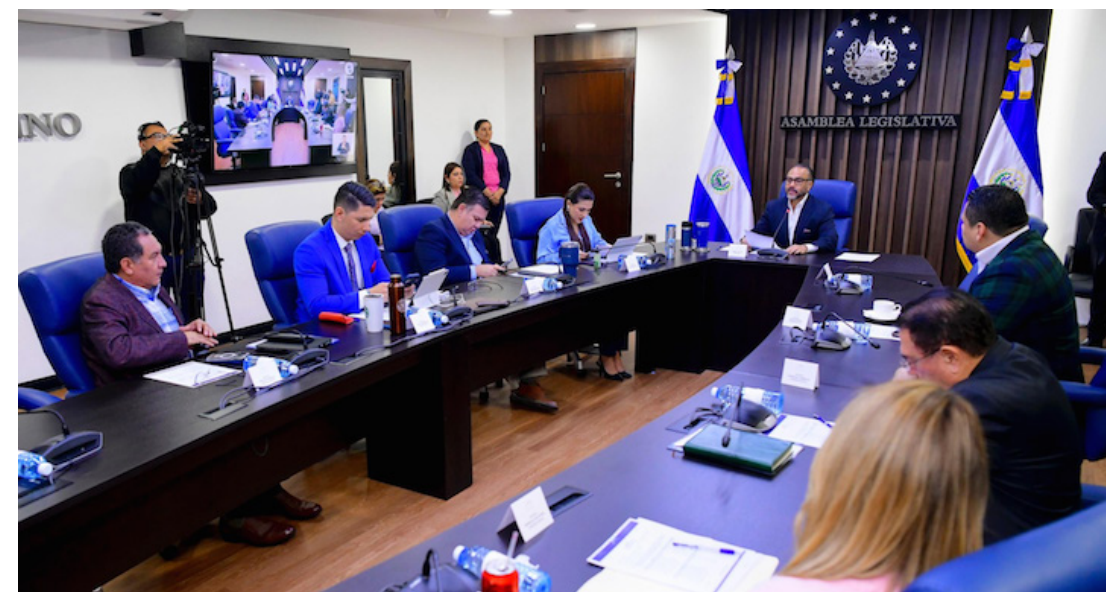
Comisión Política finaliza las entrevistas a magistrados; este miércoles en el pleno se decidirán a los 5 propietarios y 5 suplentes.