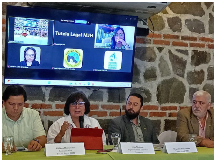
El Centro por la Justicia y el Derecho Internacional (CEJIL), la Pastoral de Movilidad Humana (PMH) de Guatemala, el Equipo de Reflexión, Investigación y Comunicación (ERIC SJ) Honduras y la Asociación de Derechos Humanos Tutela Legal “Dra. María Julia Hernández” de El Salvador, lanzan la campaña regional “Movilidad Humana con Derechos”.