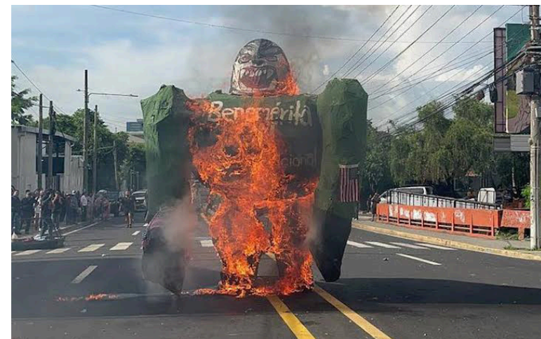
Colectivos estudiantiles prenden a un gorila como símbolo de protesta ante las violaciones a derechos humanos.

Estas acciones fueron realizadas con el objetivo de silenciar la voz del movimiento estudiantil organizado de la UES. Por ello, año con año los estudiantes marchan por toda la 25 avenida norte para pronunciarse sobre ese hecho y otros temas que afectan a la casa de es-