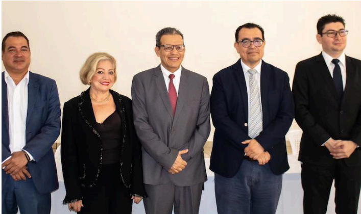
Como parte de la Semana del Economista, que se llevará a cabo del 12 al 16 de agosto, COLPROCE da a conocer los ganadores como economistas e investigador 2024.