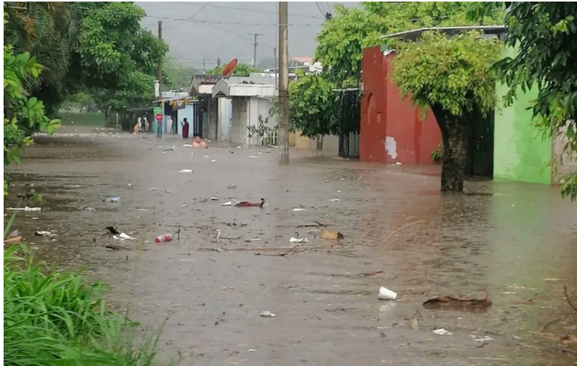
Las lluvias provocaron el desbordamiento del río Colón e inundó las calles de la urbanización Campos Verdes 2; y dañó el puente Veracruz, en Villa Lourdes, Colón La Libertad.

Estas condiciones estarán influenciadas por el flujo del este acelerado en la región del caribe, el cual, aporta humedad al territorio nacional, que, junto a una vaguada en capas bajas, generará