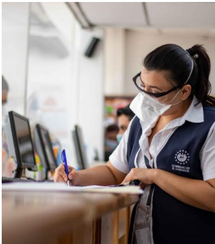
La ISPI será una entidad descentralizada con personalidad jurídica y patrimonio propio.

Otra atribución importante es la supervisión de las entidades de gestión colectiva. La ley establece que el ISPI debe “Supervisar, inspeccionar y controlar, de oficio o a solicitud de terceros, el funcionamiento de las Entidades de Gestión Colectiva a través del Instituto, que deberá velar por el adecuado reparto de lo recaudado, para lo cual contará con las facultades para solicitar, confirmar y analizar la información que requiera sobre la situación jurídica, contable, económica y administrativa de las Entidades de Gestión Colectiva de derechos de autor y derechos conexos, incluyendo la facultad de revisar la titularidad de los repertorios representados.”