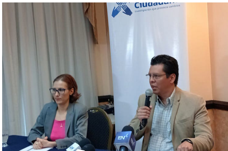
Acción Ciudadana, presenta el estudio de seguimiento del nivel de cumplimiento de funcionarios y exfuncionarios públicos para presentar su Declaración de Patrimonio, ante la sección de Probidad de la Corte Suprema de Justicia (CSJ).

“Y esto es -digamos- no sólo en algunas oficinas públicas, si no en todas las instituciones, y aquí llama la