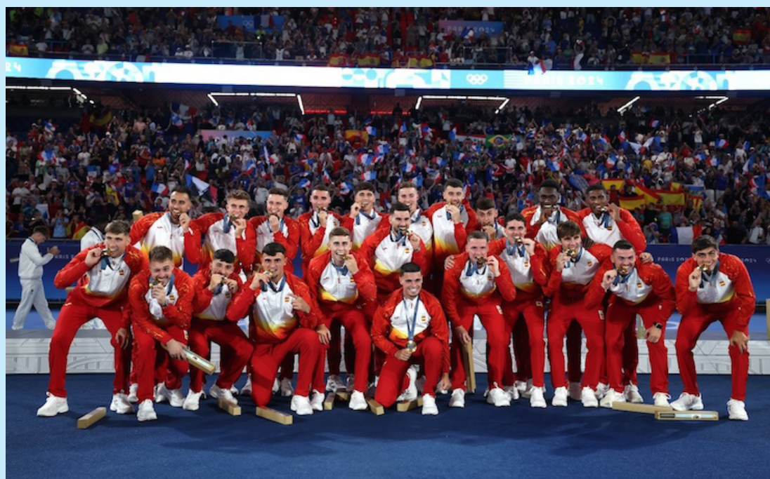
España gana medalla de oro en f tbol masculino en Par s 2024. Foto: Diario Co Latino/Cortes a.

Entre la medalla de los Juegos Ol mpicos masculinos, Espa a tambi n es campeona mundial en femenino, tiene la Eurocopa masculina, Liga de las Naciones masculina y femenina, el Mundial sub 20 femenino, la Eurocopa sub 19 masculina y femenina, el Mundial sub 17 femenino y la Eurocopa Sub 17 femenina.