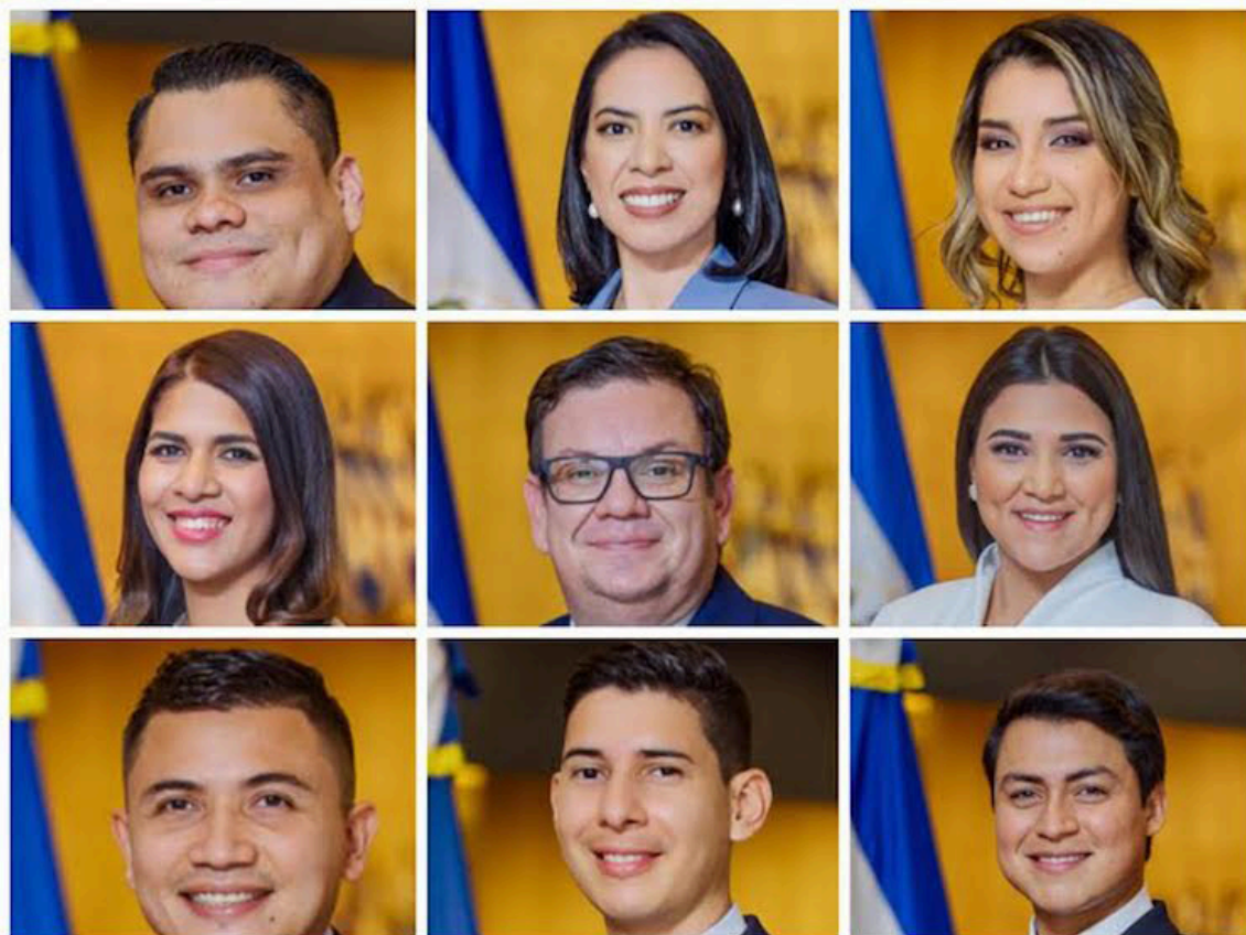
Diputados de Nuevas Ideas invierten una significativa cantidad de personal para mantener su imagen ante la opinión pública.

La colaboradora administrativa y el asistente de prensa del diputado Caleb Navarro devengan $2,925 y $2,875, respec-