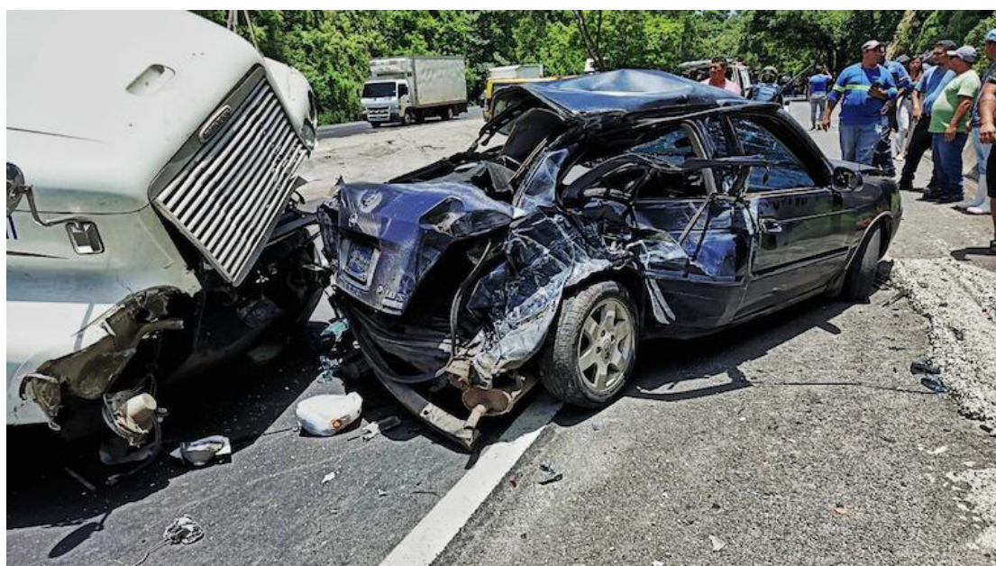
En las vacaciones agostinas se reportan 333 accidentes de tránsito, que dejaron 200 lesionados, 16 fallecidos.

“El conductor, en estado de ebriedad, manejaba un pick up y embistió por la parte de atrás al vehículo en el que se trans-