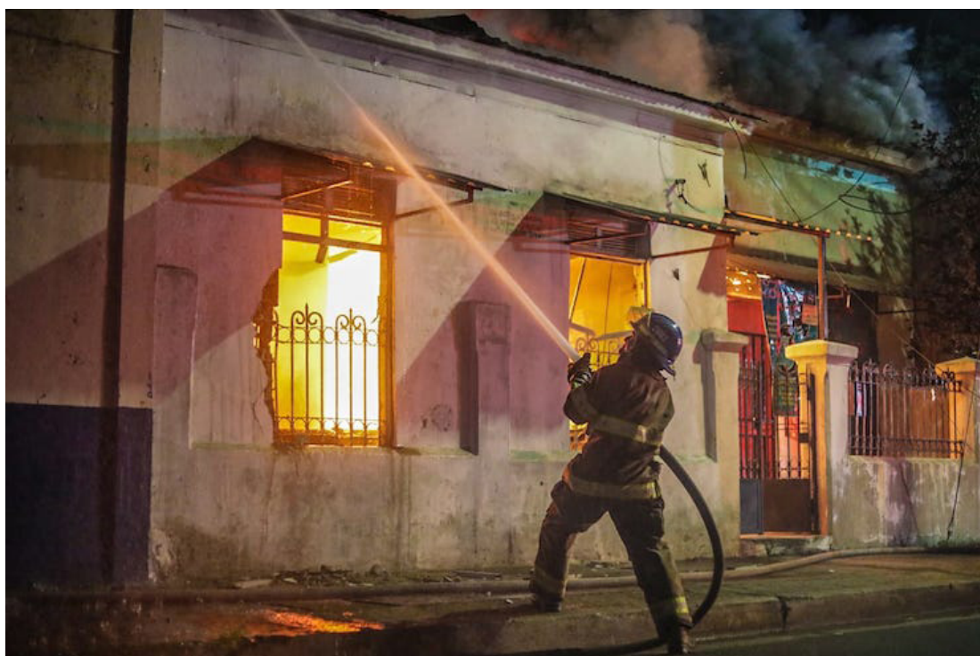
Del 1 al 6 de agosto ocurrieron 11 incendios estructurales, 10 en vehículos, uno en maleza seca y uno en basurero.

Los sitios públicos más visitados SívarLand, el Centro Histórico de San Salvador, la BINAES, el Complejo Turístico del Puerto de La Libertad y el Parque Natural Balboa.