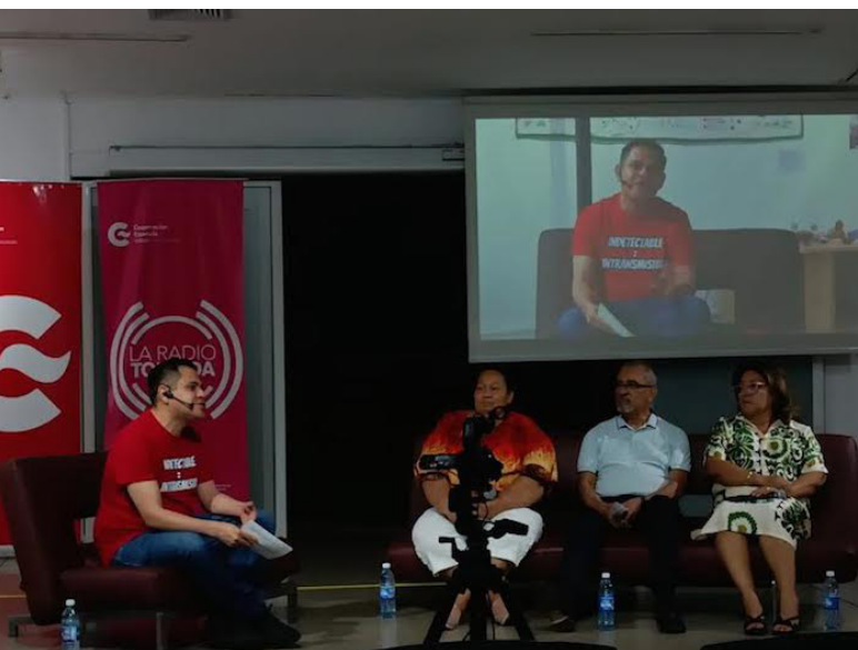
El programa “Punto y Seguido: Sueños Imparables” nace como resultado de un proceso creativo impulsado por el Centro Cultural de España en El Salvador, en colaboración con La Radio Tomada.