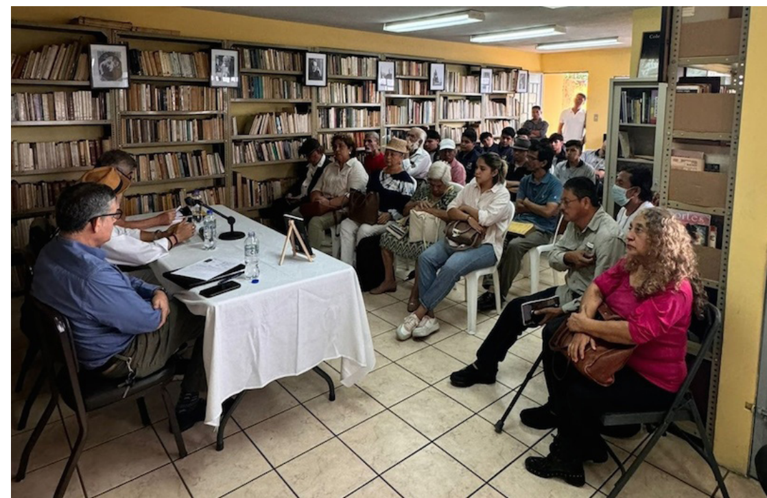
En la presentación del libro Recogiendo Cadáveres , del autor Miguel Ángel Chinchilla, en la biblioteca César Brañas, Guatemala, 6 de agosto 2024.

El título del libro es inspirado en la descripción que el propio Romero hacía de la más dolorosa de las tareas que le tocó ejercer. “Vivo recogiendo cadáveres”, decía el religioso a sus allegados, e incluso a la prensa. Entre las víctimas de la violencia