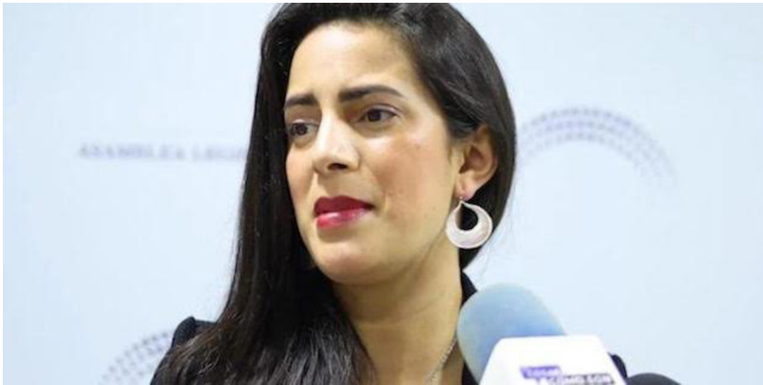
VAMOS reveló la cantidad de empleados y salarios que tendrá su fracción tras la asignación de $11 mil.