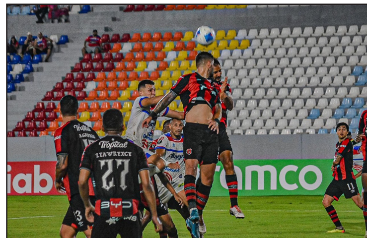
Firpo cae 3-4 ante La Liga Deportiva Alajuelense en "El Mágico", segundo compromiso de la Copa Centroamericana.

Styven Vásquez apareció nuevamente a los 58', y dejó a la afición con el grito en la boca, porque la joven promesa del equipo pampero estuvo a poco de marcar el empate. A los 66' Rashir Parkins