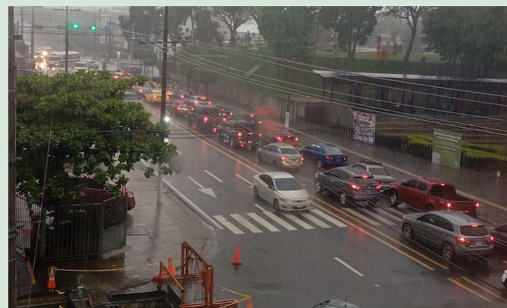
Protección Civil emite un aviso por lluvias debido a la influencia de una onda tropical.

lados de lluvias concentrados en la zona oriental, paracentral y sectores de costa; algunas extendiéndose hasta primeras horas de la madru-