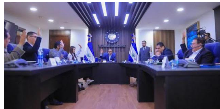
La Asamblea Legislativa elegirá a los nuevos magistrados del TSE para un período de 5 años.

La Asamblea Legislativa no eligió a los magistrados pese a contar con el dictamen favorable de la Comisión Política. Este regresó a estudio de comisión sin