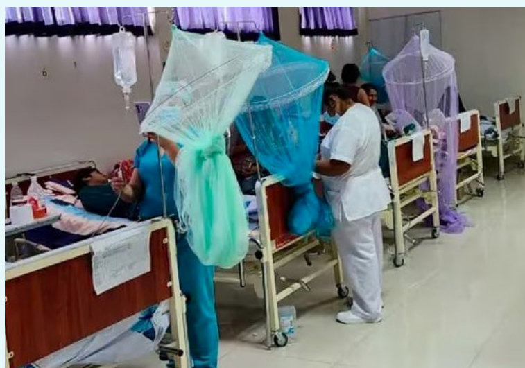
El Ministerio de Salud confirma la séptima muerte a causa del dengue, todos los fallecidos son menores de 12 años. Foto Diario Co Latino/imagen de referencia.

mente los cuatro serotipos del dengue circulan en el país, sin embargo, el DENV-3 es el que más circula, pero el serotipo dos tiene mayores letalidades; por ello, continúa la alerta epidemiológica emitida por el Ministerio de Sa-