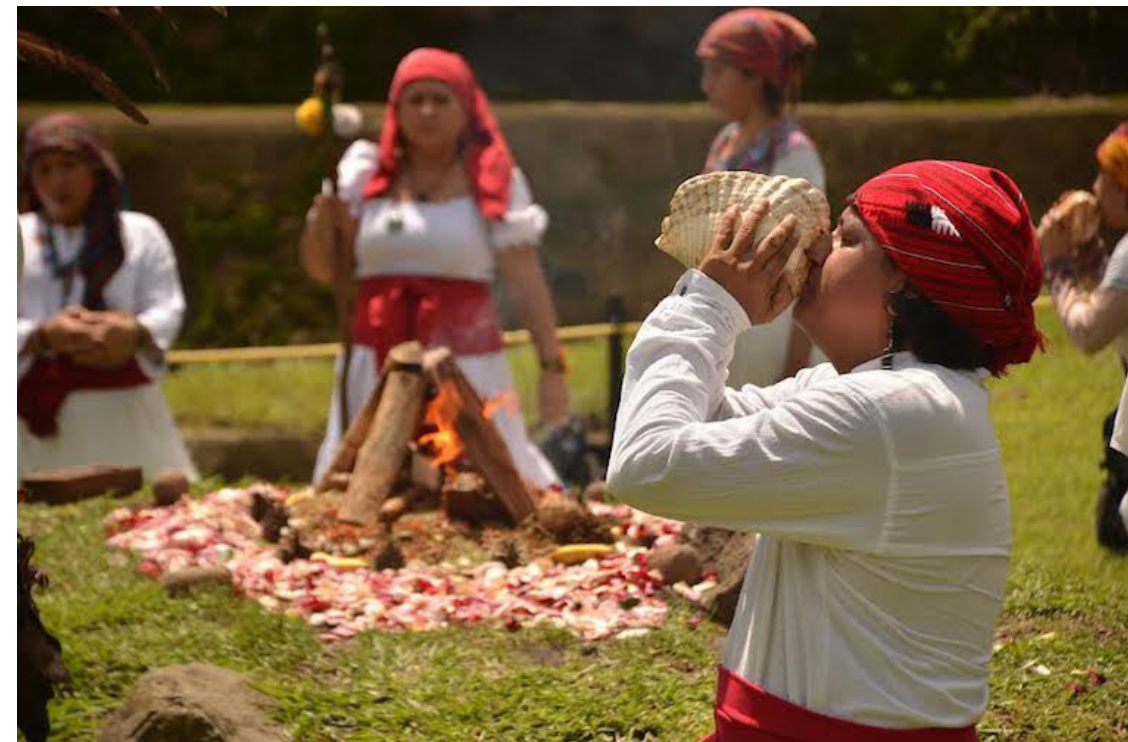
Iván Escobar Texto y fotos Colaborador

“Somos como una mazorca que cada día se encuentra grano por grano”, con estas palabras simbolizó el Tata Neto la unidad que se logra desde la cosmovisión indígena, durante la ceremonia de presentación ante el fuego sagrado de 18 aspirantes Ajq'ijab', quienes están siendo formados por el Círculo de Estudios Mayas de El Salvador.