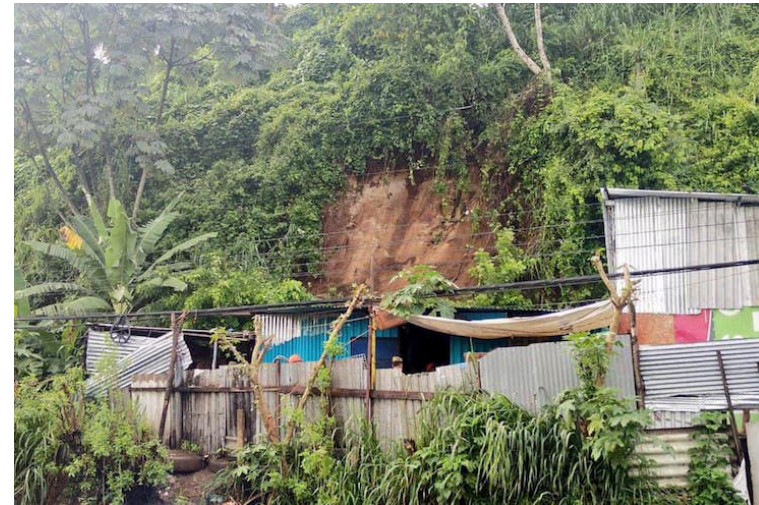
Tras el colapso de un paredón en una vivienda de la colonia Tazumal, Mejicanos, dos personas quedaron soterradas, una de ellas falleció.

La red de estaciones del MARN registró en las últimas horas precipitaciones de débil a moderada intensidad, principalmente en la zona central y oriental del país. El acumulado máximo registrado es de 95.4 milímetros en la esta-