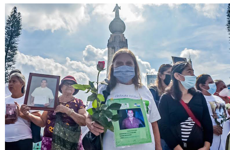
FESPAD, hace llamado a redoblar esfuerzos de investigación y a la atención de las familias que tienen un desaparecido. Así como la prevención de este tipo de hechos.

Carrillo consideró contradictorio que el gobierno está “apostando, en teoría”, a mejorar las condiciones de seguridad, y no se refuerce la Fiscalía para realizar las investigaciones de personas desaparecidas o asesinadas para lle-