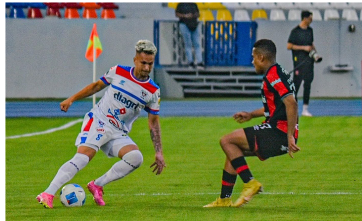
Firpo cae 3-4 ante Alajuelense en el segundo partido de la Copa Centroamericana de CONCACAF.

Los precios para el Águila vs Port Layola son general oriente $5.00, preferente sur $5.00 visitante y tribuna $15.00. El último encuentro internacional de esta semana se disputará entre Alianza Women vs Vancouver Whitecaps FC, este jueves 15 de agosto, a las 6:00 p.m. en el estadio Cuscatlán, recinto deportivo donde las actuales monarcas del fútbol femenino pelearán el