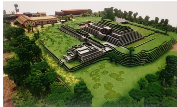
Es posible visitar el sitio arqueológico Tazumal en Minecraft Educativ, por lo que los Investigadores de la UTEC buscan sensibilizar sobre el patrimonio cultural de El Salvador.

Según comentaron los encargados del proyecto, Minecraft ha sido utilizado por distintas universidades para acercar a los jóvenes a un entorno educativo virtual de manera más accesible, ya que el vi-