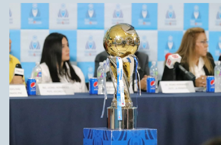
Copa del torneo Clausura 2024.

"Es una situación que se ha dado en cuanto a las bases de competencia, cuando se enviaron, por x razón desconozco porque hasta y des-