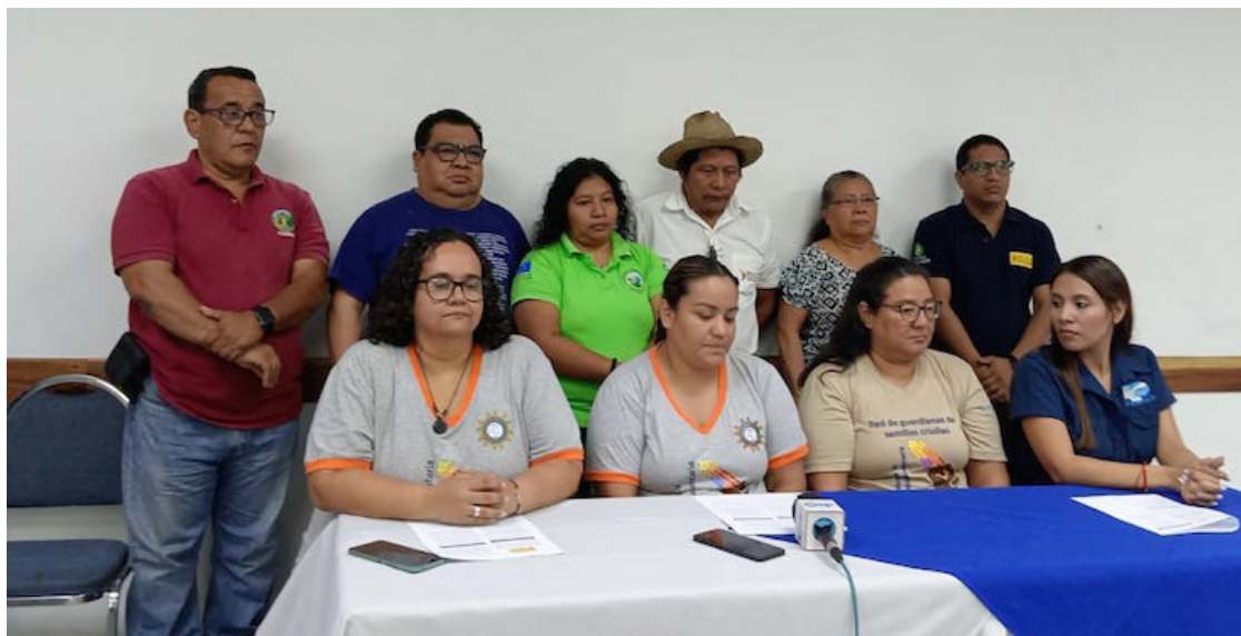
La Mesa por la Soberanía Alimentaria, (MpSA), y sus redes a nivel nacional exige al gobierno del presidente Nayib Bukele, crear la “Reserva Nacional de Alimentos”, para garantizar la Seguridad Alimentaria de la población.

En este país se sigue priorizando las importaciones de alimentos sobre la producción local; esto se ha pro-