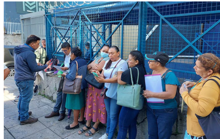
Tutela Legal ha presentado 7,000 demandas de habeas corpus, pero menos de un 5% han sido resueltos de manera favorable.

meses, un año de entregar ese documento y no tienen respuesta. Aunque sabemos que la respuesta va a ser “no hay lugar” o “es improcedente”, porque sabemos que la sala está recibiendo órdenes de