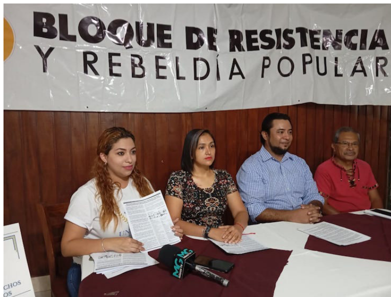
El BRP señala que permanecer en prisión es una amenaza a la vida de los líderes de la Alianza Nacional El Salvador en Paz, porque el estado de salud es delicado.

dad física de estos presos políticos es responsabilidad del gobierno, si el director general de Centros Penales y otros representantes del gobierno continúan irrespetando derechos e incumpliendo de sus obligaciones bajo tratados internacionales y resoluciones judiciales, estarán cometiendo crímenes de lesa humanidad”, aseguró.