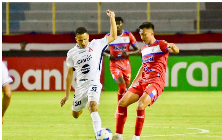
Alianza golea 5-2 a Firpo en el partido de la Copa Centroamericana de CONCACAF.