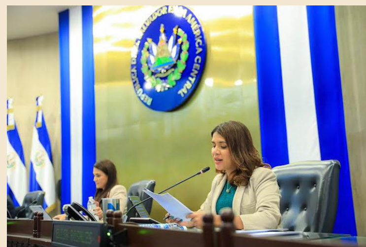
Diputados autorizan la donación de inmuebles para FONAVIPO para proyectos habitacionales.

verde para que se transfiera a favor del Fondo Nacional de Vivienda Popular (FONAVIPO) un inmueble ubicado en Las Joyas de Apazonte, de la finca Gran Bretaña, en el distrito de San Martín, en San Salvador Este, para su inscripción y posterior transferencia a pobladores e instituciones de utilidad pública que conforman la comunidad 1° de junio. Con ello se pretende beneficiar a 165 familias que llevan habitando en la zona por 10 años de manera ininterrumpida. De esta manera, podrán legalizar su situación y acceder a crédi-