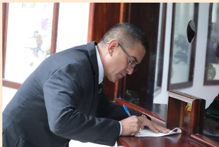
La iniciativa tendrá por objeto proteger los intereses económicos así como los derechos de propiedad de los usuarios de estacionamientos, de cualquier establecimiento destinado al uso público, sea de naturaleza privada o pública.

“Resulta de que nosotros tenemos varios centros comerciales en el país, uno va a gastar y resulta que le dan únicamente 15 minutos (gratis) a los usuarios para poder estar dentro