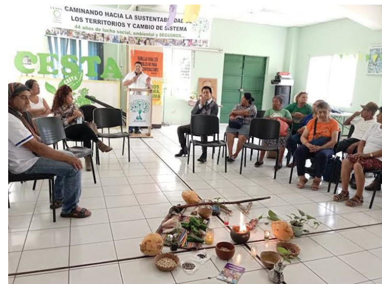
El CESTA también desarrolla una feria de emprendedores, quienes llevaron productos y alimentos naturales, libres de químicos.

“En CESTA somos guerreros que luchamos contra los diferentes problemas, contaminación y cambio climático que se manifiesta de diferentes formas”