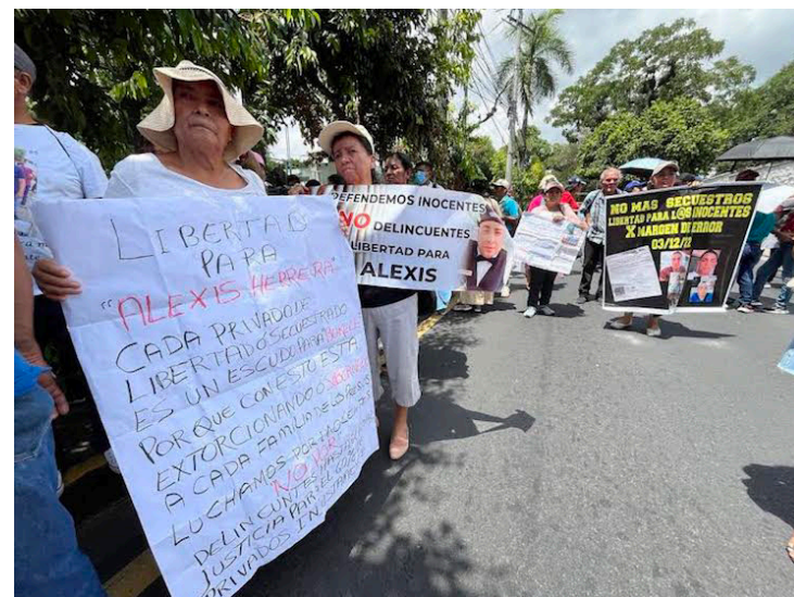
Piden la liberación de sus detenidos injustamente tras más de 2 años de ser separados de sus familias.

de estos papeles para que ellos sean liberados (los inocentes detenidos)”, comentó otra de las tantas madres que marchó este viernes en las calles de San Salvador.