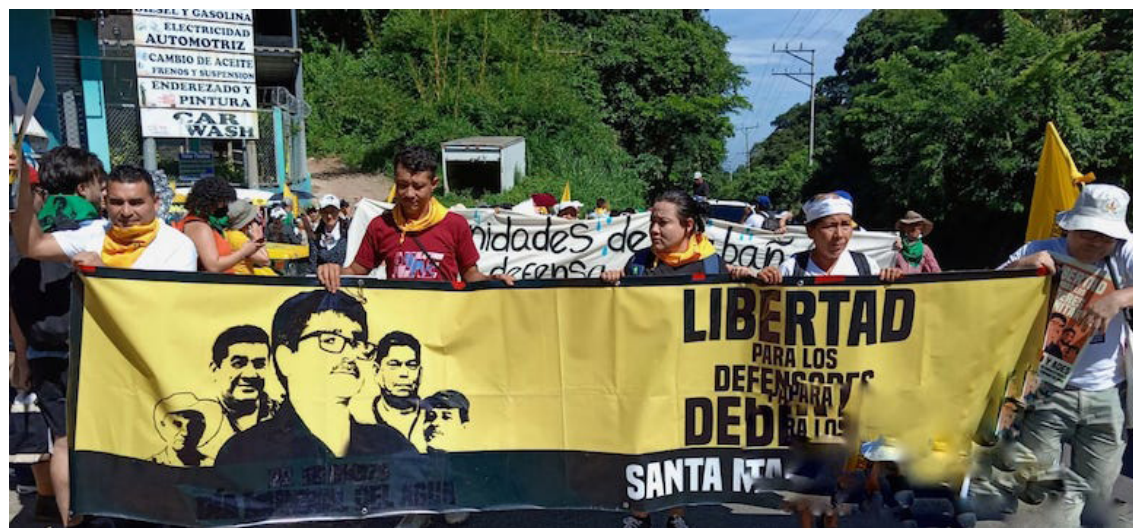
Los cinco ambientalistas de Santa Marta, fueron capturados con la intención no “sólo de eliminar opositores políticos, sino allanar el camino a empresas que puedan venir a explotar los minerales del suelo salvadoreño”.

“La captura de nuestros compañeros también, ha sido para meter terror a las comunidades y así contener la probable resistencia en los terri-