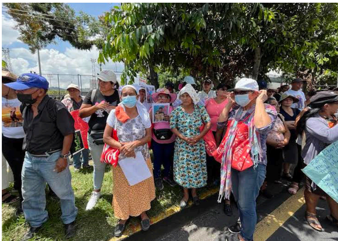
Familiares de inocentes detenidos se concentran en los alrededores de Casa Presidencial para exponer sus casos.