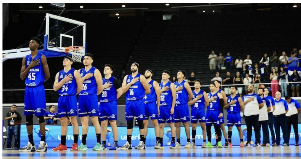
Selección nacional de baloncesto de El Salvador.

“Esperamos continuar mejorando para aspirar a estar en una posición en la que enfrentemos a combinados del Caribe, mientras eso llega seguiremos trabajando para mejorar