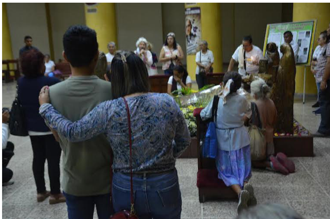
Los Feligreses ante el mausoleo a Mons. Romero, durante la celebración de este 15 de agosto.