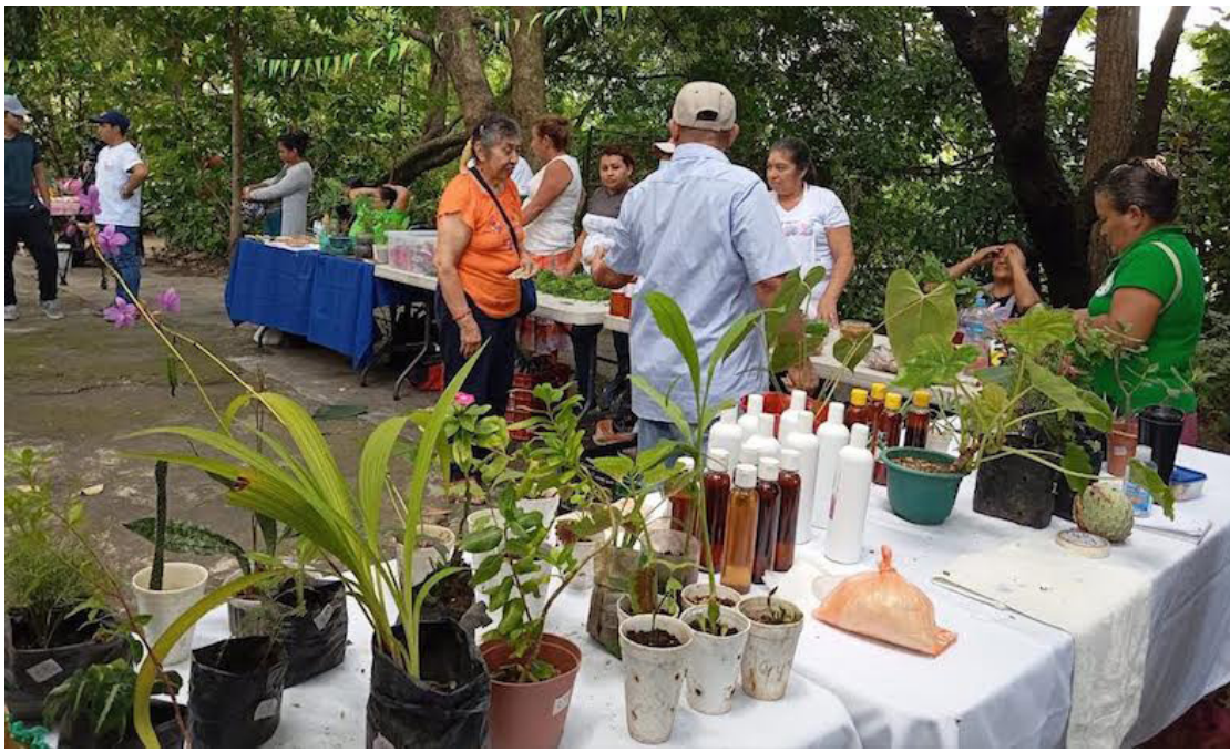
En el 44 aniversario de fundación, el CESTA desarrolla el conversatorio “Agroecología, la solución desde los pueblos frente a la crisis alimentaria”.