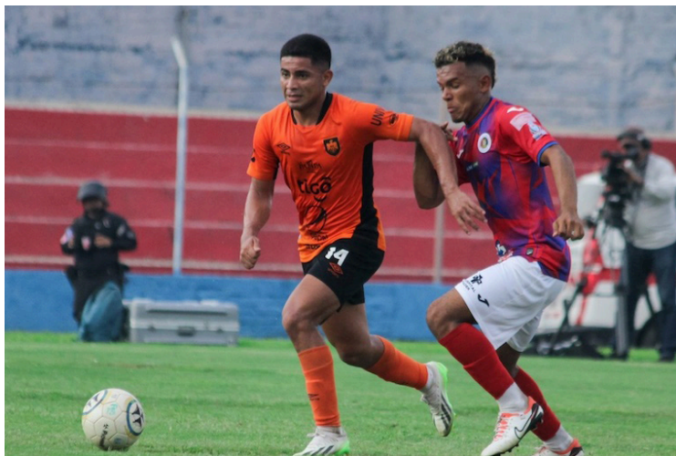
Águila y FAS en el torneo Clausura 2024 por la fecha 22 del campeonato.

El primer y único encuentro que se jugará el sábado será la visita de Platense a la casa de Isidro Metapán, en el estadio Jorge Suárez Landaverde, a las 7 de la noche. Esos dos equipos vienen de una derrota por lo que buscarán sumar de atrás en esta jornada para ir escalando en la tabla de posiciones. Los precios para este encuentro son