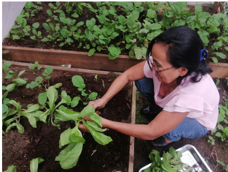
Colectivo MICELIO, promueve Huertos Urbanos para que la ciudadanía de forma colectiva o en sus hogares puedan cultivar y cosechar hortalizas como tomates, pepinos, rábanos y otros alimentos criollos o silvestres.

“Y no importa si vivimos en edificios porque en mace-