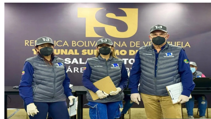
Todos los datos que revele este peritaje facilitarán a la Sala Electoral del TSJ emitir un veredicto final acerca del recurso contencioso presentado por el presidente reelecto, Nicolás Maduro Moros.

El Poder Electoral de Venezuela denunció que el siste-