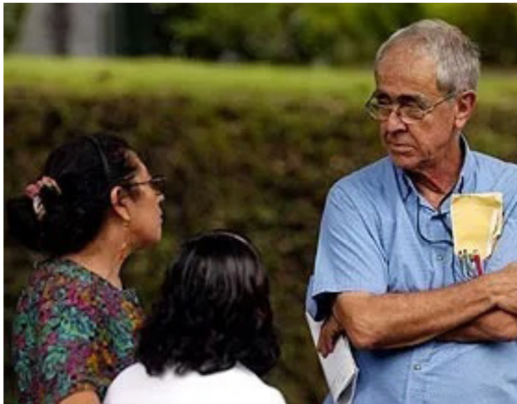
El Padre Jon Cortina dejó un legado en el país, con su generosidad, entrega y arduo trabajo junto a las madres que buscaban a sus hijos desaparecidos durante el conflicto armado.

Algunos han dicho que crecieron sabiendo que toda su familia había muerto y que se quedaron solos; a otros les dijeron que su familia los había regalado, vendido u abandonado, o