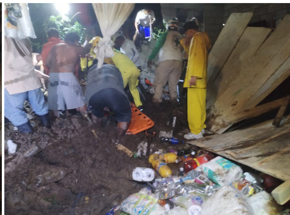
Cuerpos de socorro y Protección Civil informaron, sobre la muerte de 2 menores de edad, en horas de medianoche del viernes, tras el colapso y derrumbe de un muro de contención que cayó sobre su vivienda en el caserío Las Cañas, cantón San Nicolás, distrito de Apopa, San Salvador Oeste.