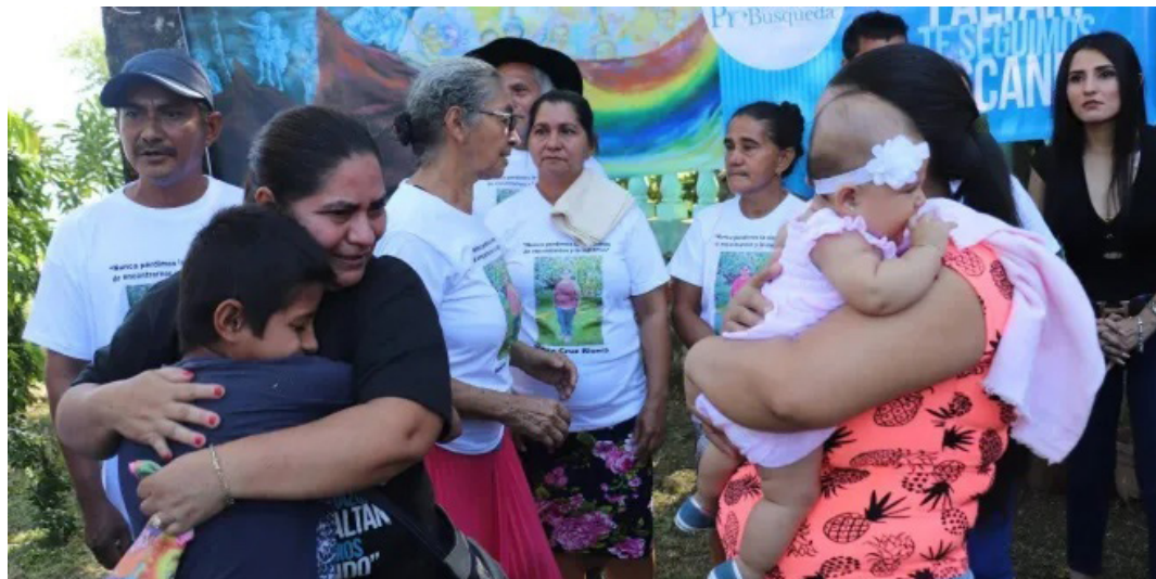
Probusqueda ha logrado resolver 469 casos, de los 1,046 casos recibidos, desde 1994.

Por las mismas condiciones del contexto de la guerra no se ha podido la recuperación de los restos de algunos, porque quedaron en la intemperie. Y otros que se lograron exhumar pudieron recuperarlos sus familiares, pero han sido muy pocos casos. El resto de los encontrados fallecidos ha sido a través de las declaraciones de testigo.