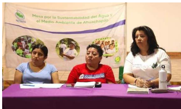
Organizaciones territoriales e instancias de gobierno, lanzaron la Mesa Ambiental, que abordará diversas temáticas ambientales de la Zona Sur de Ahuachapán, a fin de mitigar los impactos que viven las comunidades ante el cambio climático.

“Nosotros hemos expuesto problemáticas como la escasez