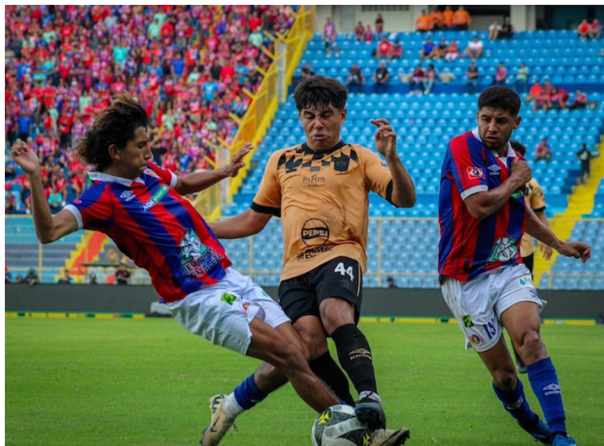
Águila vence 3-1 a FAS y se queda con el clásico nacional en la jornada 5 del Apertura 2024.