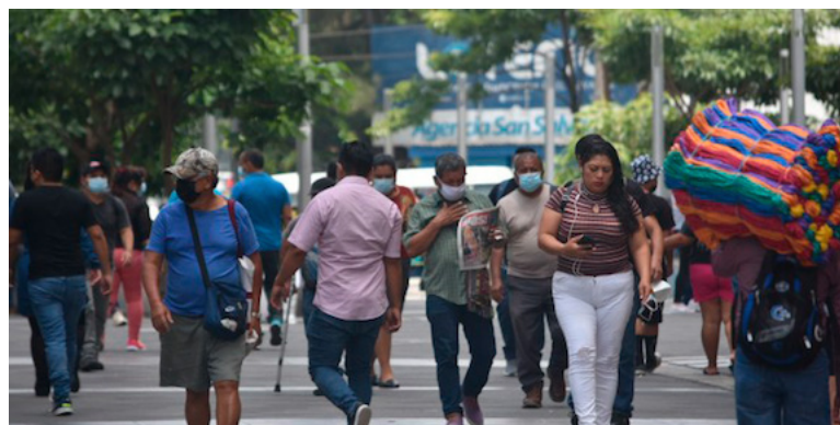
Nuevas Ideas se niega a solicitarle al Ejecutivo un informe sobre el salario mínimo.

El artículo 38, ordinal 2º de la Constitución de la República establece que todo trabajador tiene derecho a devengar un salario mínimo, que se fijará periódicamente. Además, que para fijar este salario se atenderá sobre todo al costo de la vida, a la índole de la labor, a los diferentes sistemas de remuneración, a las distintas zo-