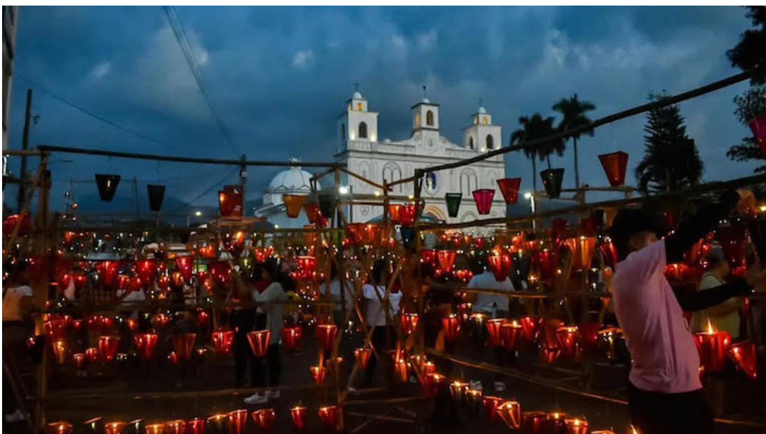
Cada 7 de septiembre se celebra el Día de los Farolitos, una tradición religiosa católica y originaria de Ahuachapán. Estos farolitos iluminan las calles del municipio de Ahuachapán y otros municipios vecinos.

La Fiscalía General de la República (FGR) acusó a Isaías en un proceso especial sumario ante el Juzgado Tercero de Paz de Santa Ana. El Juzgado habilitó la fase de investigación sumaria y dictó la medida cautelar de la detención provisional del acusado por el delito de hurto.