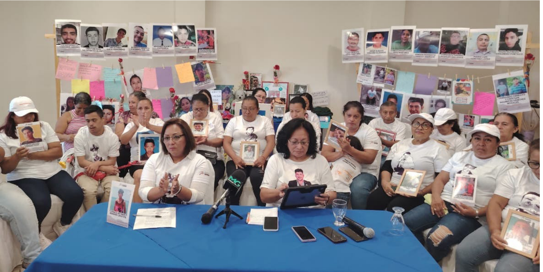
DESAPARECIDOS. EL BLOQUE DE BÚSQUEDA DE PERSONAS DESAPARECIDAS Y EL COMITÉ DE FAMILIARES DE DESAPARECIDOS (COFADES), CON EL APOYO DEL GRUPO DE TRABAJO POR LAS PERSONAS DESAPARECIDAS EN EL SALVADOR, PIDEN AL ESTADO QUE COLOQUE EL TEMA DE LA DESAPARICIÓN DE PERSONAS EN SU AGENDA POLÍTICA, ASÍ COMO ASIGNAR LOS RECURSOS.