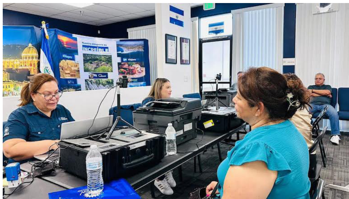
La nueva Ley del Registro del Estado Familiar tiene como objetivo primordial “regular la organización, estructura y cumplimiento de la función registral del estado familiar”, según lo estipulado.

cen definiciones clave para facilitar la correcta comprensión e interpretación de la ley. Entre las definiciones más relevantes se encuentran las siguientes: El “Asiento digital del Registro del Estado Familiar” hace referencia a los registros efectuados en soporte informático, los cuales incluirán la incorporación de la imagen sobre la información y la firma autógrafa digitalizada de la persona acreditada, quien garantizará la integridad y autenticidad de los registros realizados.