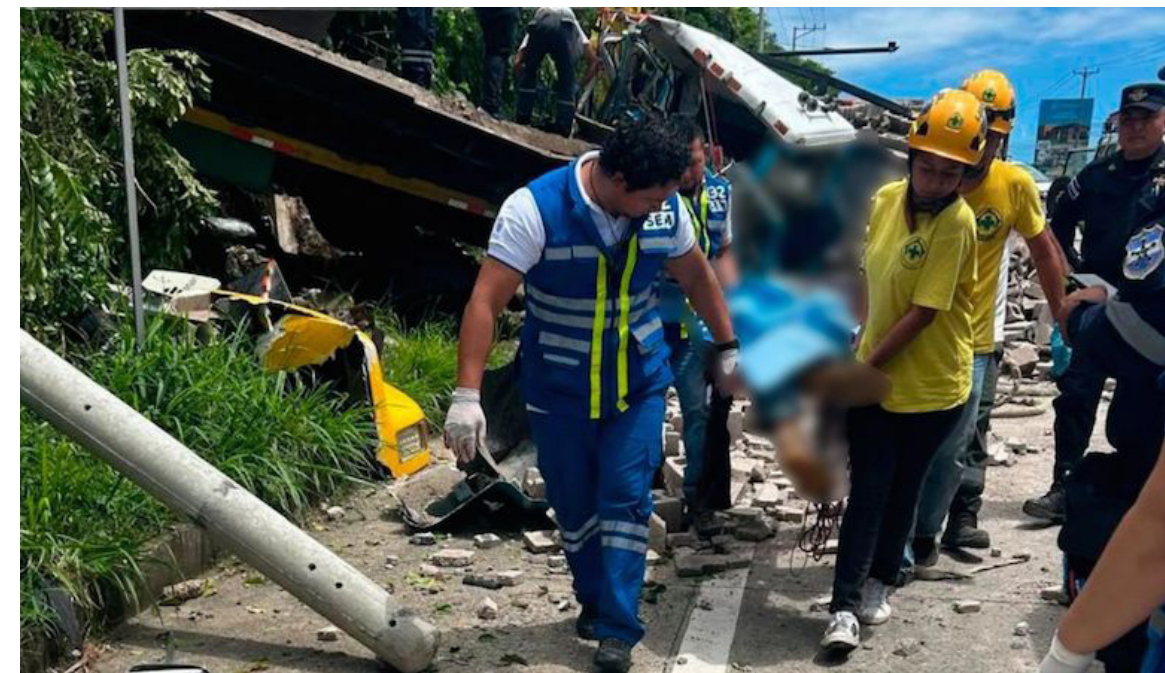
Este miércoles dos camiones se accidentaron, dejando dos personas fallecidas, según informaron los cuerpos de socorro que atendieron el percance en la carretera que conduce hacia el Puerto de La Libertad, donde hubo también dos lesionados.