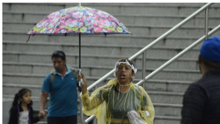
Para este sábado la influencia de una onda tropical, favorecerá las lluvias y tormentas sobre el país, el cielo estará de poco a medio nublado.

Durante la tarde, continuarán las lluvias y tormentas a lo largo de la cordillera volcánica, la zona norte y al nororiente, desplazándose al suroeste durante el final de