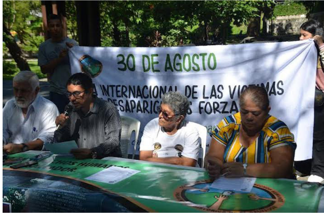
La Comisión de Trabajo en Derechos Humanos Pro-Memoria Histórica de El Salvador, señala que la desaparición forzada es considerada por el Derecho Internacional como una de las peores formas de violaciones a los derechos humanos.

“En la Unidad de Derechos Humanos o la Unidad para Delitos del Conflicto, hay una tardanza terrible y son capaces de exigirle a las víctimas que sean ellas, las que muestren pruebas.