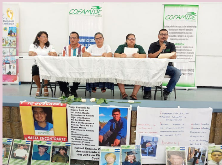
COFAMIDE señala que la desaparición forzada de personas continúa infligiendo sufrimiento, tanto a las víctimas directas como a sus familias.

Jaquín denunció que se presta poca atención al fenómeno migratorio, pese a que las cifras alcanzan niveles alarmantes y no se ve una