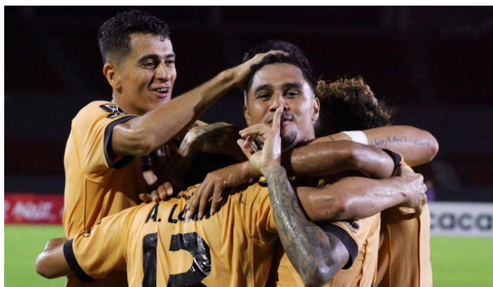
CD Águila, único equipo de El Salvador que está en cuartos de final de la Copa Centroamericana de CONCACAF.

Águila marcó un brillante debut en la primera fase de la Copa Centroamericana de CONCACAF, tras finalizar como líder del grupo de forma invicta de cara a los cuartos de final donde se enfrentará con el club nicaragüense Real Estelí este 25 de septiembre y 2 de octubre.