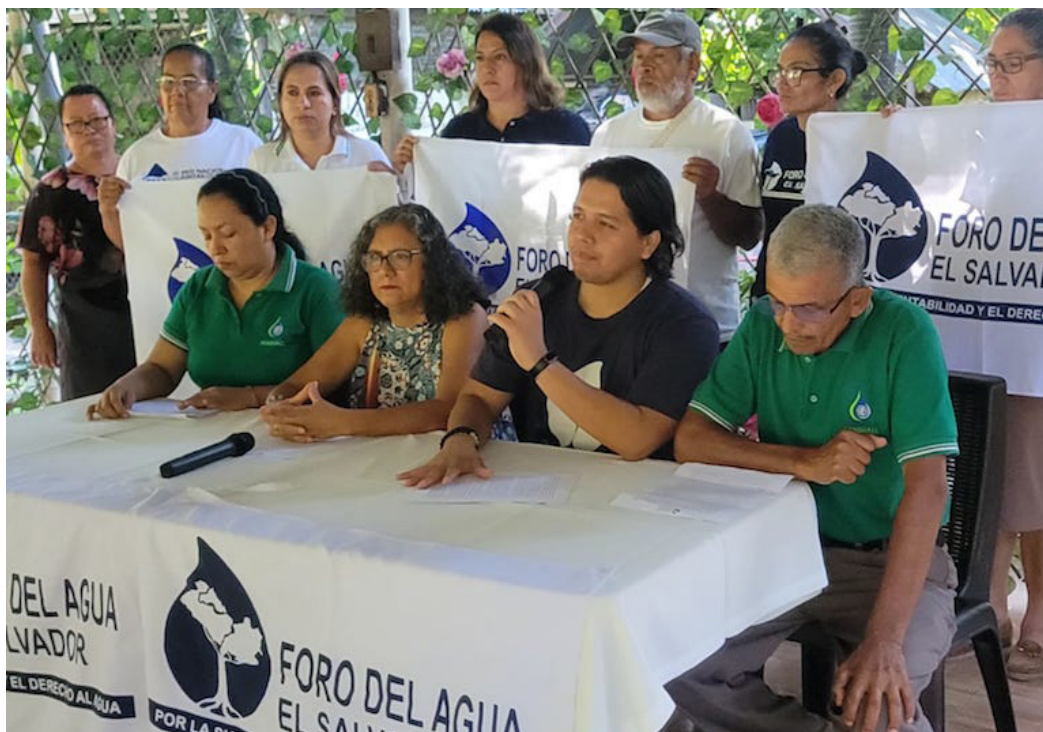
La Mesa Territorial del Foro del Agua de la Zona Norte de La Libertad, junto al Foro del Agua, lanzan proceso de consulta ciudadana con el objetivo de elaborar una ordenanza ambiental marco para dar protección al acuífero de San Juan Opico, en la zona Norte de La Libertad.

La decisión de elaborar esta propuesta comunitaria de una “ordenanza ambiental” surge ante la incertidumbre de la población frente al manejo del recurso hídrico, su extractivismo y la deforestación de la zona en que se sitúa el acuífero de San Juan Opico