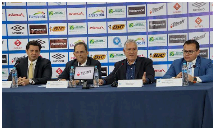
Nueva Comisión de Regularización es presentada en el FESFUT.

También comentó que el antiguo comité sufrió muchos cuestionamientos internos de los miembros del fútbol salvadoreño y de la ciudadanía, “porque son personas locales y están en la sociedad salvadoreña. Rolando es totalmente neutral, no le va a responder a ningún club en específico, a ninguno de los miembros de la federación, no participa en po-