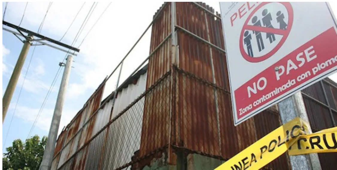
San Juan Opico es un lugar afectado por la contaminación, sumado a esto el daño ambiental permanente que emanan de los despojos con plomo de la exfábrica de Baterías Récord, que fue cerrada en el año 2007 por el Ministerio de Medio Ambiente y Recursos Naturales en Sitio del Niño.

“Para este proyecto, el Estado, a través de ANDA, se ha comprometido a garantizar un total de 260 litros de agua por segundo, los que serán extraídos de los 8 pozos a perforar en el acuífero de San Juan Opico, de la pequeña central de San Lorenzo, en San Matías, y de la Toma de Quezaltepeque, eso preocupa, y la deforestación de la zona. Por esto estamos aquí apoyando