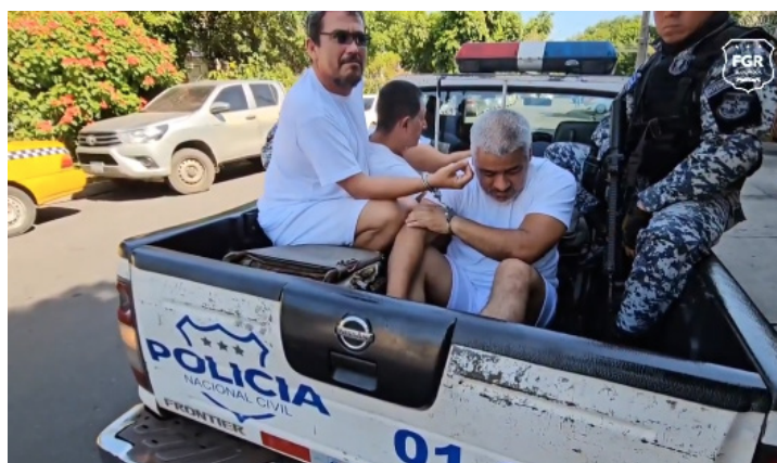
Momentos en que los imputados son llevados para la audiencia de Imposición de Medidas.

luego de que familiares de las víctimas interpusieran la denuncia por la desaparición de la pareja. Ambos estaban enterrados en el patio de su casa en la colonia Satélite de San Salvador.