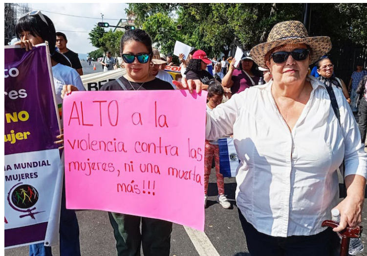
El Movimiento Salvadoreño de Mujeres (MSM) marcha este 15 de septiembre, pidiendo al gobierno el respeto a la vida de las mujeres y la eliminación de la violencia hacia este sector de la población.