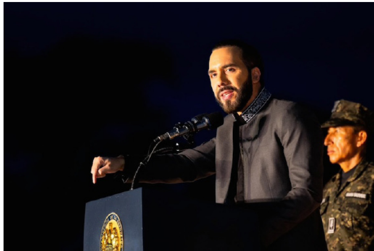
Nayib Bukele asegura presentar un proyecto de Presupuesto 2025 completamente financiado.

El anuncio fue hecho en las instalaciones del Centro Nacional de Tecnología Agropecuaria y Forestal (CENTA), en el distrito de Ciudad Arce, en el municipio de La Libertad Centro, frente a 18 mil efectivos milita-