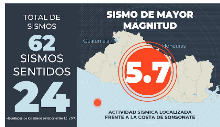
MARN reporta 62 sismos desde el viernes 13 de septiembre.

La última actividad sísmica sucedió a finales de agosto, luego de un sismo magnitud 6.1 la tarde del 28 de agosto. La Red Sísmica Nacional de El Salvador registró un total de 59 sismos de los cuales 18 fueron reportados como sentidos por la población. Las magnitudes de las réplicas oscilaron entre 2.6 y 4.8 en la esca-