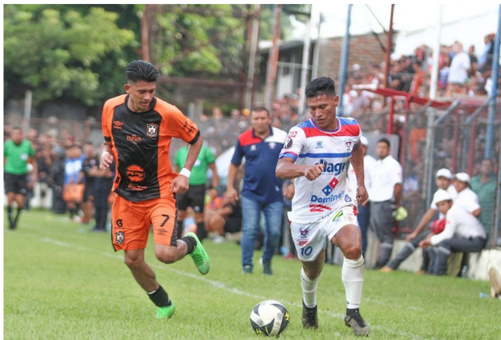
Águila pierde el invicto de manos de Firpo que corneó en Usulután.

Tras disputarse la jornada 10 del torneo Firpo finalizó con 19 unidades, y como escolta está Metapán con 18 y Águila con 17. Por debajo se encuentra Cacahuatique (16), Alianza (11), Limeño (11), FAS (10), Once (9), Fuerte (8), Platense (4) y Dragón (3).