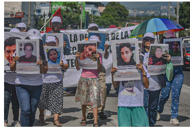
Familiares exigen al gobierno este 15 de septiembre, investigar los casos de personas desaparecidas, ya que las autoridades guardan silencio.

cuesta al país un millón de dólares al año, en salarios de lujo y otros privilegios, los legisladores oficialistas solo sirven para aprobar medidas “antipueblo” que les ordena su jefe desde Casa Presidencial.