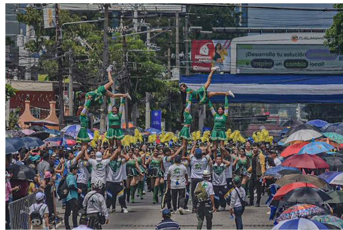
Estudiantes demuestran sus habilidades en el Desfile de Independencia organizado por el Gobierno.