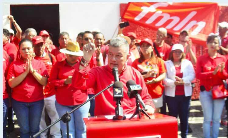
El FMLN indica que han trabajado por lograr una independencia con justicia social, sin embargo, actualmente hay un despilfarro de los recursos públicos y daño al bolsillo de los salvadoreños.

“Ese acontecimiento sólo significó la sustitución del yugo español por el de la explotación de una naciente burguesía, sigue sin beneficiar al pueblo. Como FMLN hemos trabajado por lograr una independencia con justicia social, hoy por la carencia de políticas públicas a fa-