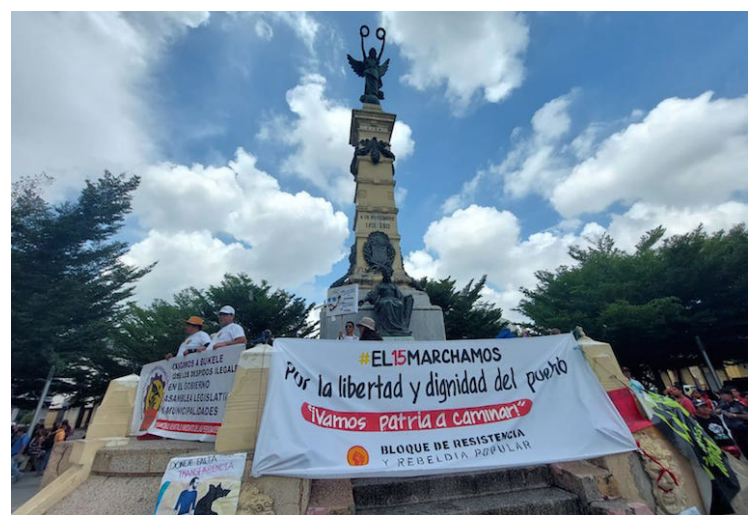
La marcha convocada por las organizaciones culminó en la Plaza Libertad, donde se denunció que durante el Régimen de Excepción miles de personas han sido injustamente capturadas, incluyendo a más 2 mil niños.

Asimismo, reiteró que durante el Régimen de Excepción miles de personas han sido injustamente capturadas, incluyendo a más 2 mil niños, la dictadura también reprime a personas que militan en algunos partidos y en organizaciones populares, muchas de las cuales han sido apresadas e incluso asesinadas.