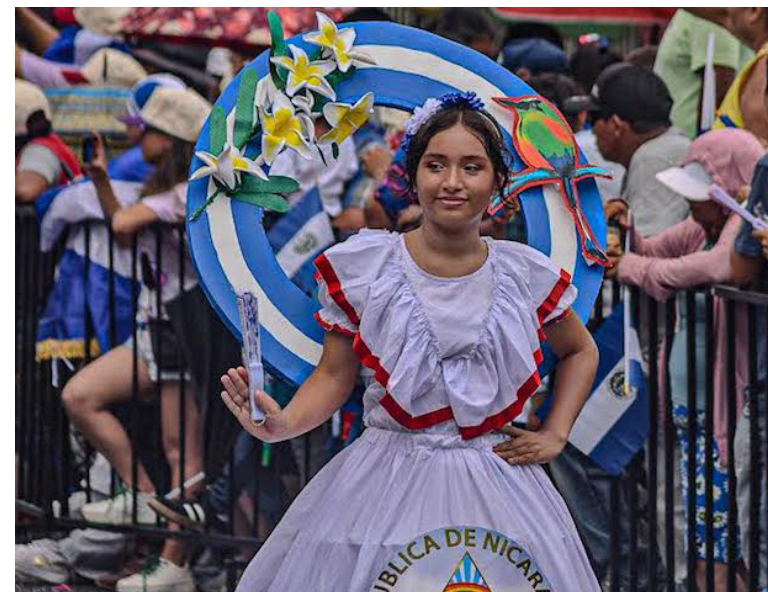
La cultura de otros países de centroamericanos también estuvo presente en el desfile de este domingo en San Salvador.

Este desfile organizado por el Gobierno de Bukele sucedió en simultáneo con la marcha que el movimiento social desarrolló desde el Parque Cuscatlán hasta la histórica plaza Libertad, denunciando las violaciones a derechos humanos (ver nota aparte).