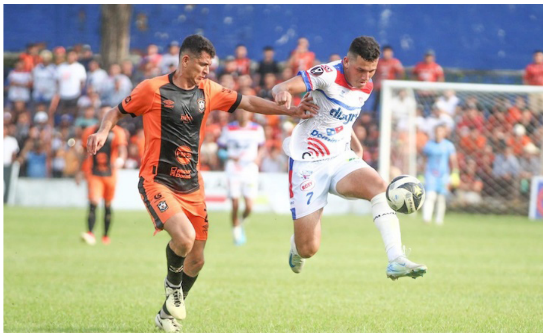
Firpo vence a Águila en la “Caldera del diablo” y se queda con el liderato tras la fecha 10 del Apertura.

En los primeros 10 minutos del segundo tiempo, Águila tuvo dos oportunidades clarísimas donde primero el balón se fue desviado fuera del arco y en la segunda ocasión el travesaño fue