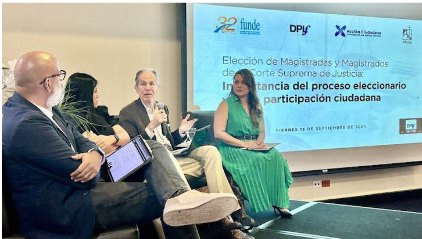
Durante el Conversatorio sobre la importancia del proceso de elección de magistrados a la CSJ, organizado por la Fundación Nacional para el Desarrollo (FUNDE), Acción Ciudadana, el IDHUCA y DPLF, las cuales promueven la transparencia en la función pública.