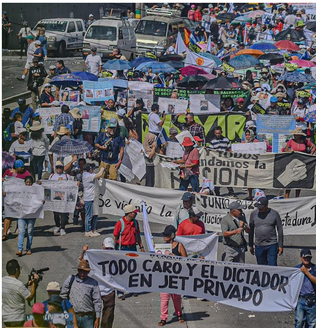
El 15 de septiembre el pueblo salvadoreño se tomó las calles de una forma pacífica denunciando la grave violación a derechos humanos.

Externó que desde hace 3 años el BRP ha venido denunciando esta grave situación, las violaciones a derechos humanos han sido permanentes, en el primer período presidencial y este que está iniciando el cuál es inconstitucional, el gobierno ha mantenido a la población bajo un Régimen de Excepción que violenta los derechos de la mayoría de las personas, gene-