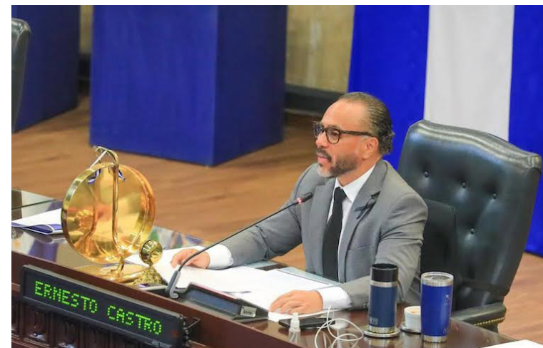
El dictamen de la Comisión Política puede ser discutido este martes en la sesión plenaria.

de entrevista a los 30 profesionales del Derecho, la dinámica de trabajo es que les corresponde a los 60 diputados de la Asamblea Legislativa los que deberán hacer la elección de los funcionarios de una manera transparente y participativa”, comentó el presidente de la Asamblea, Ernesto Castro.