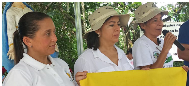
Las organizaciones ambientales piden la libertad inmediata y definitiva para los líderes comunitarios de Santa Marta y ADES, quienes han sido referentes de la lucha anti minera en el departamento de Cabañas.

En 2005 las comunidades de Chalatenango celebraron la retirada de la empresa Au Martinique del territorio con la primera peregrinación hacia el cerro Los Urbina, para construir el al-