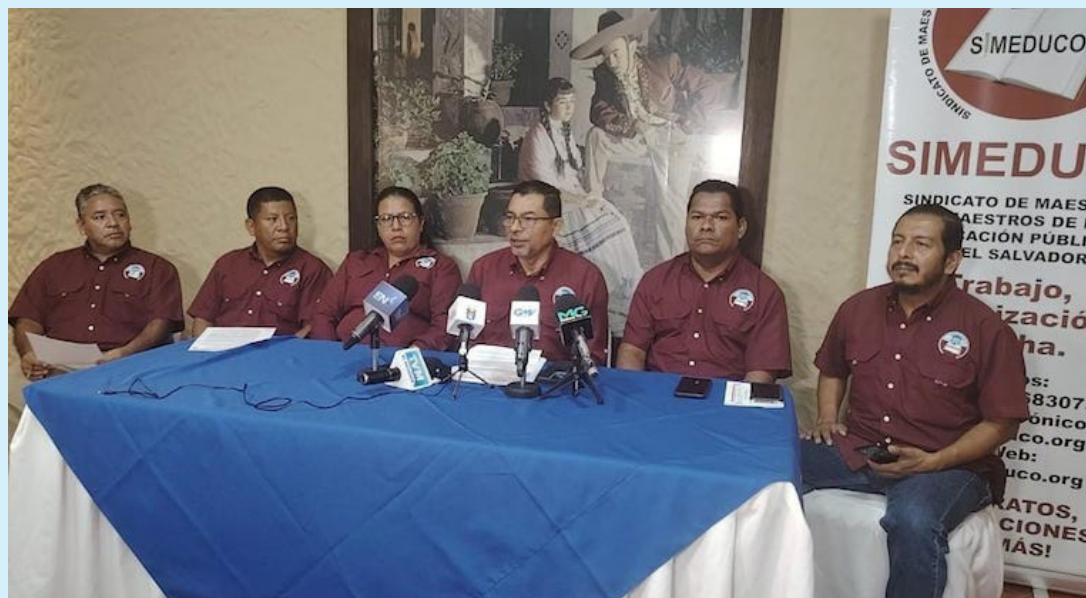
Directivo de SIMEDUCO indican que los salarios de los educadores se han congelado desde el año 2020, afectando a 43,449 docentes.