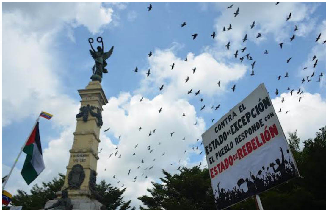
Organizaciones de derechos humanos nacionales e internacionales, así como organizaciones de víctimas, exigen el cumplimiento de las recomendaciones emitidas por la Comisión Interamericana de Derechos Humanos al Estado de El Salvador.

“No es posible que el estado de excepción se siga justificando, porque ha quedado muy claro en el informe que el estado de excepción no es proporcional a las causas que lo originaron y ya no están