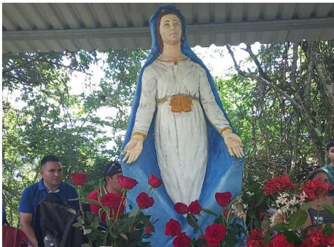
Las comunidades de Chalatenango conmemoran en el cerro Los Urbina, municipio San José las Flores, donde está el altar a la Virgen de la Resistencia, la primera victoria sobre las empresas mineras en El Salvador.