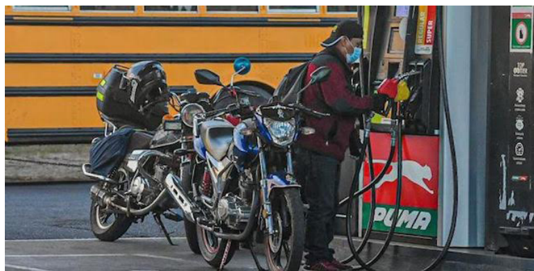
Los conductores sentirán un alivio a partir de este martes ya que se reducirán hasta $0.28.

regular, tendrá una disminución de $0.20 en la zona occidental y oriental, por lo que costará $3.75 y $3.79, respectivamen-