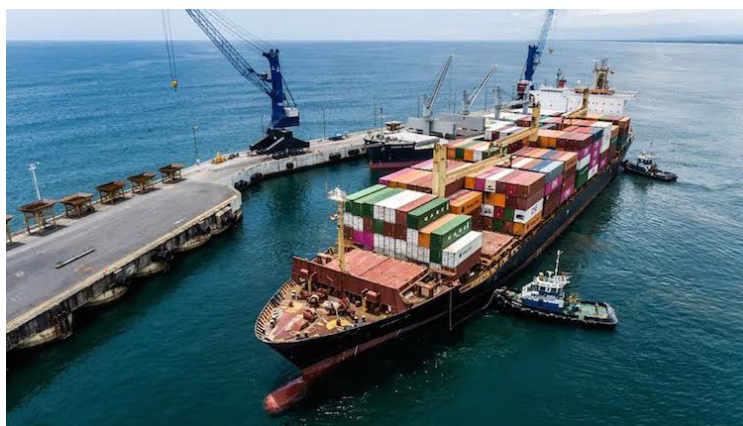
El 2022 presentó los déficits comerciales más elevados del período analizado. El déficit más alto se registró en junio con $896.83 millones, y el promedio mensual fue de $824.48 millones.

En 2023, el déficit comercial se redujo. El déficit más alto fue en octubre con $830.94 millones, y el más bajo en febrero con $643.49 millones, con un promedio mensual de $761.19 millones. Las exportaciones máximas fueron en marzo con $683.74 millones, y las mínimas en diciembre con $449.11 millones, promediando $541.58 millones mensuales. Las importaciones alcanzaron su máximo en marzo con $1,412.08 millones y su mínimo en abril con $1,177.52 millones,