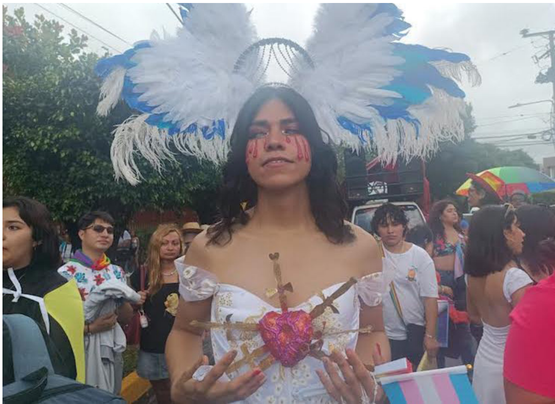
El aumento de homicidios de personas LGBT en El Salvador de 1 en 2022 a 6 en 2023 contrasta con la tendencia general de disminución de homicidios en el país, atribuida al denominado "modelo Bukele" y al estado de excepción vigente desde marzo de 2022.

Se registraron 31 casos de mujeres cis lesbianas, 24 de hombres cis bisexuales y 10 de hombres trans. Además, se reportaron 3 casos de mujeres cis bisexuales y 2 de personas no binarias. En 19 casos no se pudo determinar la orientación sexual o identidad de género específica de las víctimas. El informe detalla los métodos o armas empleados en los homicidios. Las armas de fuego fueron las más utilizadas, con 142 casos. Los objetos cortantes o punzantes se usaron en 46 casos, mientras que el ahorcamiento, estrangulamiento o sofocación se empleó en 20 ocasiones. La fuerza corporal fue el mé-