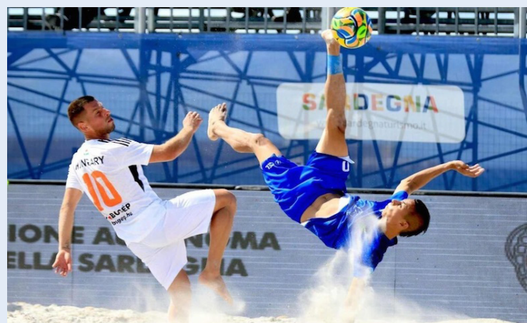
Barra de Santiago vence al Bonyhad 4-3 en la segunda jornada de la Beach Soccer World Winners Cup 2024.