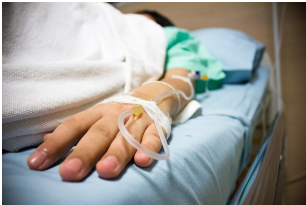
Una investigación de Voz Pública ha documentado que son 21 muertes por dengue, es decir, casi el triple de lo reportado por las autoridades de Salud.

“Cómo va a ser una infección viral no especificada cuando el paciente ingresó por dengue y se termina reportando como causa básica una miocarditis, o inflamación del músculo cardíaco, común en las infecciones por dengue”