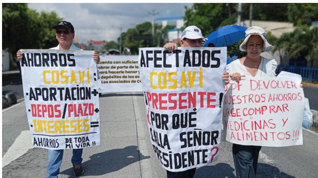
El vocero de los Afectados de COSAVI, afirma que la Superintendencia emplea un mecanismo insostenible para la devolución de los fondos de sus ahorrantes.

Las declaraciones de la funcionaria sobre la devolución de ahorros son