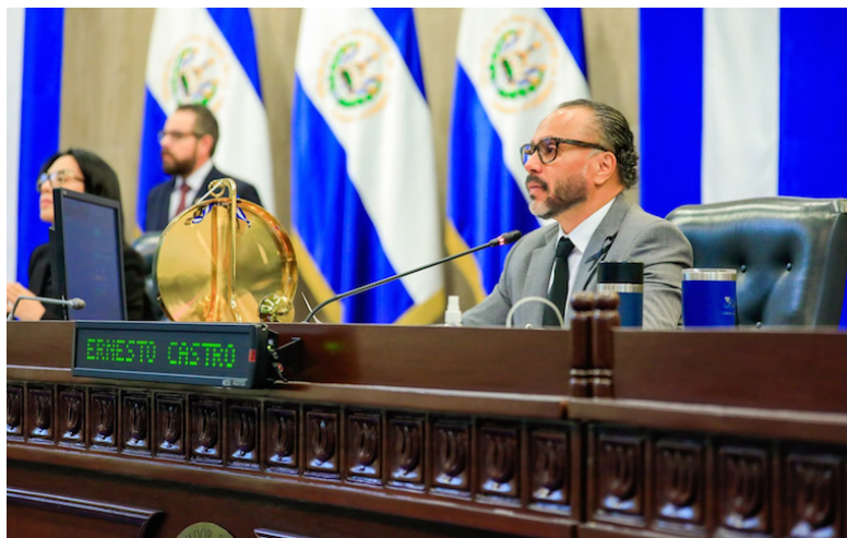
La Asamblea Legislativa elegirá a 5 magistrados propietarios y 5 suplentes para ejercer en el cargo hasta 2029.

VAMOS ha solicitado por segunda ocasión esta información a la Comisión Política; “tenemos derecho a acceder y hacer una evaluación que cumpla todos los parámetros.