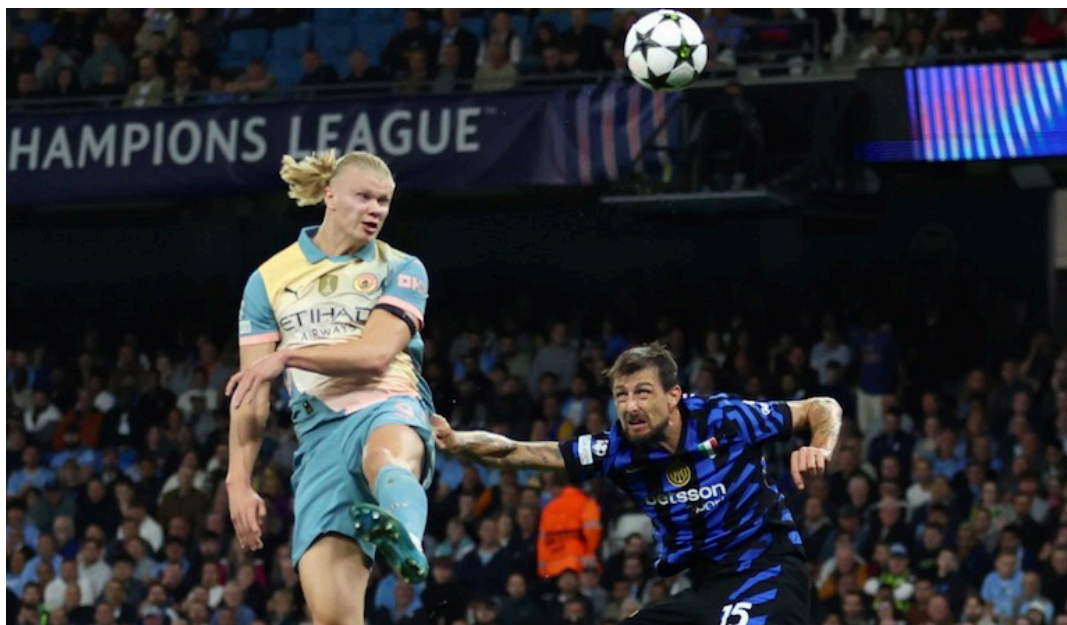
El Manchester City y el Inter de Milán reparten puntos en el debut de la Champions League.

Este jueves se cierra la primera jornada en el regreso del torneo más importante de Europa