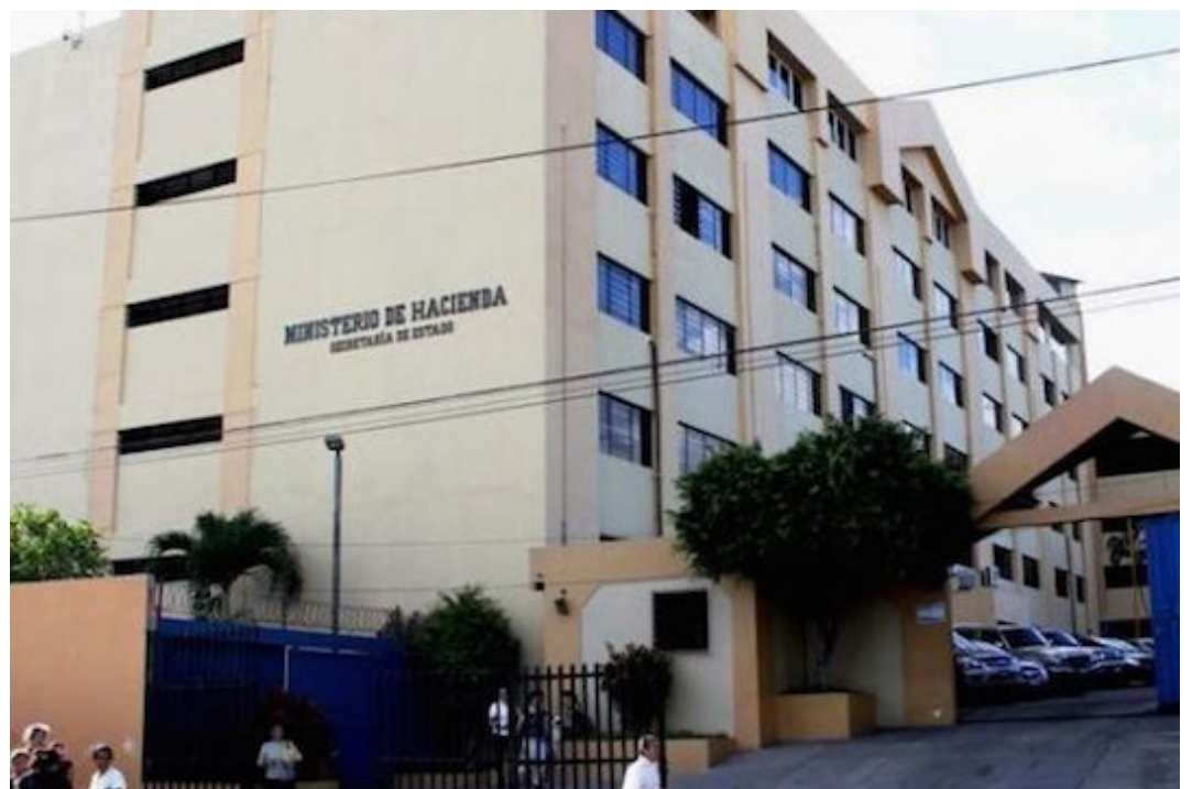
El gobierno a través del Ministerio de Hacienda, ha girado instrucciones que las plazas vacantes disponibles por cualquier fuente de financiamiento, deberán ser suprimidas en las instituciones públicas.

“La cifra preliminar comunicada ha sido definida con base a las perspectivas de crecimiento económico determinadas por el Banco Central de Reserva de El Salvador y el Ministerio de Hacienda, en el contexto del proceso de recuperación de la economía nacional, determinado por el dinamismo de la demanda interna, el impulso al turismo y el fortalecimiento de la seguridad pública”, indica la nota enviada a las instituciones