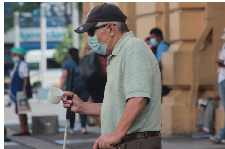
El 70% de la población adulta mayor no cuenta con una pensión ni con apoyo económico. Foto Diario Co Latino/YSUCA.