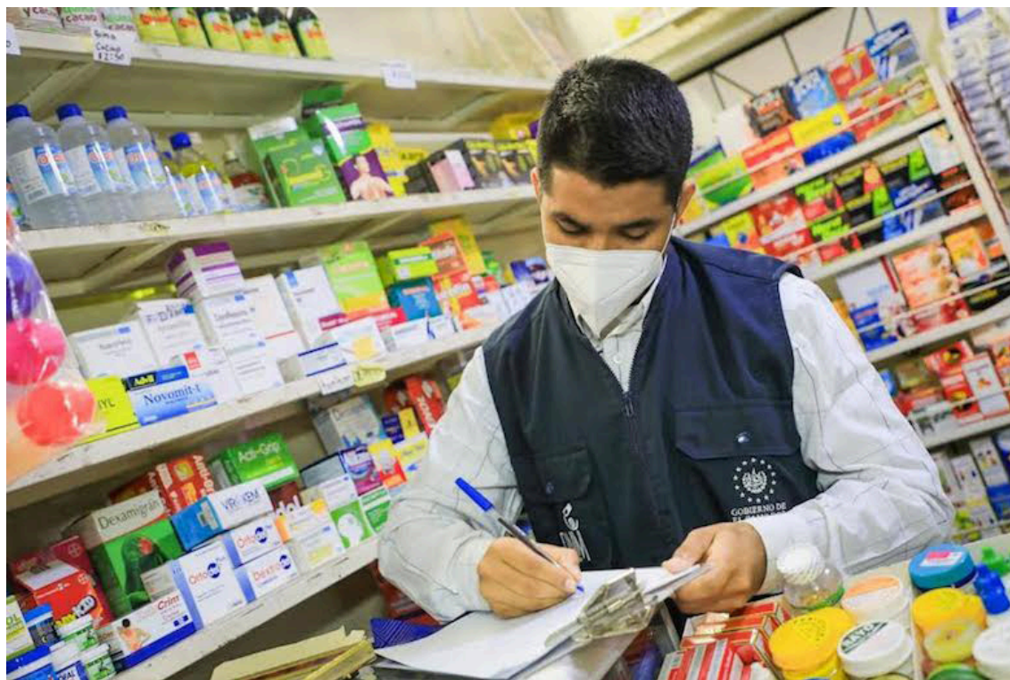
La SRS es "una institución autónoma de derecho público y con carácter técnico, con personalidad jurídica y patrimonio propio, con plena autonomía en el ejercicio de sus funciones".

Las atribuciones de la SRS, establecidas en el artículo 4, incluyen otorgar inscripciones, registros sanitarios, permisos de importa-