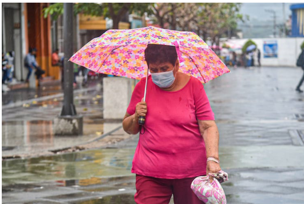
Para la próxima semana es posible el desarrollo de una baja presión sobre el noroeste del mar Caribe, que podría incrementar las lluvias en el país.

El Centro Nacional de Huracanes señaló que para la próxima semana es posible el desarrollo de una baja presión sobre el noroeste del mar Caribe, este sistema tiene una probabilidad media del 40% de convertirse en una depresión tropical, a medida que se mueve lentamente al norte o noroeste hacia el sur del golfo de México.