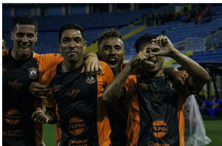
Águila en el partido ante Olimpia en el Cuscatlan, parte de la tercera fecha de la Copa Centroamericana de CONCACAF.

Águila buscará el pase a las semifinales en un torneo oficial