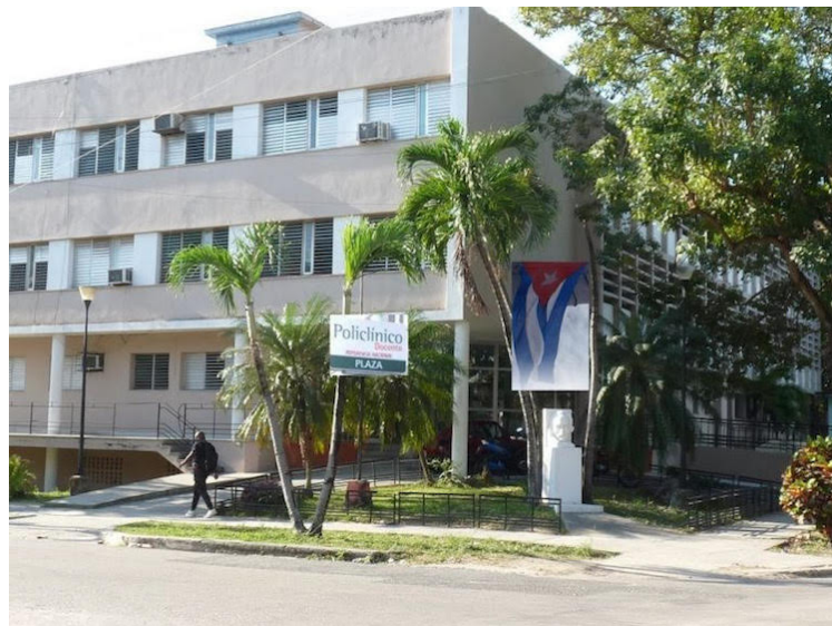
El sistema de salud cubano se ve afectado por el bloqueo económico impuesto por Estados Unidos.