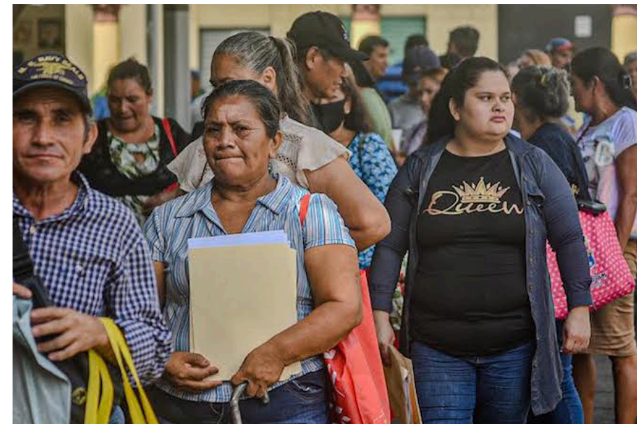
Decenas de personas asisten a la Plaza Libertad para ordenar los arraigos para sus detenidos en el régimen de excepción.

En la jornada de recolección de arraigos colaboraron el equipo de parte del equipo de Cristosal y Unidad de Defensa de Derechos Humanos y Comunitarios de El Salvador (UNIDECH). Trabajo que le corresponde a la Pro-