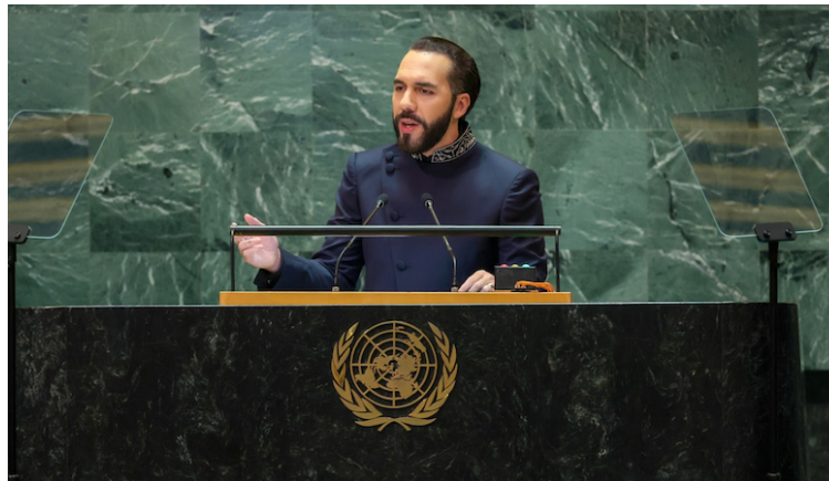
Nayib Bukele destaca que en El Salvador existe la libertad de expresión; este mismo martes, un agente de la PNC amenazó a una periodista por tomar fotografía en un acto público.

“Le dimos a miles de salvadoreños que huyeron de las guerras y de la pobreza, un país al cual regresar. Hicimos de nuestra nación, que fue una vez la capital mundial de los homicidios, el país más seguro del he-