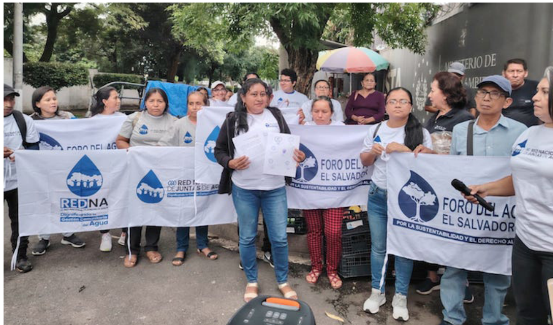
La Mesa Territorial de la Microcuenca La Joya Pueblo, la Mesa Territorial del Foro del Agua de Morazán, que conforman el Foro del Agua, entregan una “carta de oposición” ante el MARN, por un permiso ambiental en el cerro El Pericón.

Asimismo, el Ministerio de Medio Ambiente y Recursos Naturales, en la remisión de información al Tribunal Ambiental explicó que el “permiso ambiental” de ese proyecto había venci-