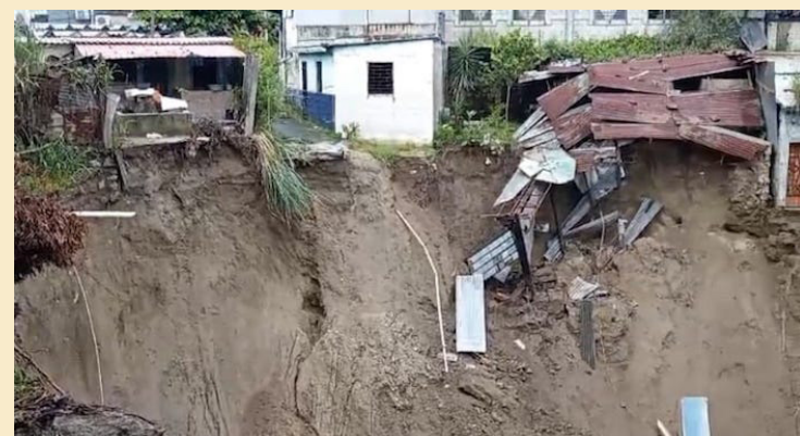
Una vivienda de la lotificación Los Vásquez II, reparto Los Santos II, Soyapango, colapsó debido a una cárcava que con las lluvias agravó la situación.

que las lluvias continúen en la costa y sectores de oriente. Estas lluvias tendrán características de temporal, principalmente en la costa.