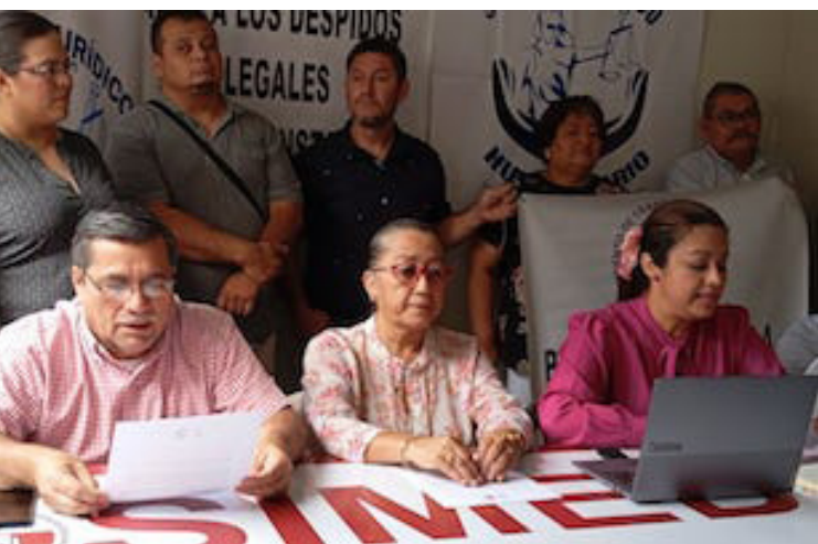
El MTD y Socorro Jurídico Humanitario enfatizan que el gobierno oculta los despidos como salarios onerosos de $41,000 a sus funcionarios.