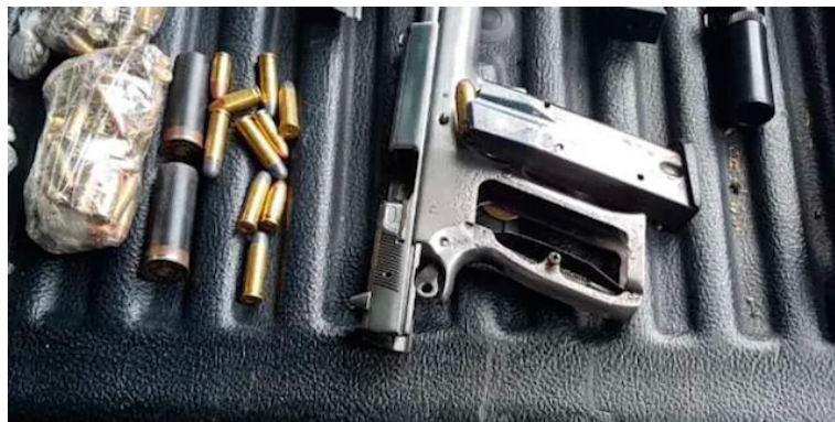
La propuesta de FESPAD se construyó tras un proceso de consulta entre organizaciones, líderes comunitarios, representantes de la PNC, de gobiernos municipales, para mejorar el control y la regulación de las armas de fuego.

El diputado presidente de la instancia legislativa, Caleb Navarro, dijo que con dichas disposiciones no se fomenta la compra