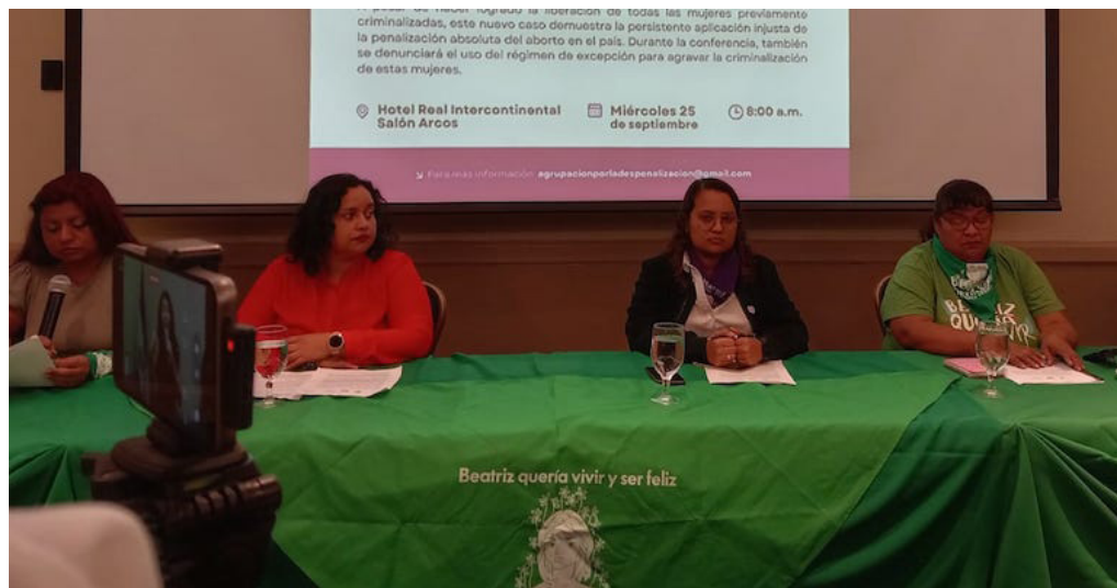
En el marco del “Día de Acción Global por la Despenalización del Aborto”, el diversas colectivas de mujeres : Asamblea Feminista, Agrupación Ciudadana por la Despenalización del Aborto y la Colectiva Feminista, denuncian un nuevo caso de una joven encarcelada por una emergencia obstétrica.

ficadas, neumonías no especificadas y neumonías bacterianas. Condiciones que pueden ser prevenidas, entonces, el Estado y el sistema de salud están fallando en garantizar la salud a las mujeres”, puntualizó Rodríguez.