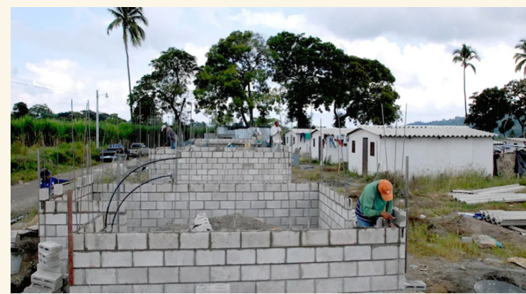
La Asamblea Legislativa se niega a estudiar propuestas enfocadas en la construcción de viviendas de interés social.

En la misma plenaria, Villatoro propuso un proyecto para impulsar la construcción de viviendas de interés social, exonerando de impuestos a quienes construyan casas de hasta 150 mil dóla-