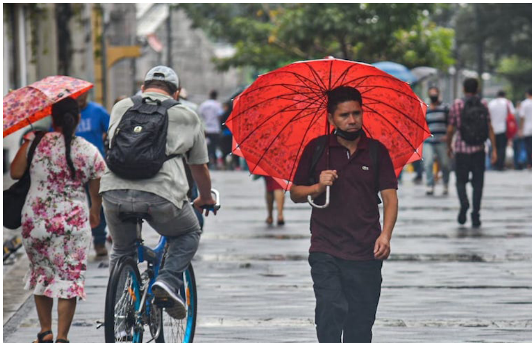
El MARN prevé para este jueves, que el cielo estará de medio nublado a nublado, con pocas lluvias en todo el territorio.

Mientras que, durante el 27 de septiembre el cielo permanecerá de medio nu-