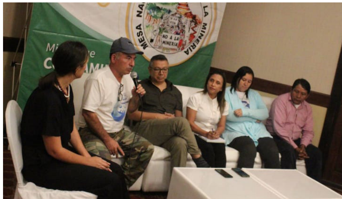
El Informe Defensoras y Defensores Ambientales: Redes del Cuidado frente a la Criminalización Estudio de los casos “Los defensores de Santa Marta y Caso Silverio Morales”, fue presentado por la Mesa Nacional Frente a la Minería Metálica.