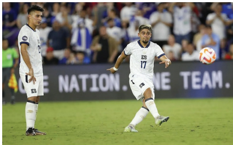
El Salvador vs Estados Unidos en la Liga de Naciones de CONCACAF.

Además, SoFi Stadium - Inglewood, CA (2023), Allegiant Stadium - Las Vegas, NV (2021, 2023), U.S. Bank Stadium - Minneapolis, MN (sede por primera vez), State Farm Stadium - Phoenix, AZ (2009, 2015, 2017, 2019, 2021, 2023), Snapdragon Stadium - San Diego, CA (2023), PayPal Park - San José, CA (sede por primera vez), Levi's Stadium - Santa Clara, CA (2017, 2023), CITY PARK - St. Louis, MO (2023),