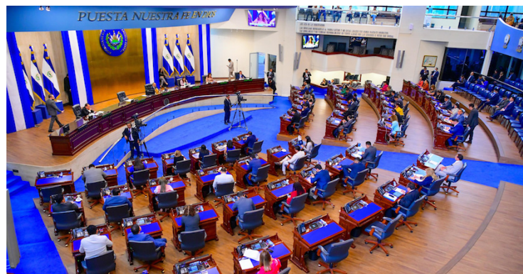
Asamblea Legislativa aprueba, en menos de una hora, incorporar a Hacienda $1,200 millones provenientes de endeudamiento.

de este año, la Asamblea, vía decreto legislativo N° 20 autorizó al Ejecutivo en el Ramo de Hacienda que gestionara la obtención de recursos por $1,500 millones, a través de la emisión de Títulos Valo-