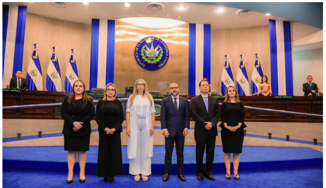
Nuevas Ideas elige, después de casi 2 meses, al nuevo Tribunal Supremo Electoral.

Más temprano, el presidente de la Asamblea, Legislativa, Ernesto Castro, anunció que este jueves se elegirían a los magistrados del TSE, acéfalo desde el 31 de julio. Afirmó que se elegirían a los magistrados del TSE respetando las leyes y la Constitución, por lo que dio a entender que se respetaría la asignación de un magistrado para Nuevas Ideas, ARENA y el FMLN. Además, aseguró que en las ternas presentadas por el FMLN y ARENA encontraron perfiles aptos para las magistraturas.