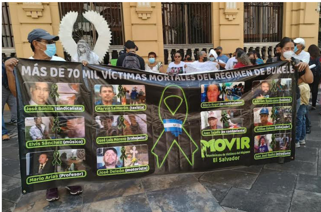
En reiteradas ocasiones las organizaciones han denunciado las graves violaciones cometidas dentro del régimen de excepción como: torturas, desapariciones forzadas, asesinatos en manos del Estado, entre otros.