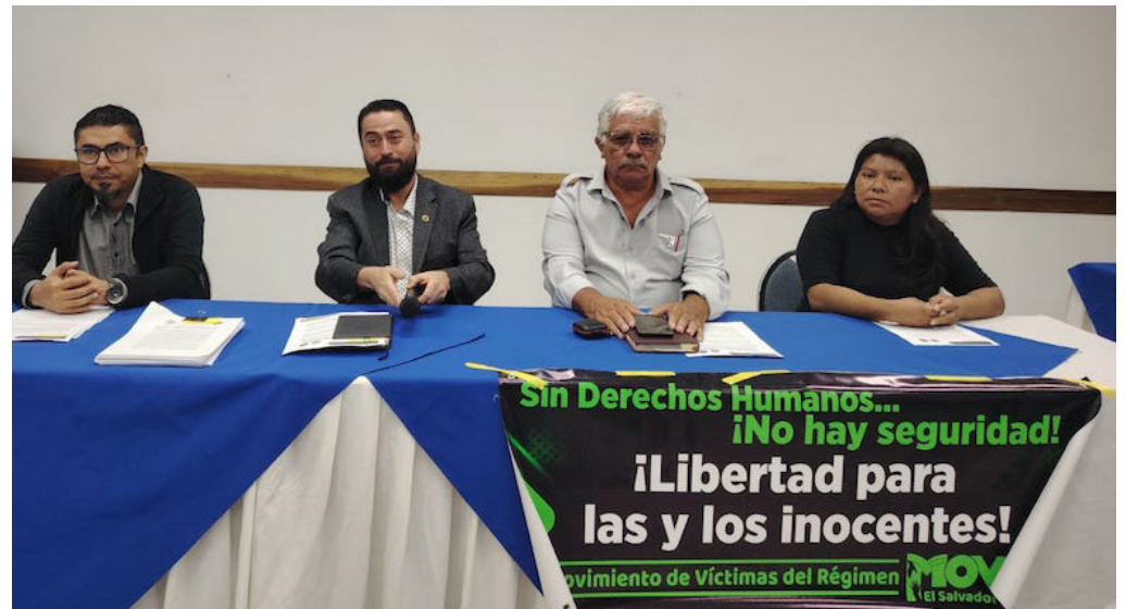
Integrantes de la Asociación Tutela Legal “Dra. María Julia Hernández” y el Movimiento de Víctimas del Régimen El Salvador (MOVIR), informan de la presentación de 530 nuevos casos de violaciones a los derechos humanos, ante la Comisión Interamericana de Derechos Humanos (CIDH).

En cuanto a la segunda etapa de la lucha social, Ortiz mencio-