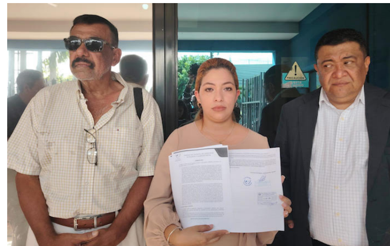
Afectados de COSAVI piden a la PDDH que los acompañen debido a que se les están vulnerando los derechos fundamentales.

Entre los casos extremos de los afectados por COSAVI, están personas que padecen o tienen indicios de cáncer, pero los cuales no cotizan en el sistema salud público y que, por lo tanto, necesitan urgentemente esos