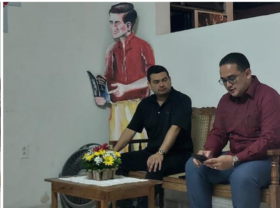
El libro "Daños Colaterales" fue presentado este jueves 26 de septiembre, en FUNDABRIL con acompañamiento del Colectivo Patria Exacta, que según Pedro Martínez, es un esfuerzo encaminado a promover el diálogo "alrededor de lo estético, la poesía, y la literatura en general".