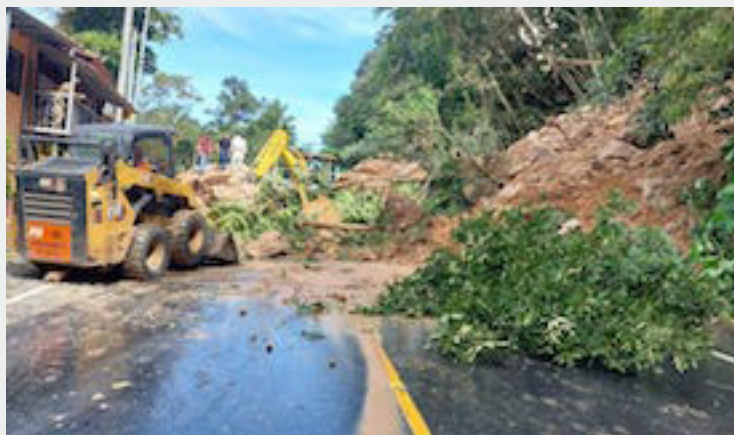
Lluvias intensas del fin de semana generan deslizamientos de tierra y derrumbes de rocas en Santa Ana y Chalatenango. Las lluvias pueden estar presentes en la primera semana de octubre informan autoridades.

La lluvia, no obstante, permite a la población desplazarse a sus hogares o lugares de trabajo, sin mayor complicaciones de inundaciones o deslizamientos de