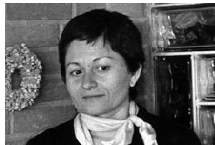
Marianella García Villas, abogada y fundadora de la Comisión de Derechos Humanos de El Salvador (CDHES). Al momento de su asesinato, en marzo de 1983, investigaba el uso de armas químicas por parte de la Fuerza Armada, instancia a la que se responsabilizó de su tortura y homicidio.

Marianella nació en agosto de 1948, se graduó de abogada en la Universidad Centroamericana (UCA), en 1969 integró al Partido Demócrata Cristiano (PDC), y fue diputada en el período 1974-1976, pero renunció al partido en 1980, y se dedicó a trabajar en la defensa de los derechos humanos de la población salvadoreña. Convirtiéndose en la presidenta de la Comisión de Derechos Humanos