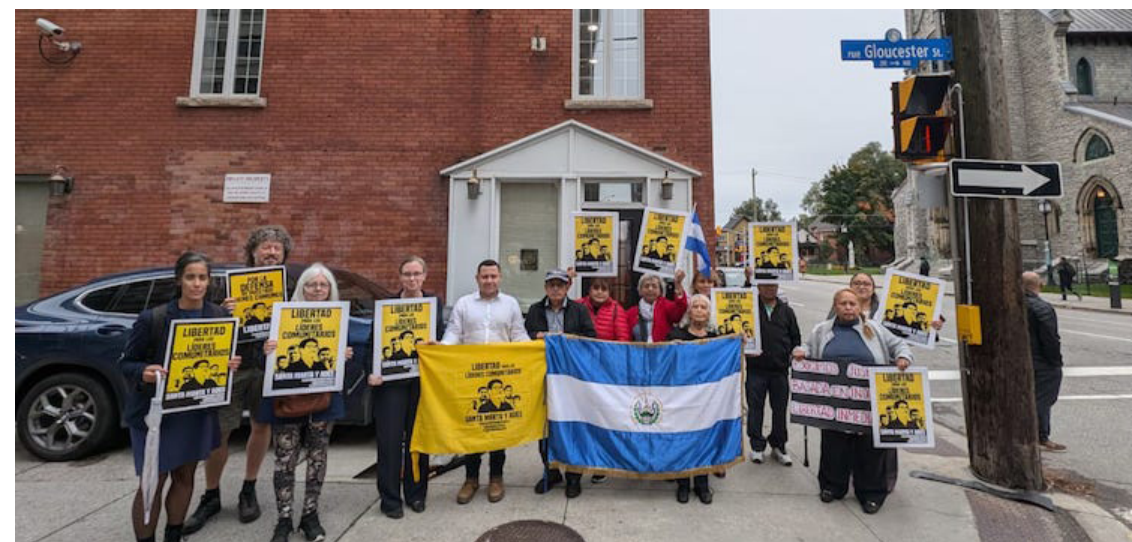
Organizaciones internacionales que apoyan a la sociedad civil salvadoreña en el caso de los cinco ambientalistas de Santa Marta -ADES, realizan diferentes acciones de protesta y hacen un llamado a dejarlos en libertad.