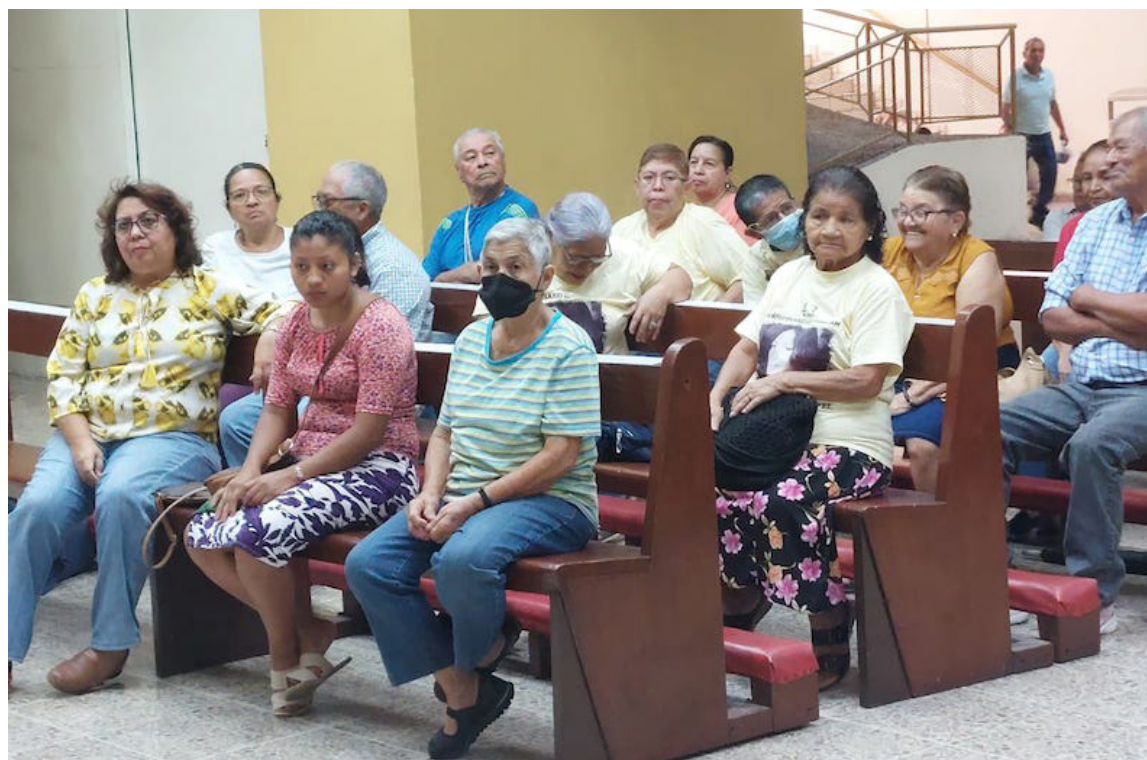
CODEFAM conmemora 43 aniversario de fundación en la búsqueda de las víctimas del conflicto armado de los años ochenta. Con una misa en la Cripta de Catedral Metropolitana.

“Es un trabajo continuado desde hace 43 años, como