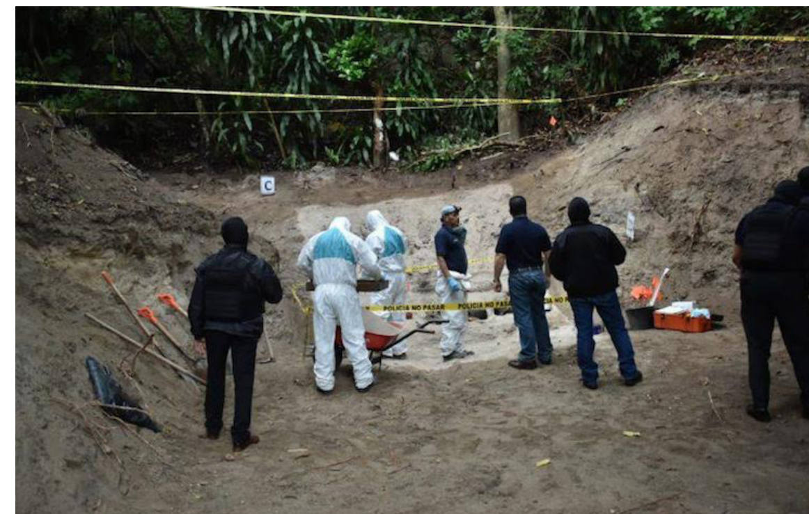
Entre 2019 y 2021, a nivel nacional, se localizaron 51 fosas clandestinas, solo algunas han sido excavadas por las autoridades.

Las pandillas comenzaron a ocultar los cuerpos, para evitar que la policía llegara e hiciera todo un aparataje