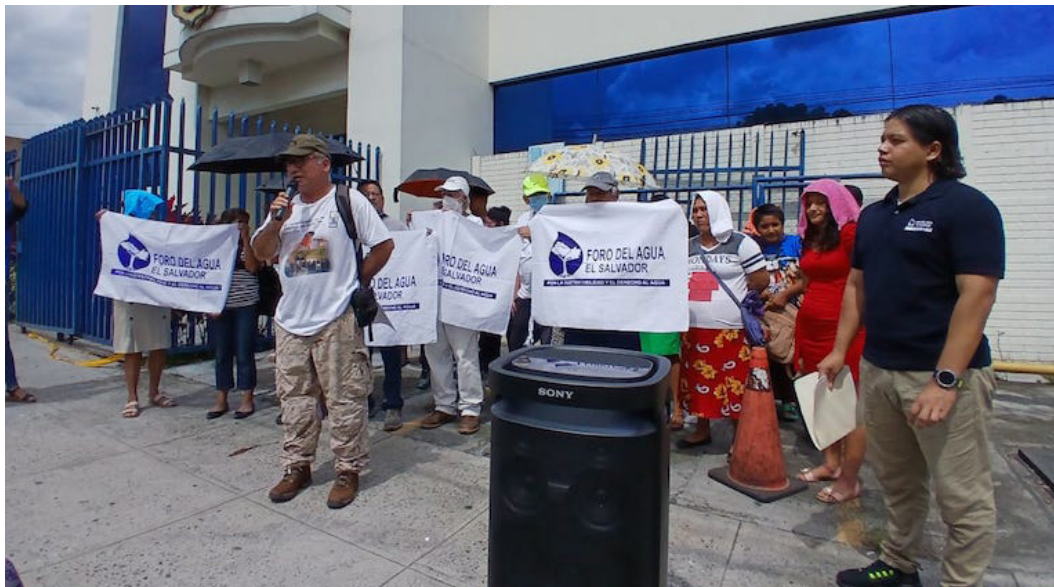
En el marco de la campaña de solidaridad con los cinco ambientalistas de Cabañas, el Foro del Agua El Salvador, exige la libertad y el sobreseimiento definitivo de los líderes comunitarios ante la sede de la Fiscalía General de la República.

Asimismo, reseñó que desde la detención de los cinco ambientalistas el 11 de enero de 2023, las irregularidades del proceso por parte del ente fiscal, fueron evidentes, al señalar que el requerimiento por “supuestos delitos de asesinato, secuestro y agrupacio-