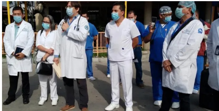
Los médicos y los docentes no tendrán escalafón para el 2025, según lo anunciado por el Gobierno.

Marcela Villatoro, también del partido ARENA, lamentó que el GOES vaya a congelar los escala-