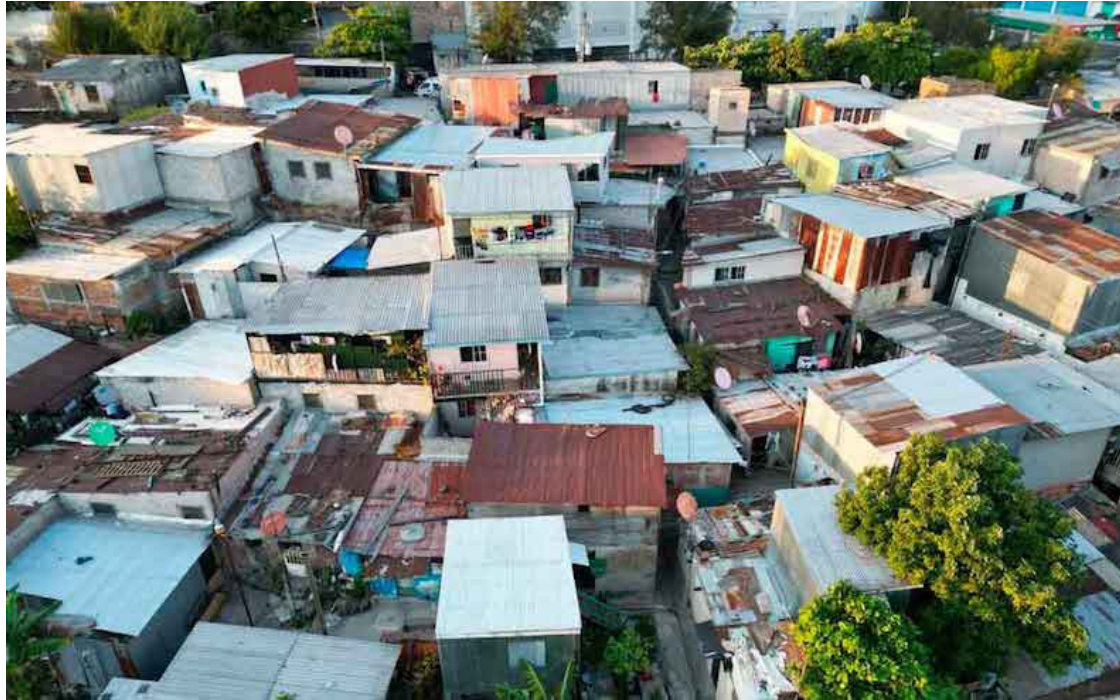
La Encuesta de Hogares de Uso Múltiple de 2022 reveló que, de cada 10 familias en El Salvador, 6 habitan en viviendas inadecuadas, es decir, un lugar vulnerable y sin servicios públicos.