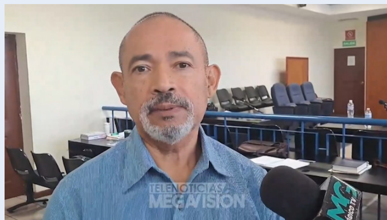
Los jueces del Tribunal Quinto de Sentencia fijaron el 21 de octubre, de forma tentativa, para dar el fallo, que se espera sea absolutorio.

La audiencia se llevó a cabo en el Tribunal Quinto de Sentencia de San Salvador, en el caso que involucra a exfuncionarios del gobierno del FMLN, entre ellos al exministro de Justicia y Seguridad, Ramírez Landaverde, Ramón Roque y otras 17 personas más.