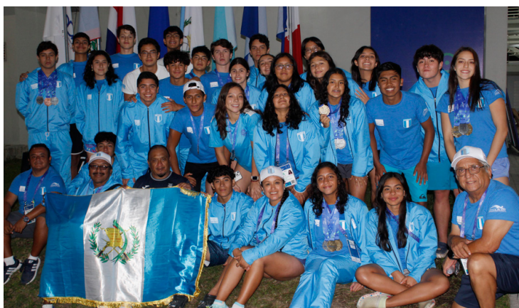
La delegación de Guatemala en los Juegos CODICADER continúa como líder del medallero de cara a la recta final de la contienda.

anfitrión, que consiguió 57 medallas en los primeros 6 días, de estas 24 son doradas, 15 plateadas,