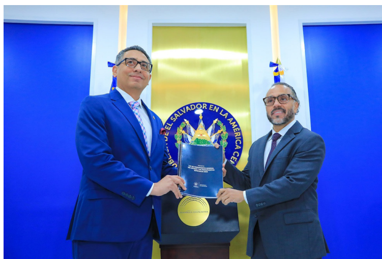
El Legislativo estudiará el proyecto de presupuesto 2025 durante los próximos 3 meses.

“Tenemos la delicada función de evaluar, discutir y aprobar el presupuesto que el Ejecutivo y todas las demás instituciones del Estado van a tener para el próximo ejercicio fiscal (...) Este año, nos va a tocar discutir un presupuesto que, por primera vez en décadas, no será financiado con préstamos