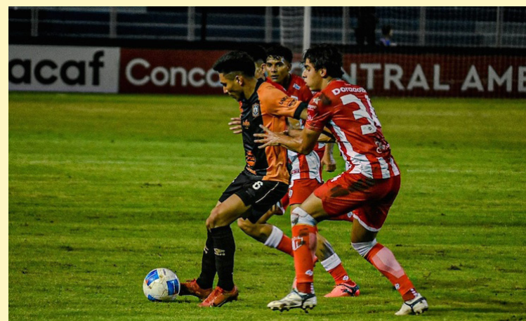
CD Águila enfrenta al Real Estelí en el Cuscatlán, partido de vuelta de los cuartos de final de la Copa Centroamericana de CONCACAF.