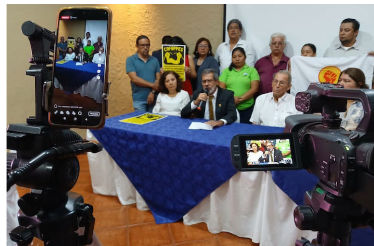
Una amplia expresión de organizaciones sociales y movimientos populares, expresaron su apoyo a los cinco ambientalistas de la Comunidad ADES y Santa Marta, y exigen su absolución total de los cargos que les imputa la Fiscalía General de la República.

“Ahora, una vez más los ojos del mundo están sobre El Salvador, para ver qué pasa con cinco defensores de recursos naturales más que todo del agua en este país. Acusados injustamente de un crimen del que no existe ninguna evidencia, lleván-