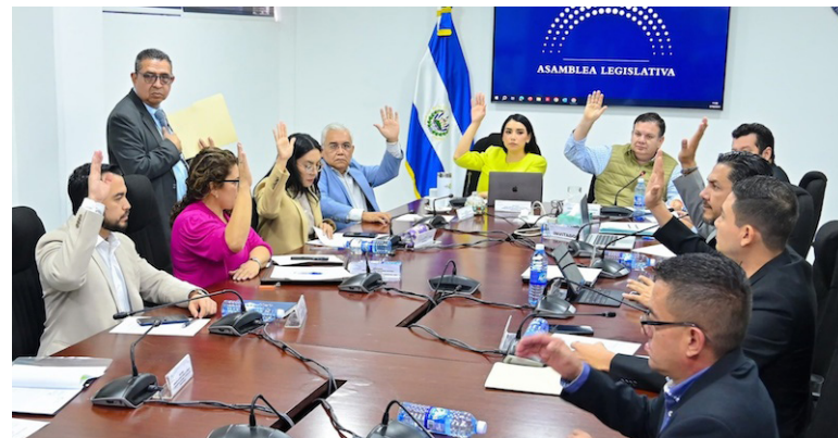
La Comisión de Hacienda emite dictamen para redistribuir fondos a diversas instituciones del Estado.

Según informó Arce, hoy los $159.9 millones serán tomados de las asignaciones disponibles dentro del presupuesto vigente del ramo de Hacienda, del fondo general. Respecto a la segunda iniciativa aprobada fue para que suscribir un contrato de préstamo por $235 con el Banco Interamericano de Desarrollo (BID) a fin de desarrollar el Programa