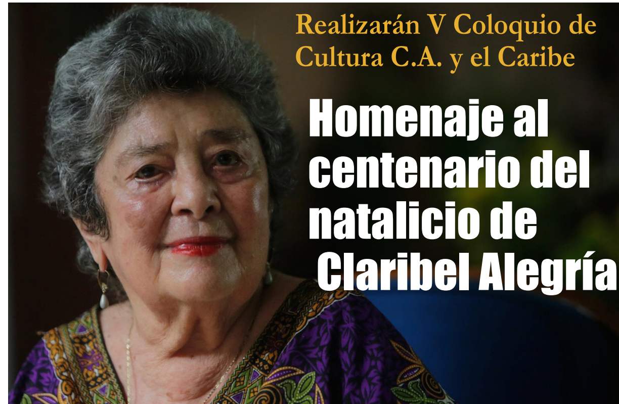
Claribel Alegría, escritora, poeta, narradora, ensayista y traductora nicaragüense.