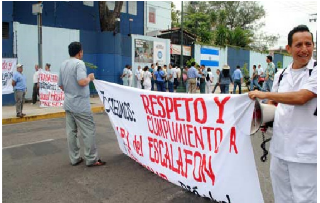
En 2025 el gobierno congelará el escalafón para los empleados de las instituciones públicas, los sindicatos han convocado a una marcha y expresar su rechazo.

“Es triste ver las carencias en los hospitales donde