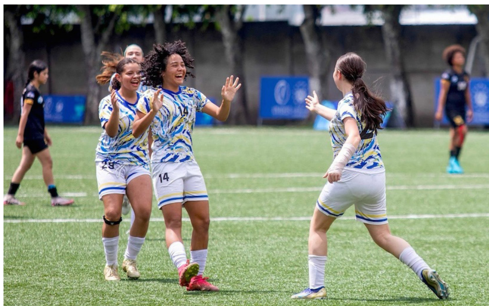
Costa Rica cierra el sexto día de los Juegos CODICADER como primero del medallero.

El Salvador continuó en la tercera posición en el medallero general, con 28 de oro, 19 de plata y 28 de bronce. Entre esas medallas destacan las 34 de la categoría femenina, entre 8 de oro, 10 de plata y 16 de bronce. Además, las 43 por parte de la categoría masculina, con 20 doradas, 9 plateadas