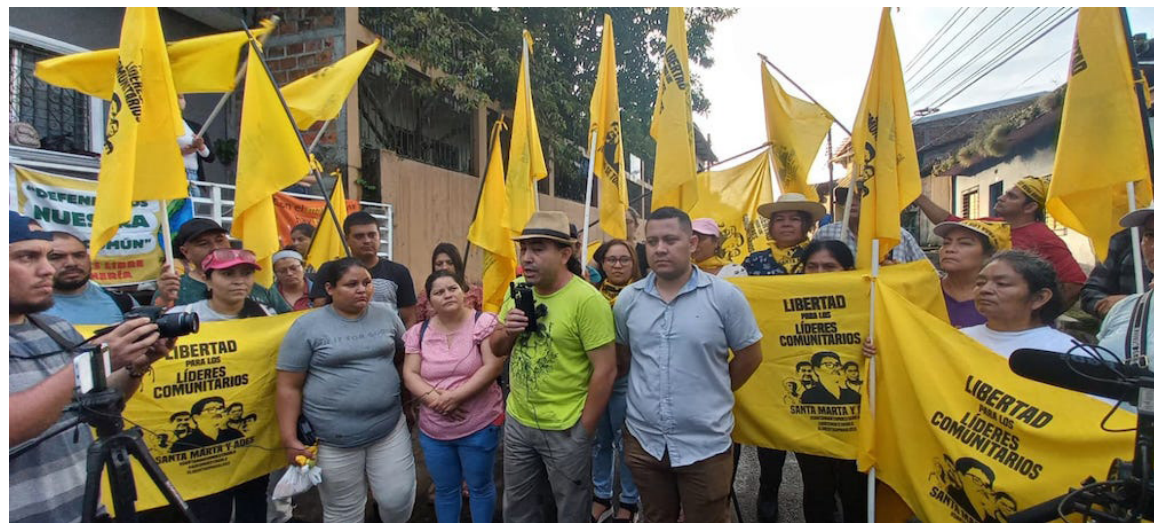
El Estado está empeñado en criminalizar a los ambientalistas, que cada día de la Vista Pública están recibiendo el apoyo de la comunidad Santa Marta-ADES.

El Estado está empeñado en criminalizarlos y la FGR presenta falta de pruebas, con el famoso testigo protegido, que ha enseñado un lugar falso donde estaba enterrada la supuesta víctima que no fue encontrada ni con excavadoras del MOP.