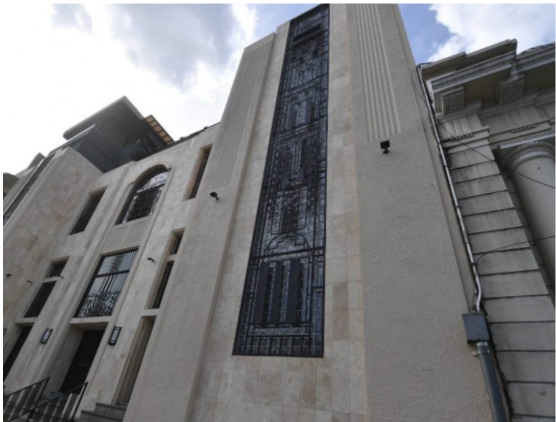
Los hermanos Bukele adquieren un edificio por $1.3 millones mientras que el Gobierno reprime a los vendedores ambulantes.

El edificio fue construido en la década de los 40 y fue conocido porque en los 70 funcionó el Banco de Londres y Montreal. Con la restauración, se observa que en los vitrales de la fachada luce adornos metálicos que imitan el mosaico que el artista Fernando Llorca diseñó para la Catedral Metropolitana de San Salvador, una obra que representa a La Palma, en Chalatenango, y que fue destruido por órdenes de la Iglesia católica a finales 2011.