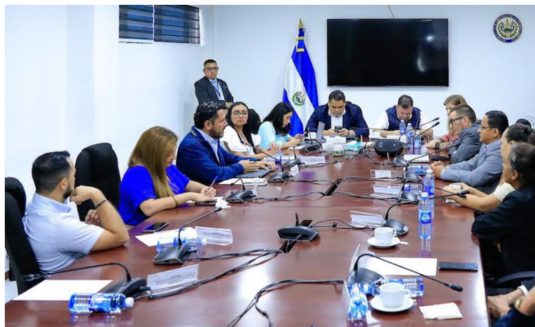
La Comisión de Hacienda escuchará las explicaciones de los ministros de sus presupuestos para el próximo año.

Explicados los montos a cada institución de forma general, los parlamentarios establecieron un calendario para los funcionarios de diversos ministerios. Acordaron que