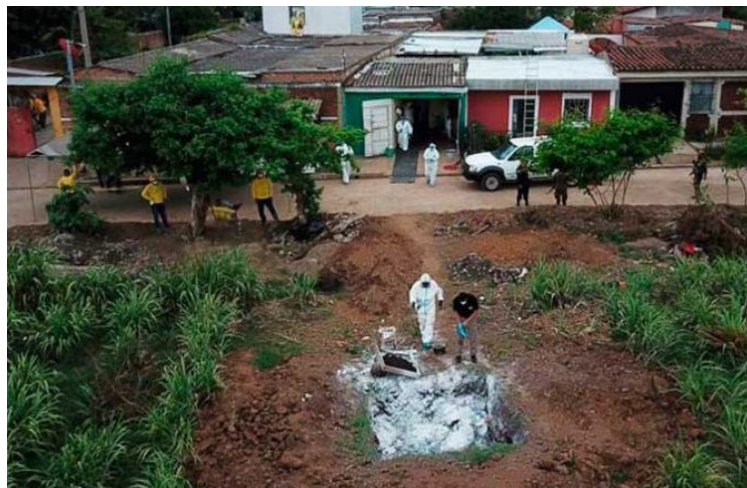
En El Salvador hay 51 fosas clandestinas, una de ellas, en la finca Suiza, Nuevo Cuscatlán, atrás la residencial Los Sueños, donde vive el presidente Nayib Bukele.