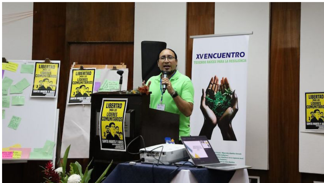
Más de 300 organizaciones que integran la plataforma: Centroamérica Vulnerable ¡Unida por la Vida!, se pronunciaron en solidaridad por la libertad de los cinco ambientalistas de Santa Marta ADES, Cabañas.

En El Salvador lo que se conoce como un Estado democrático y constitucional de derechos, pues se ha perdido, porque somos un país en donde las características