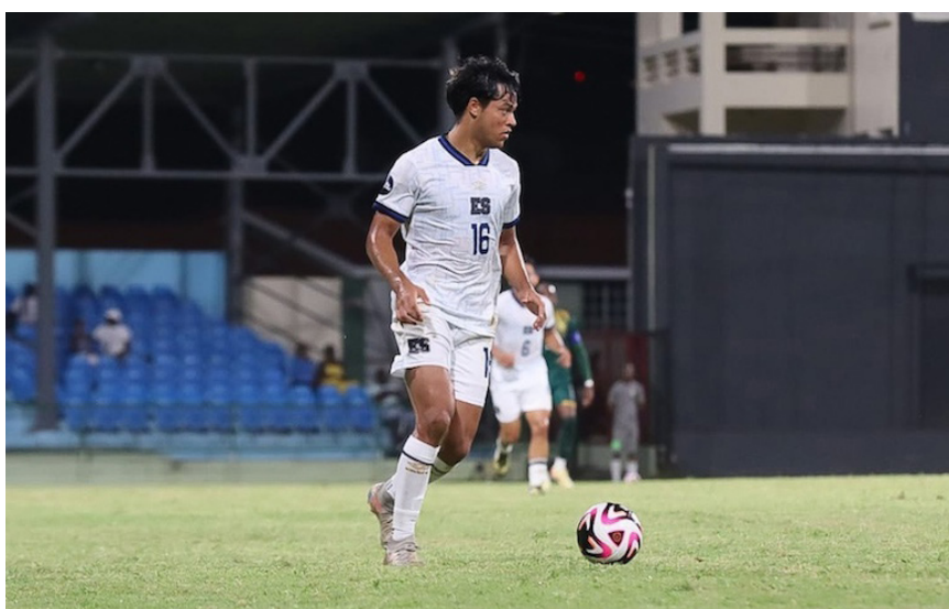
El Salvador cae 1-2 ante San Vicente y las Granadinas en la cuarta fecha de la fase de grupos de la Liga de Naciones de CONCACAF.

Las selecciones tuvieron una de las derrotas más importantes ante el combinado nacional de San Vicente y la Granadinas, este pasado domingo 13 de octubre, y es que