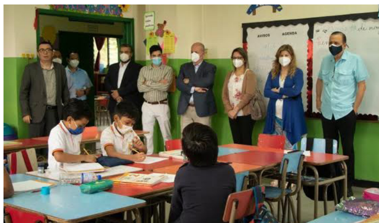
Fundación Padre Arrupe pide a la Asamblea Legislativa que se les pueda apoyar con $800 mil el próximo año a fin de seguir con el programa de becas.