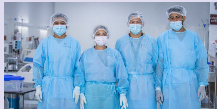
El Ministerio de Salud anuncia la disponibilidad de 114 plazas de médicos en subespecialidades para la red hospitalaria pública del país.

“La acreditación es un proceso que evalúa y certifica las ca-