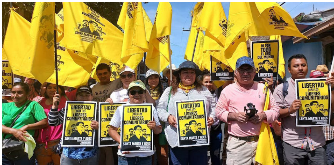
Diversas organizaciones del Movimiento Social, se encuentran en las afueras del Tribunal de Sentencia de Sensuntepeque, Cabañas en el cuarto día de la Vista Pública contra los cinco ambientalistas de ADES Santa Marta.

“Esperamos que luego de los alegatos finales o mañana a más