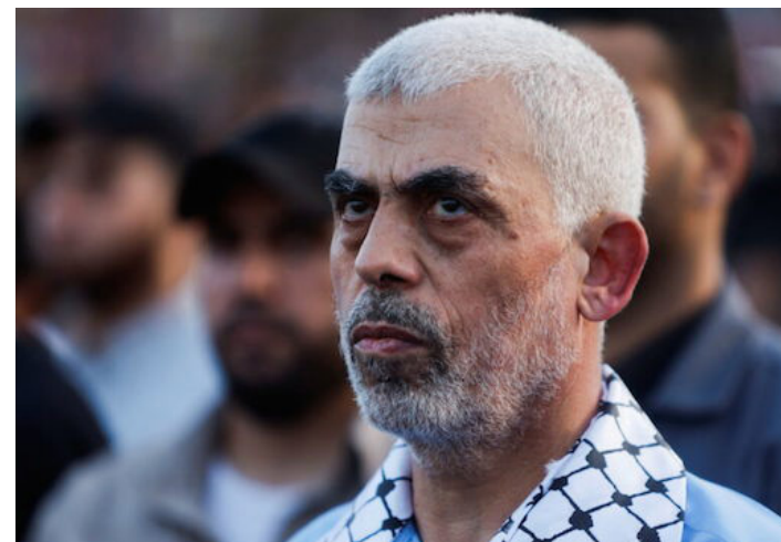
Muere Yahya Sinwar, líder de Hamas, durante una operación en el sur de la Franja de Gaza.

De acuerdo con Katz, “la eliminación de Sinwar genera la posibilidad de una libe-