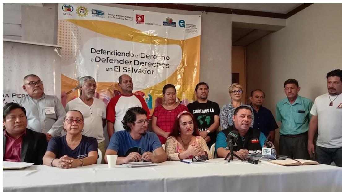
Organizaciones que integran la Mesa Permanente por la Justicia Laboral, se pronuncian en contra de la decisión gubernamental de excluir el escalafón en las Carteras de Estado de Salud y Educación.

“Nosotros combatimos todas las injusticias -vengan de donde vengan-, y en este sen-