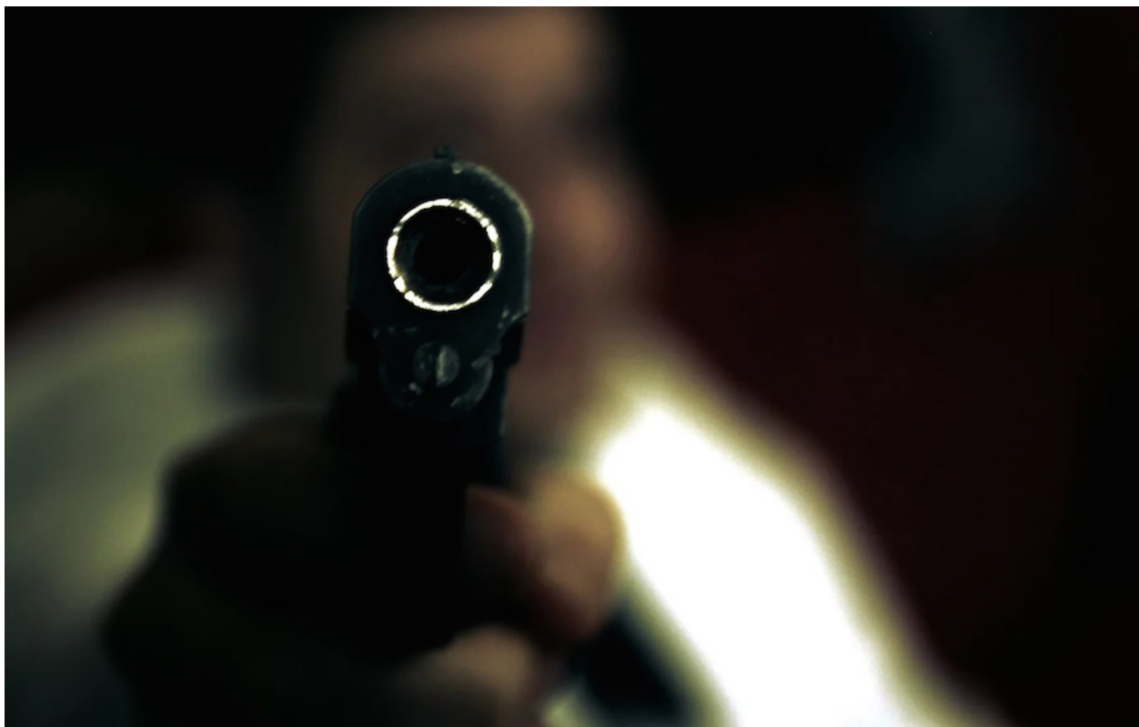
Este 16 de octubre la Asamblea aprobó legalizar las armas de fuego adquiridas ilícitamente, sin embargo, esto vendría a favorecer el comercio ilegal.