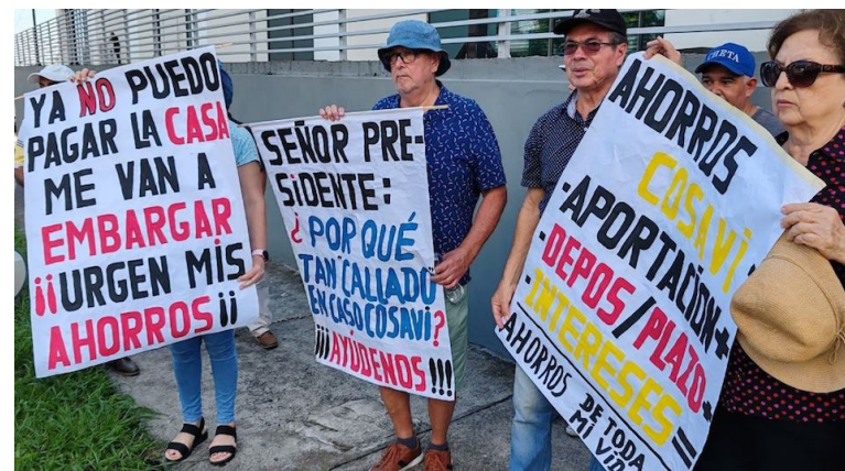
Los afectados denunciaron que la Superintendencia del Sistema Financiero (SSF) presenta un retraso de cuatro semanas en la entrega de los fondos correspondientes.