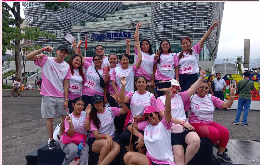
La Asociación Cooperativa de Ahorro y Préstamo y Crédito de Trabajadores (CACTIUSA de R.L.), realiza su evento “Corramos Juntos por la Prevención del Cáncer de Mama”, en donde participan sobrevivientes y familiares de mujeres con cáncer de mama a fin de sensibilizar sobre esta enfermedad que puede ser prevenible.

“Todas esas son ideas erróneas que no deberían estar interponiendo en la salud de la mujer. Y es importante que todas y cada una de nosotras nos hagamos estos exámenes rutinarios. Y conste, no sólo las que tienen hijos, sino también las mujeres sin hijos deben hacerse los exámenes y dejen de pensar que no corren riesgos”, argumentó Erazo.