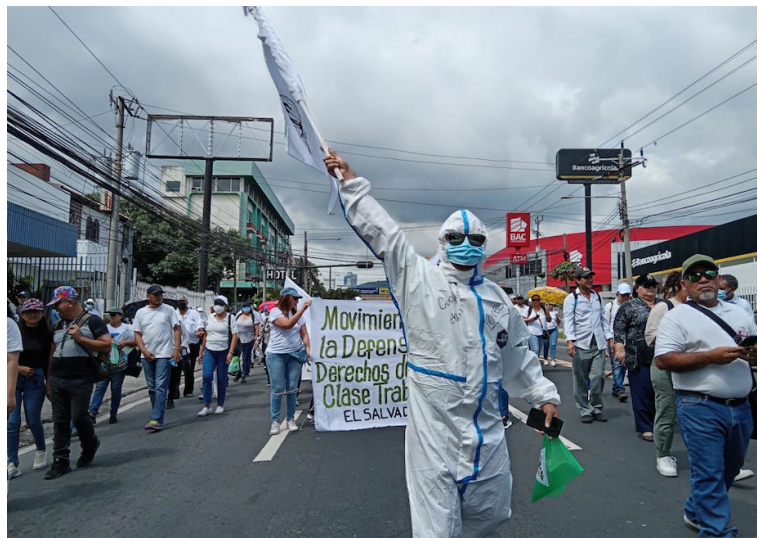
El Sistema de Salud ya está afectado porque faltan médicos, enfermeras, promotores de salud y sumado a esto les quitan plazas y no aplican su ley de escalafón.

“Estos dirigentes no han representado los intereses del personal, sino intereses de grupo, que son personas que sólo quieren ser amigos de los funcionarios. Y eso a nosotros no nos interesa, queremos que respeten y resuelvan esos problemas y el pueblo salvadoreño no sufra la reducción del presupuesto de salud”, puntualizó Navarrete.