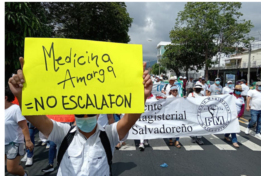
El movimiento popular y sindicatos asisten a la "Marcha Blanca", para denunciar la mayor reducción de plazas para el próximo año en el Sistema de Salud, que afectara la salud de la población salvadoreña.