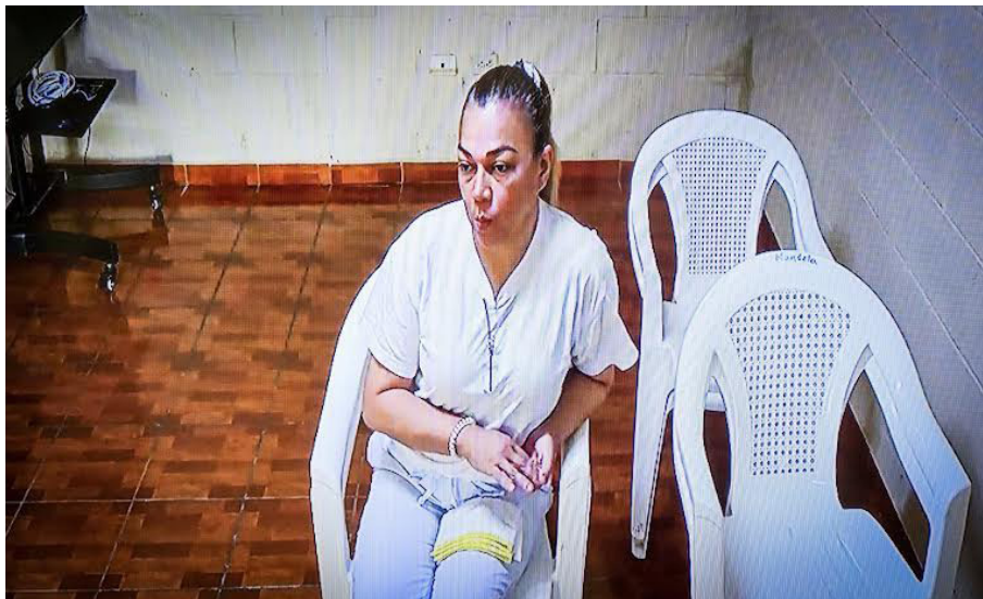
Nercy Patricia Montano de Martínez es acusada de retener cuotas laborales por un monto de $387,000 dólares durante su administración como alcaldesa del municipio de Soyapango.