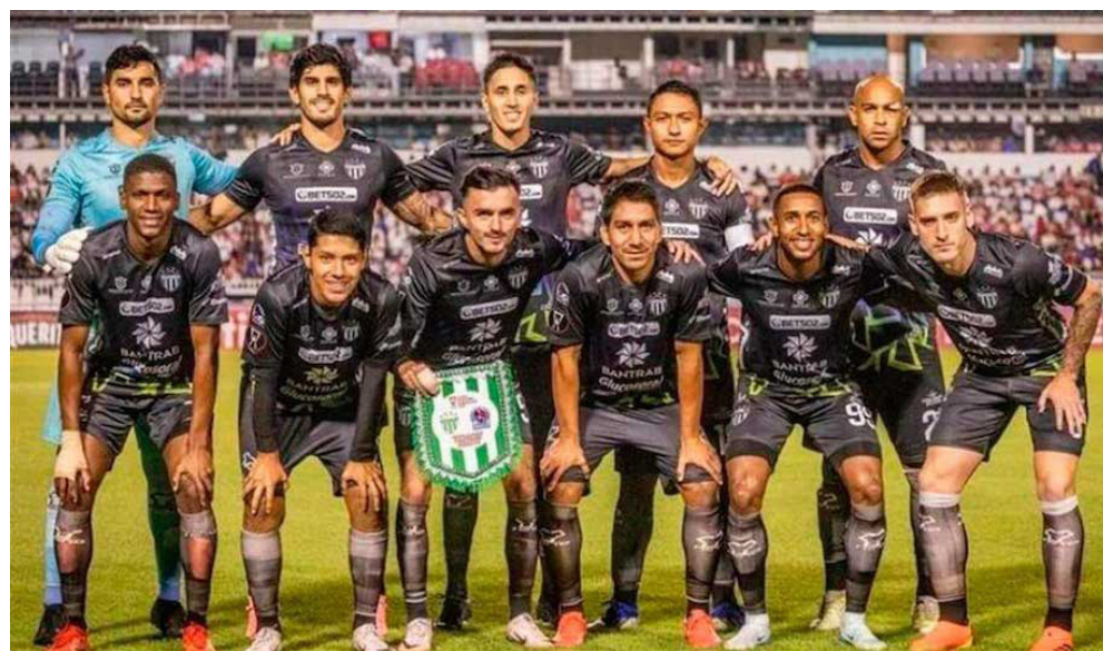
Ciudad de Guatemala/Prensa Latina

El club Antigua GFC por su impresionante desempeño en la Copa Centroamericana desplazó a Comunicaciones de la punta de los de Guatemala en el último ranking de la Concacaf divulgado este lunes.