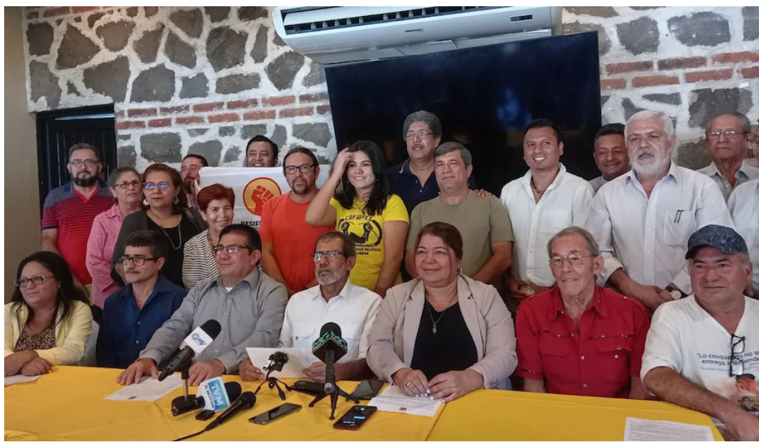
Movimiento Social exige a la Fiscalía General de la República, a respetar el fallo del Tribunal de Sentencia de Sensuntepeque, que absuelve a los cinco ambientalistas de ADES y Santa Marta en Cabañas.

“Era una clara manipulación y violación de la investigación que hizo Fiscalía Gene-