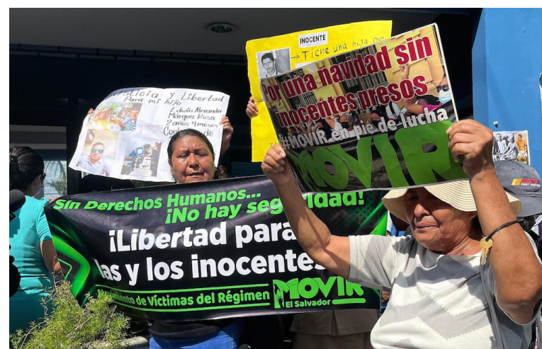
UNIDEHC y MOVIR denuncian que Centros Penales no permite el ingreso a Medicina Legal, para evaluar la salud de los detenidos bajo el Régimen de Excepción, ya que se les está negando el acceso a servicios médicos.

“Hay tantos casos documentados de muchas personas que al menos quieren saber si su familiar está bien de salud, hay reos con enfermedades crónicas, personas que salen con cáncer, ponen las fotos de ellos como que son delincuentes, pero no pesa