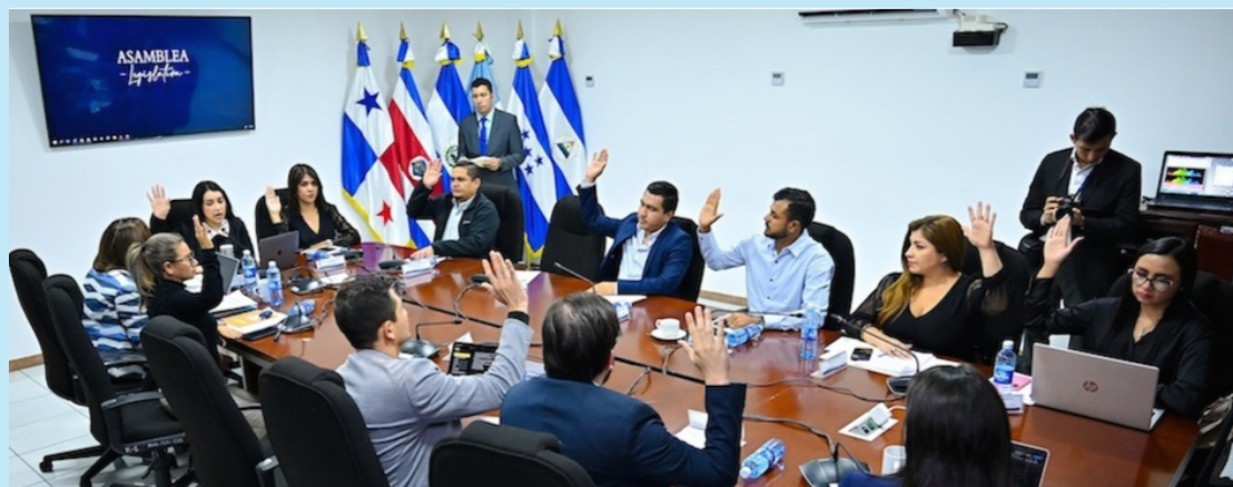
Comisión de Tecnología vota a favor de emitir la Ley de Energía Nuclear, la cual regulará todo en dicha materia.

cumplimiento de la Ley de Energía Nuclear. (régimen sancionatorio, infracciones, procedimientos), control y supervisión de las actividades, instalaciones y prácticas, la DGHM será la máxima autoridad en energía nuclear.