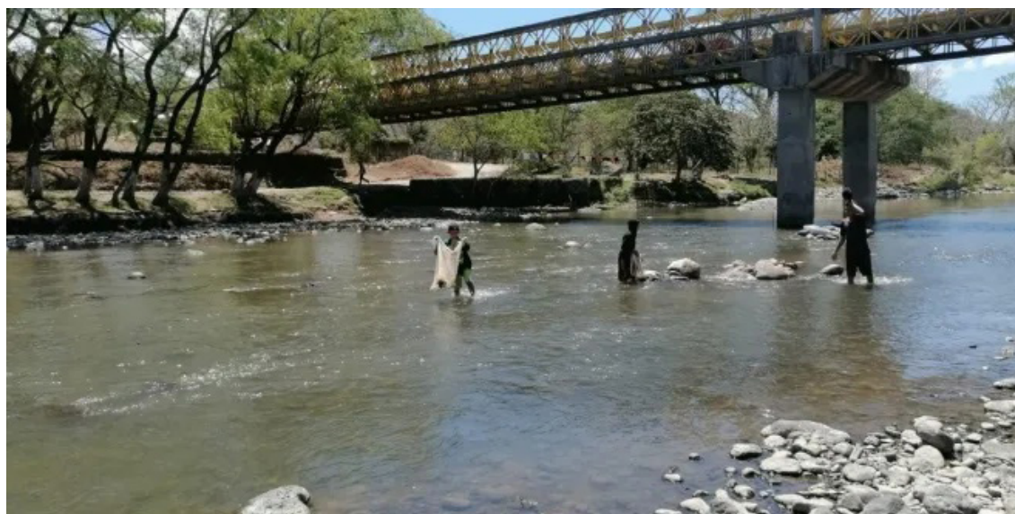
La cuenca del río Lempa se extiende en 17 mil 926 kilómetros cuadrados de lo cual, 9, 877 kilómetros cuadrados pertenecen a El Salvador, es decir, el 55.1% de la cuenca.