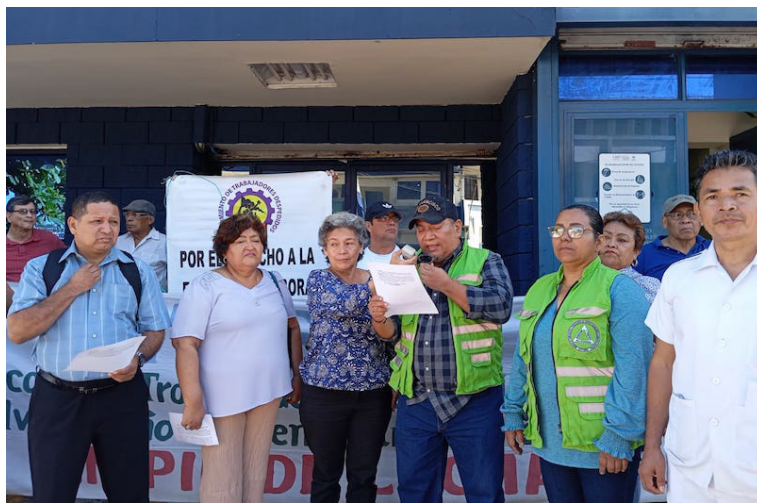
El Movimiento para la Defensa de los Derechos de la Clase Trabajadora denuncia el despido de directivos sindicales, quienes participaron en la marcha del pasado 19 de octubre, en rechazo al presupuesto de 2025.

“Ante esta situación de graves retrocesos a la libertad sindical, estabilidad laboral, contratación colectiva, condenamos la represión que ha desatado el actual gobierno a las personas luchadoras sociales, no nos amedrentarán, más bien se