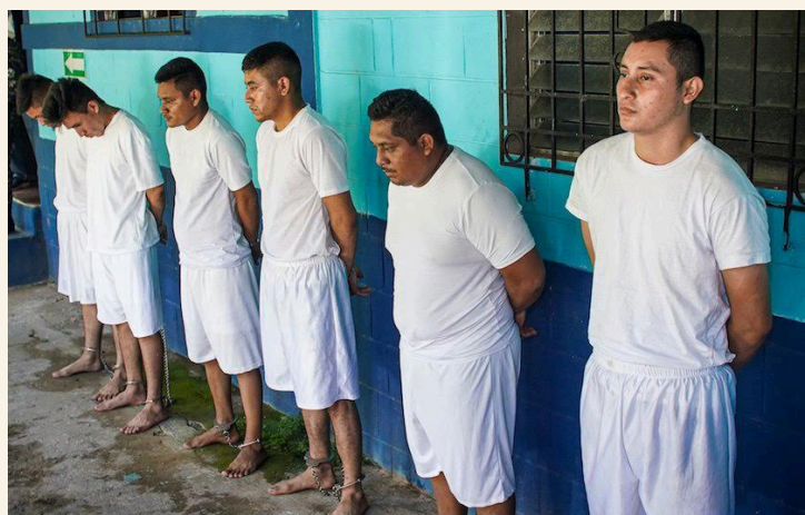
Estos son los ex soldados que abusaron de una menor de edad en Mizata en septiembre de 2023.

En una audiencia especial, el Juzgado Primero de Instrucción, dando cumplimiento a la resolución emitida por la Cámara de lo Penal de la Cuarta Sección del Centro de Santa Tecla, ordenó que los exsoldados enfrenen un juicio en calidad de cómplices necesarios por los delitos de privación de libertad agravada, violación en menor e incapaz agravada, así como agresión sexual en menor e incapaz agra-