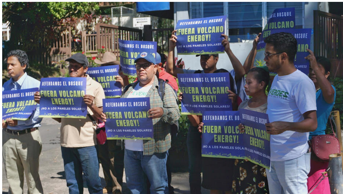
Reverdes asegura que la planta fotovoltaica de Hashpower Energy Solutions abastecería una procesadora de bitcoins.