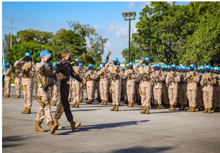
Un contingente de la Fuerza Armada Salvadoreña viajará a Haití para apoyar en las evacuaciones médicas.