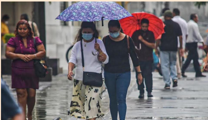
El MARN prevé que a partir del mediodía de este jueves se tendrán lluvias y tormentas en la cordillera volcánica y franja norte del país.

El Centro Nacional de Huracanes continúa monitoreando en el mar Caribe, el desarrollo de una amplia zona de baja presión para el final de la semana, la cual se podría convertir en una depresión tropical durante el fin de semana o a principios de la próxima semana, mientras el sistema se desplaza hacia el norte, sobre el centro u oeste del Mar Caribe.