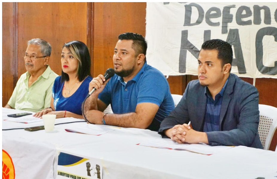
Algunos de los detenidos son personas adultas mayores, con padecimientos de enfermedades crónicas y necesidad de medicación permanente.