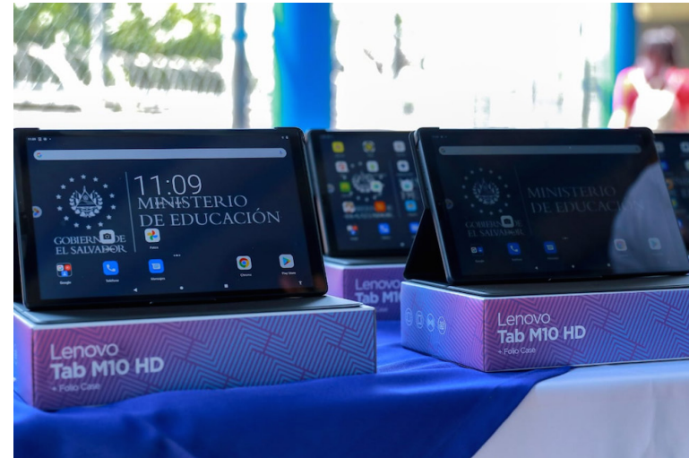
A los estudiantes se les pidió apagar sus tablets para una “actualización”.

En síntesis, “el gobierno tenía nula protección o controles de acceso a estos paneles, la seguridad nacional está en segundo plano, (...) desconocemos cuánto tiempo lleva así, (...) alguien más podría haberlo descubierto antes que nosotros y todos los dispo-