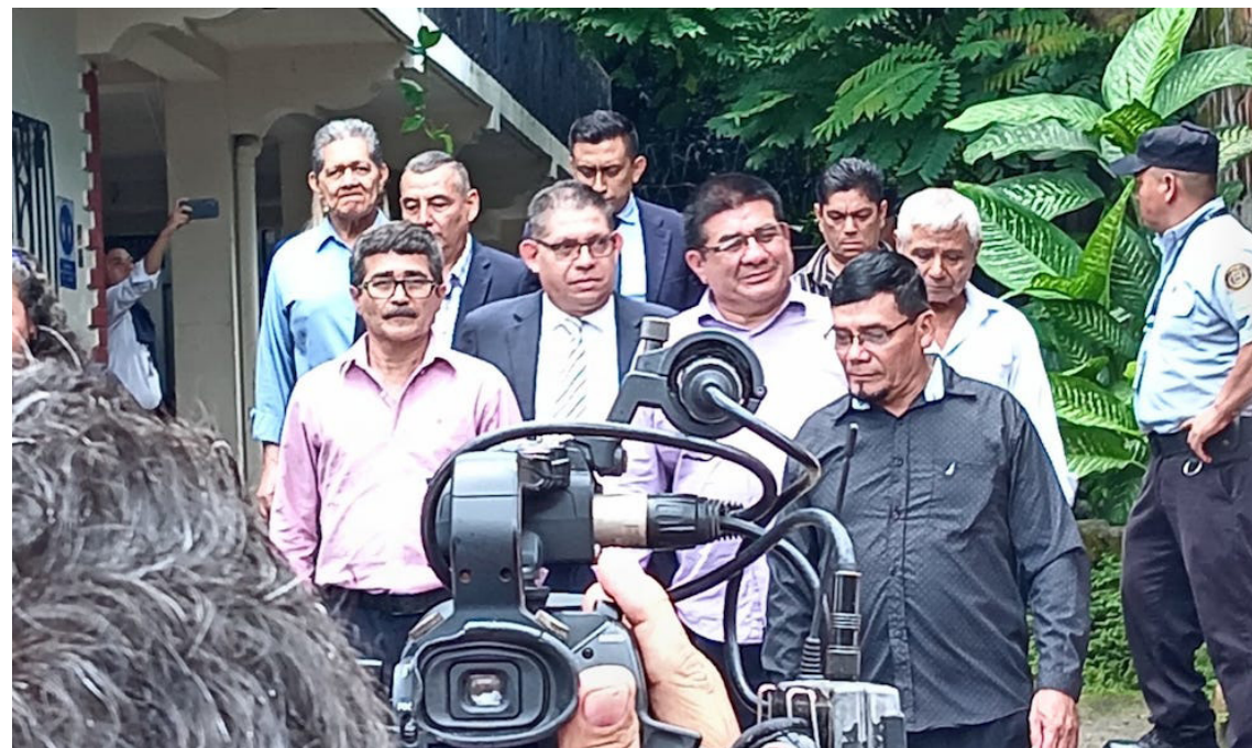
El caso contra los ambientalistas de Santa Marta, puede ser una lección de lucha que desnuda la intencionalidad del régimen de instrumentalizar a las instituciones y a la ley misma para beneficio del enriquecimiento de algunos pocos.