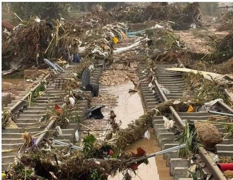
Las torrenciales lluvias han dejado víctimas mortales, personas desaparecidas y daños infraestructurales en Valencia, Albacete y Málaga, España.

fensa ha ofrecido “morgues portátiles”, ya que para cuando los servicios de emergencia retiren el lodo acumulado en algunas viviendas, se podrían encontrar más personas fallecidas.