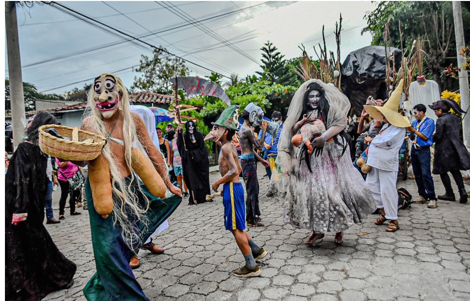
La Sigüanaba, El Cipitío, La Llorona, el Padre sin Cabeza, Los Gritones, el Cadejo Blanco y Negro, el Diablo, la Muerte y otros personajes mitológicos salvadoreños fueron quienes le dieron el color al festival.