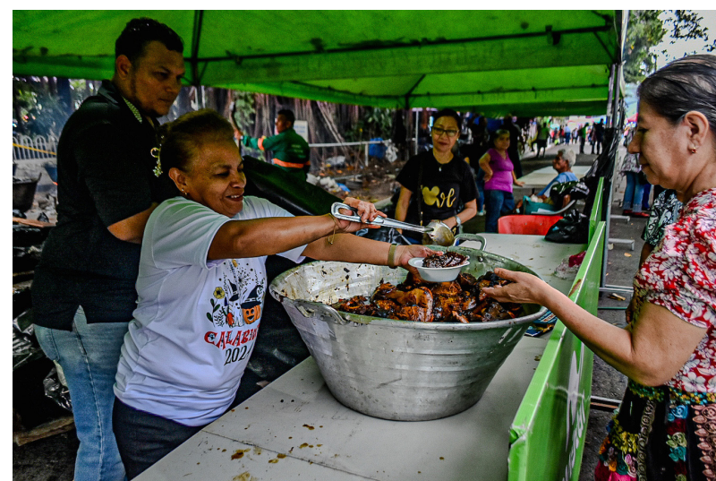
Son aproximadamente 750 ayotes los que se cocieron para que se repartieran en el parque central José María Villafaña. De cada ayote se sacar alrededor de 25 porciones.