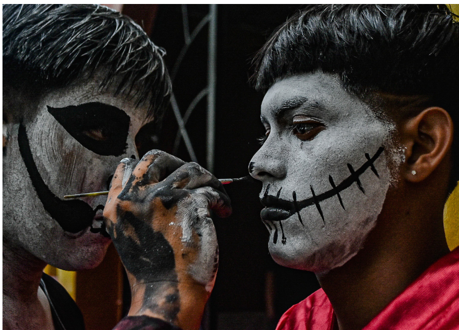
Desde horas de la tarde, cientos de jóvenes participantes del festival se pintan para personalizar su papel. Pese a la lluvia, que retrasó el desfile, se vivió un verdadero espectáculo.