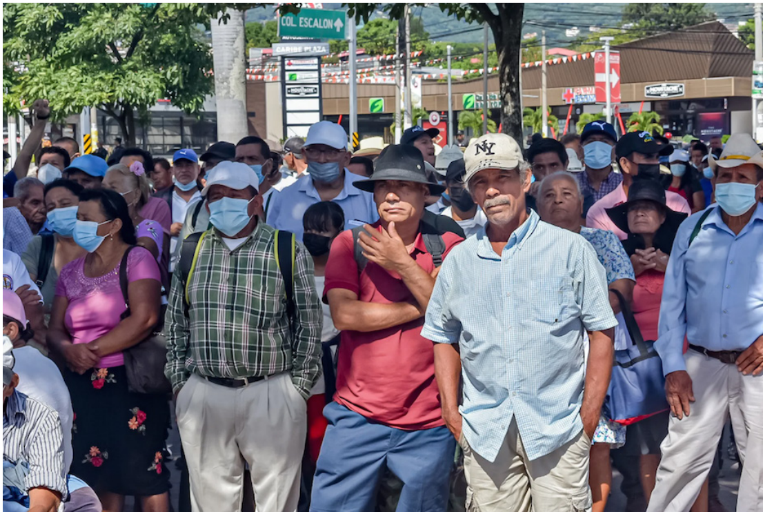
Serán más de 20 mil personas las que se le suspenden la pensión por observaciones en su expediente.