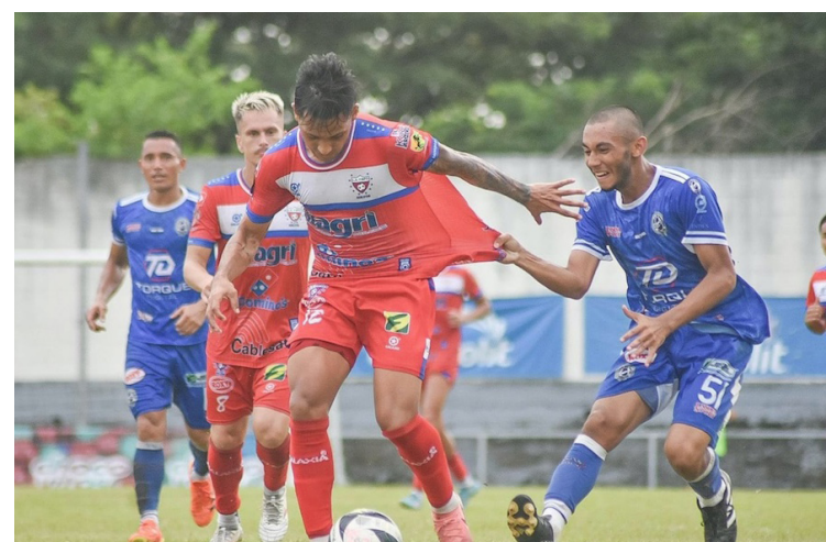
Firpo vence 0-2 al Fuerte en el estadio Correcaminos, y descansa líder en la tabla previo al cierre de la fase regular del torneo.

Hay que mencionar que ya se confirmaron los primeros seis clasificados a los cuartos de final del torneo, en este caso Firpo, que actualmente es primero en la tabla, Isidro Metapán, Cacahuatique, Águila, Alianza y Once Deportivo, a la espera de la posiciones finales en el top 8.