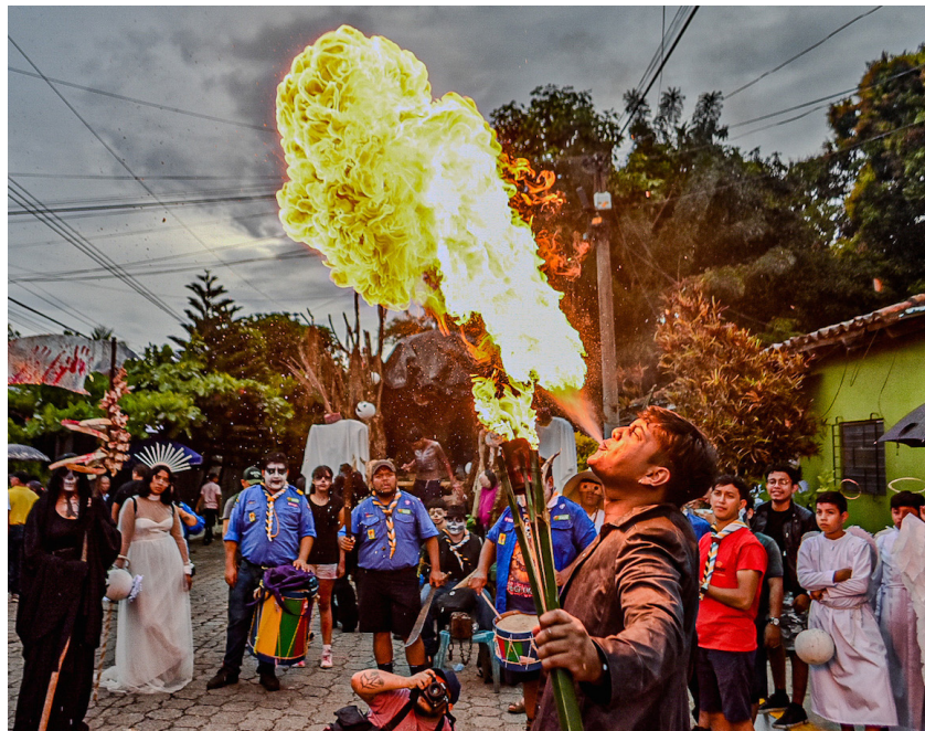
Los jóvenes habitantes del distrito realizan este festival como una forma de expresar la identidad y cultura del país; algunos le ponen un toque de adrenalina para darle más dinámica al festival.