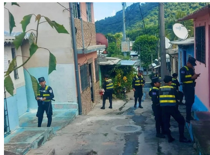
Más de 20 personas involucradas en el tráfico de drogas han sido capturadas en las últimas semanas.

Los narcos locales al igual que los detenidos en alta mar, serán procesados por el delito de posesión y tenencia de droga, precisaron autoridades.