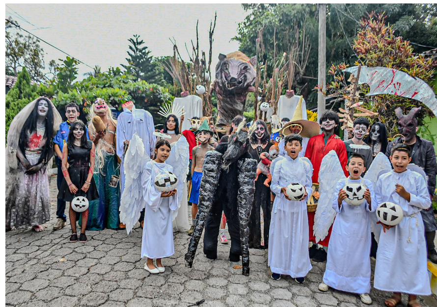
En la categoría juvenil en representación de la Carreta Chillona los SLPS – SCOUT ganan el primer lugar.