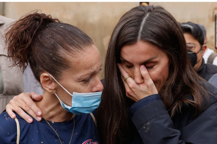
La Reina Letizia, manos en el rostro, conversa con una afectada en Paiporta, Valencia, España. El rostro de su majestad, además de lágrimas presentaba salpicaduras de barro.