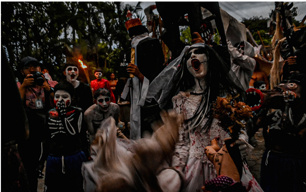
Tonacatepeque desarrolla su mítico festival de la Calabiuza, una tradición cumple 32 años.