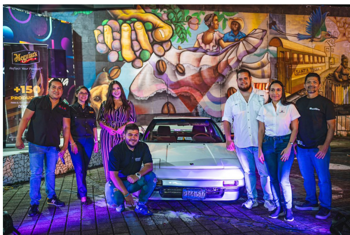
Este 30 de noviembre se llevará a cabo la edición XXXV del Super Auto Show, en el Parque Deportivo El Cafetalón.