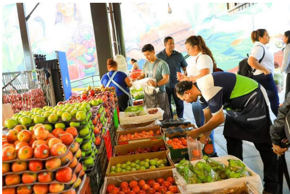
De ser cierto que el gobierno subsidia los productos en la Central de Abasto, el CDC considera que podría generar una complicación en la soberanía y seguridad alimentaria.

“Es fundamental el hecho de que el gobierno, a través de la cadena de suministro ha logrado sacar a los intermediarios que tradicionalmente han estado jugando en el mercado, se está diciendo mucho de que, si es subsidiado, no tenemos pruebas de que se esté brindando un subsidio a la venta de esos productos, pero de lo que no tenemos duda es de que han salido del juego algunos que han estado en la cadena de suministro”, externó.