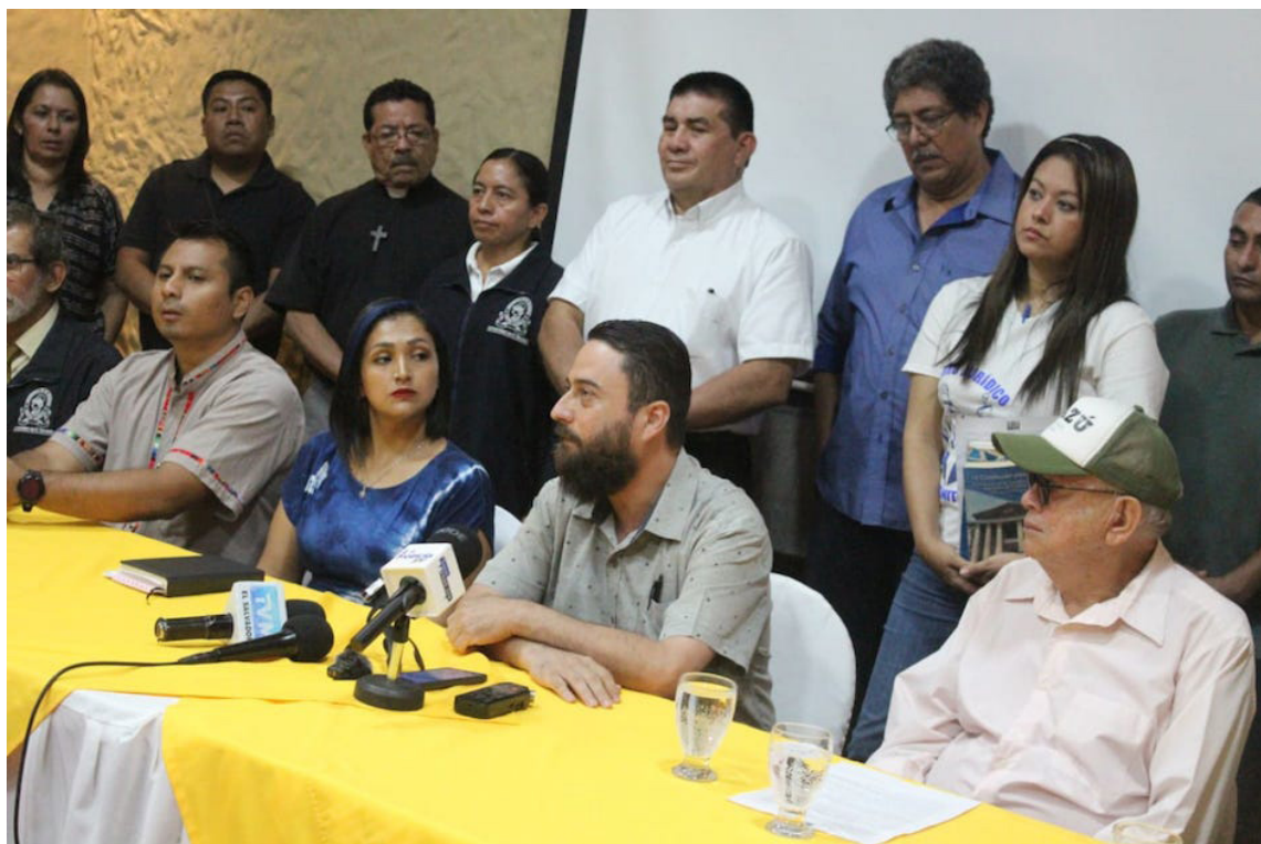
El movimiento social, expresa su apoyo a los cinco ambientalistas de ADES y la Comunidad Santa Marta, con un pronunciamiento público en el cual, exigen a la Fiscalía General de la República, dejar de criminalizarlos y a los Magistrados de la Cámara Penal, a dar por firme la resolución del Tribunal de Sentencia de Sensuntepeque, que absuelve a los líderes comunitarios de Cabañas.

Del mismo modo, llamó a la institucionalidad del Estado a trabajar por el bien común y