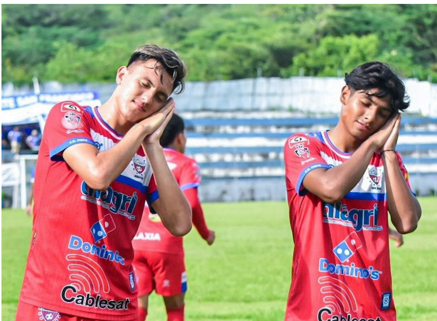
Firpo encabeza la tabla de posiciones a solo 3 fechas de que finalice el Apertura 2024.

Los equipos que quedaron eliminados en la primera ronda del torneo fueron Dragón en la novena casilla con 13 unidades, Fuerte San Francisco con 12 en la décima y Platense con 9 en la última.