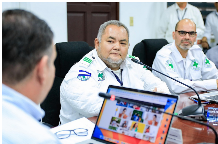
Representantes de Cruz Verde Salvadoreña explican en que se invirtieron los fondos asignados para 2024.

Cada año, de forma trimestral, Cruz Verde recibe por parte del Estado, a través del Ministerio de Salud (MINSAL), un subsidio que