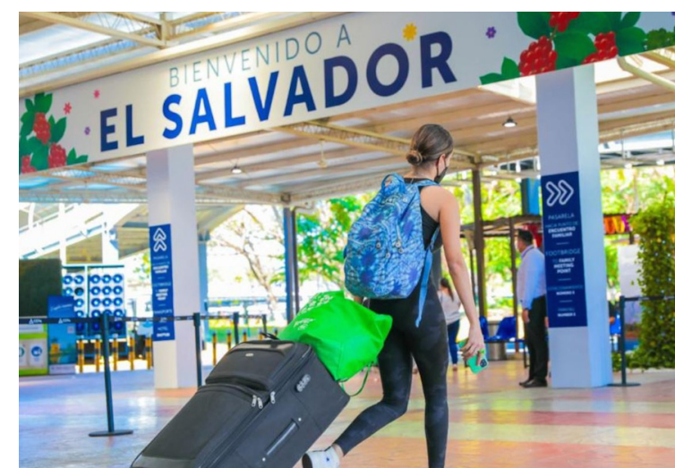
La medida estaría vigente desde diciembre hasta el 31 de enero de 2025.

son productores nacionales quienes están abasteciendo los Agromercados y la Central de Abasto, cuesta creerlo porque de hecho no hay, no sería adecuado que, en la producción agropecuaria nacional, casi medio millón de pequeños productores nacionales no tengan acceso al mercado. “Eso generaría una gran complicación en materia por un lado la soberanía alimentaria, pero por el otro también de la seguridad alimentaria y nutricional. En El Salvador hay 2 millones de salvadoreños en situación de pobreza, se incrementó la pobreza del campo y viven con inseguridad alimentaria”, sostuvo durante la entrevista Encuentro con Julio Villagrán. A la vez, indicó que a los consumidores les interesa los precios bajos, pero esto debe ser sin afectar la producción, si no se invierten los recursos necesarios a los productores nacionales, para que sean ellos quienes puedan comercializar la pobreza incrementará.