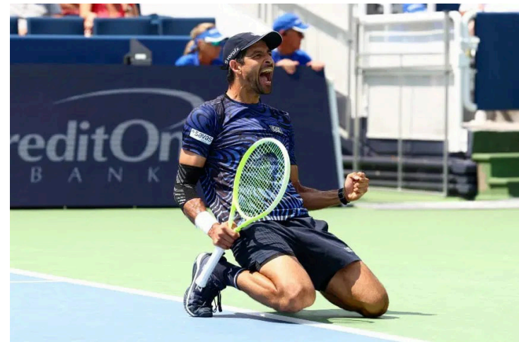
Marcelo Arévalo se convierte en el atleta #1 del mundo en dobles.

Actualmente, “Chelo” está disputando el Nitto ATP Masters Finales, en Torino, Italia, una competencia en la cual ya entrenó su nueva posición, pero también donde tuvo su primera derrota para avanzar este martes 12 en una jornada doble contra los italianos Andrea Vavassori y Simone Bolelli, y ante el australiano Matthew Ebden y el indio Rohan Bopanna.