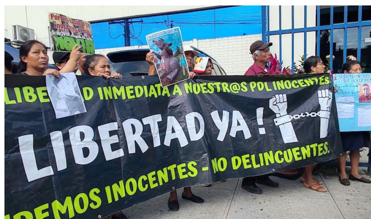
MOVIR y UNIDEHC presentan un aviso penal en la FGR, en contra de la junta directiva de la Asamblea, por actos arbitrarios, coartar el derecho constitucional de petición y respuesta.