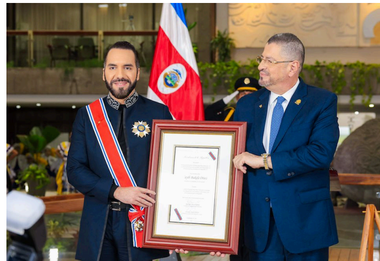
El Presidente Nayib Bukele recibe en Costa Rica, el reconocimiento denominado “Orden Nacional Juan Mora Fernández, grado de Gran Cruz Placa de Oro”.

Bukele, por su parte, fue a publicitar el régimen de excepción y el Plan Control Territorial. Sobre el anuncio de la Liga, Bukele sostuvo que invitarán “a los países que tengan gobiernos que piensen como el nuestro y que quieran llevar a sus ciudadanos lo mejor de la prosperidad, del crecimiento económico, del comercio y de la seguridad”. Sin embargo, no se brindaron mayores detalles sobre cuándo podría funcionar.