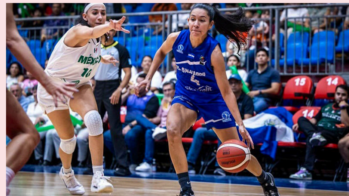
La Selección femenina de baloncesto destaca entre las mejores 4 selecciones del Centrobasket.