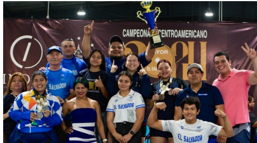
El Salvador gana el Campeonato Centroamericano Mayor de Levantamiento de Pesas 2024.