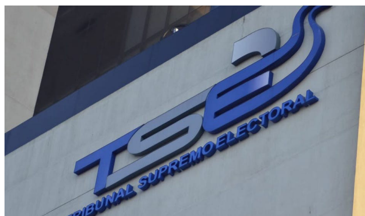
El Sindicato de Trabajadoras y Trabajadores del Tribunal Supremo Electoral (STRATSE) pidió el cese de intimidación, acoso laboral, presión psicológica y despidos en la institución.

“Denunciamos la equivocada decisión del Organismo Colegiado del TSE, de despedir a un grupo de trabajadores de la institución, personas con una larga trayectoria de