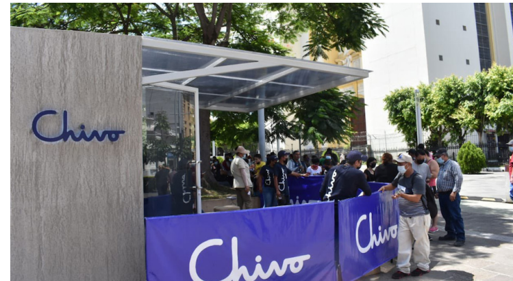
Los cajeros Chivos tienen poca afluencia en la actualidad ya que los salvadoreños lo dejaron de usar.

se conociera públicamente el contenido íntegro del contrato suscrito entre El Salvador y Google LLC. Sin embargo, Nuevas Ideas negó sus votos.