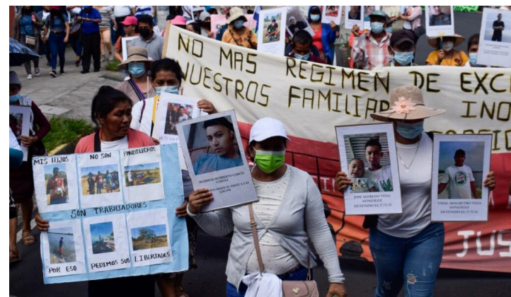
Socorro Jurídico Humanitario señala que el Estado es responsable de los cientos de fallecidos inocentes en los centros penitenciarios por actos de tortura o por negligencia en el tratamiento a sus enfermedades.

derechos humanos de todas las personas por medio de la legislación nacional, pero cuando el Estado es el violador, para eso existen las instancias internacionales a las cuales representamos; ya que la aplicación de la ley no puede estar por encima de los Derechos Fundamentales, derechos humanos, las garantías constitucionales