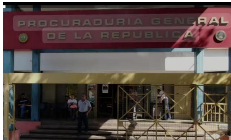
Los diputados ratificaron un convenio para garantizar que los encargados de menores de 21 años y otros miembros de la familia que necesiten medidas de protección y seguridad alimentaria cancelen las cuotas aunque abandonen El Salvador.

El tratado garantizará la obtención de las cuotas alimenticias en los casos en los que el responsable abandone el país. Es así como se brindará protección, seguridad alimentaria y un sano desarrollo de niñas, niños, jóvenes menores de 21 años y otros miembros de la familia