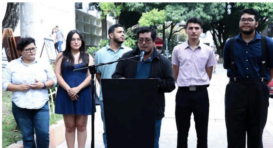
La obra de Roque Dalton sigue siendo una fuente de inspiración para estudiantes y generaciones que buscan un mundo más justo y equitativo.

Roque Dalton García nació el 14 de mayo de 1935, y fue desaparecido y posteriormente asesinado el 10 de mayo de 1975, a pocos días de cumplir 40 años. Su muerte fue atribuida a una decisión de la alta dirigencia del Ejército Revolucionario del Pueblo (ERP), del cual Roque fue parte, una organización político militar de izquierda que formó después parte de las cinco organizacio-