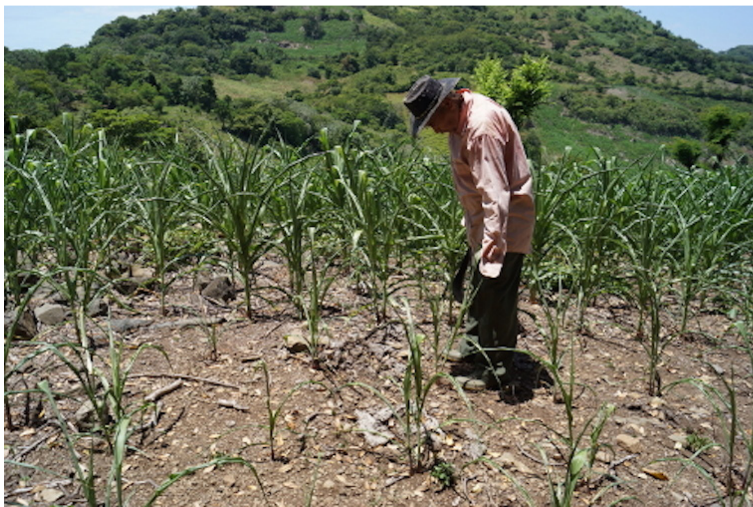
La COP 29 o Conferencia de las Naciones Unidas sobre el Cambio Climático, se reúnen cada año para una evaluar los compromisos, avances, negociaciones multilaterales frente a la situación climática que afecta a cientos de países en el mundo, donde El Salvador no es la excepción.

- ¿La COP 29, se le ha nombrado como del financiamiento y resarcimiento