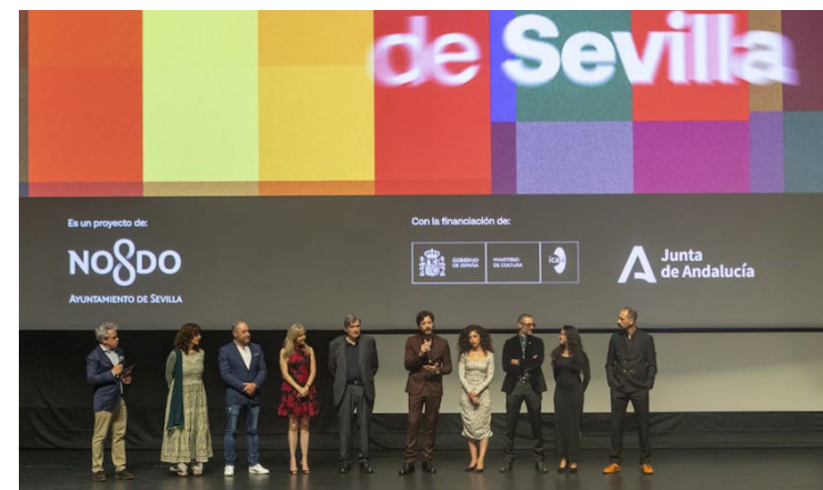
Este Festival se caracteriza por poner en la pantalla grande un enfoque innovador y arriesgado, los organizadores han dado lectura a los 37 nominados al premio Asociación de Escritores Cinematográficos de Andalucía (ASECAN), los ganadores serán dados a conocer el 21 de diciembre del corriente año.

Actores, directores, productores, guionistas e invitados especiales han pasado por este festival, y de igual manera estarán