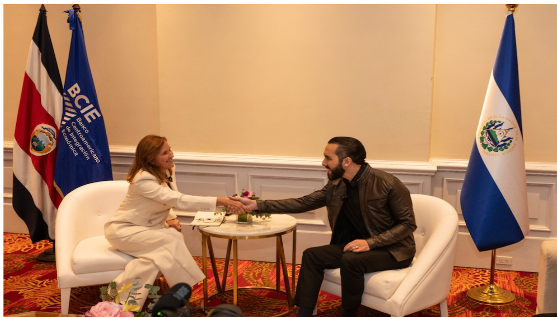
Bukele y la presidente ejecutiva del BCIE sostienen una reunión en Costa Rica.

go Chaves. Ambos mandatarios anunciaron la “Liga de Naciones”, donde trabajarán por “la seguridad y prosperidad” de los países miembros.