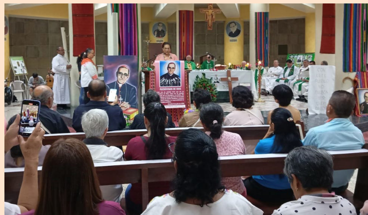
El XII Encuentro Intercontinental de las Comunidades Eclesiales de Base (CEBs) finalizó con una misa en la Cripta de Catedral Metropolitana, lugar donde descansan los restos de Monseñor Romero.

“Sin las raíces en el pueblo, ningún gobierno puede tener eficacia, pueden hacerlo solo cuando quieren implantarnos la fuerza de sangre; estamos otra vez en pie de testimonio ante San Romero de América, pastor y un ángel nuestro. Romero de la paz, casi imposible