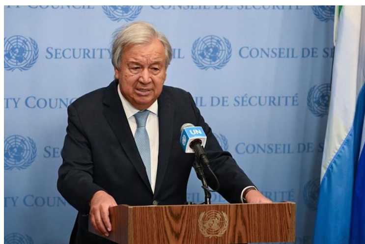
RÍO DE JANEIRO/Xinhua

Los miembros del Grupo de los 20 (G20) deben liderar con el ejemplo y utilizar su influencia para abordar los