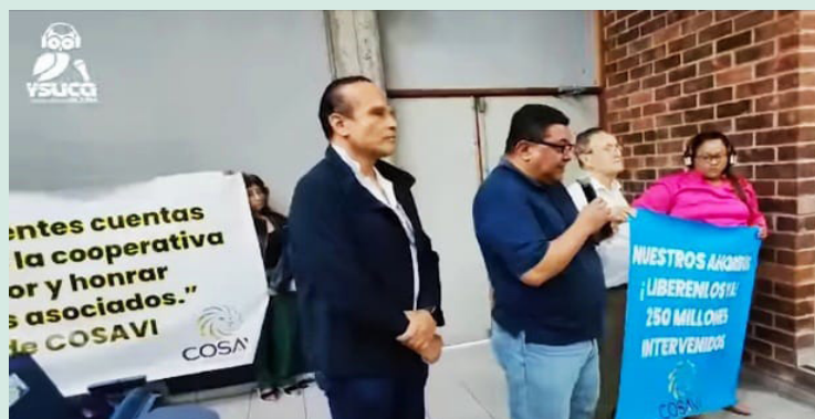
Los afectados por el desfalco de la Cooperativa Santa Victoria (COSAVI de RL), a través de una carta solicitaron al congresista estadounidense, James Patrick McGovern la colaboración e intervención del FBI para resolver el caso.

También, el titular de la Fiscalía General de la República (FGR), Rodolfo Delgado, ha señalado que parte del dinero sustraído ha sido rastreado en territorio