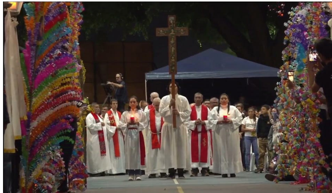
A los actos conmemorativos por el martirio de seis jesuitas y dos colaboradoras, asisten cientos de personas de diferentes nacionalidades y edades.

Debido a las condiciones climáticas, en este 35 aniversario la elaboración de alfombras a cargo de estudiantes y trabajadores de las diferentes áreas, se hizo en el segundo nivel del parqueo general de la universidad, que por ser techado las protegió de la intemperie del tiempo, de este lugar comenzó la procesión de Los Farolitos que recorrió el campus