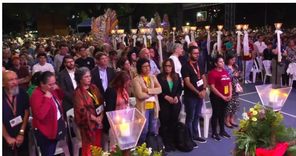
En la misa de conmemoración del asesinato de los jesuitas se pidió por las víctimas inocentes capturadas bajo el Régimen de Excepción, para que pronto puedan estar con sus familias.