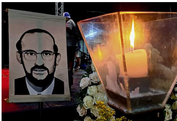
Los mártires de la UCA son recordados como esa luz que guía al pueblo, para sembrar esperanza y cosechar libertad.