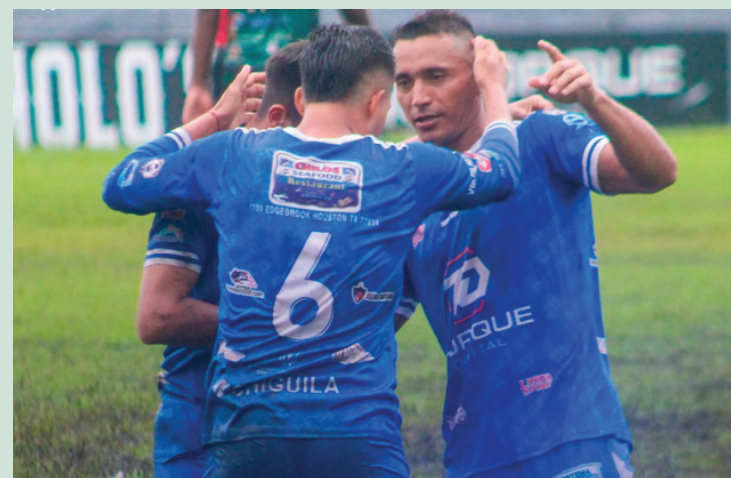
El fuerte San Francisco vence a Dragón 3-1 en San Francisco Gotera, en la jornada 21 del Apertura 2024.

ron oportunidad para el empate fueron Metapán y el 11, en el estadio Jorge "Calero" Suárez Landaverde, en Santa Ana, porque con cuatro goles en el marcador, los dos clubes repartieron puntos sobre el final del segundo tiempo.