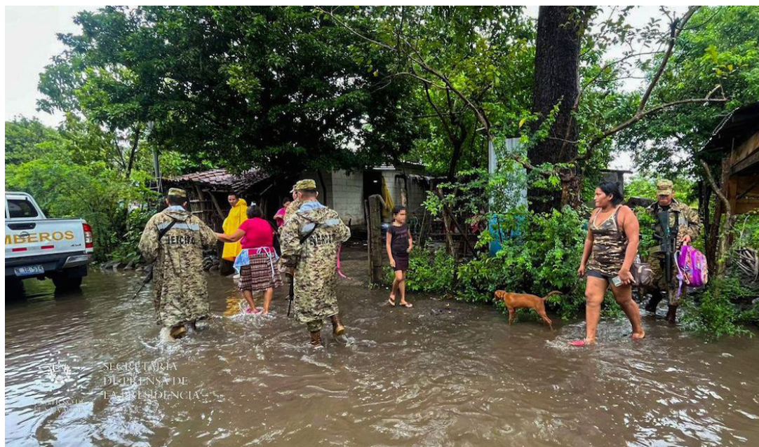
Se evacuaron 20 familias en el caserío Agua Zarca, cantón El Amate y Los Marranitos, Zacatecoluca, La Paz.