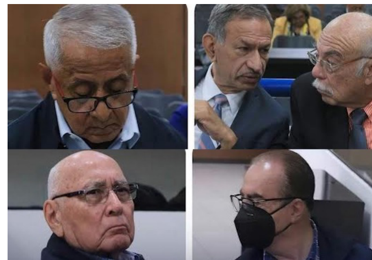
El Juez Segundo de Instrucción se San Salvador declaró esta tarde, la apertura a juicio en el caso de masacre de los Jesuitas de la UCA, para exfuncionarios y altos mandos militares, por delito de asesinato y actos de terrorismo.

Por el atroz crimen, únicamente está condenado el coronel Guillermo Benavides, quien cumple condena en El Salvador. Mientras que, en España, el exviceministro de Seguridad Pública, Inocente Montano, quien fue condenado en 2020 a 133