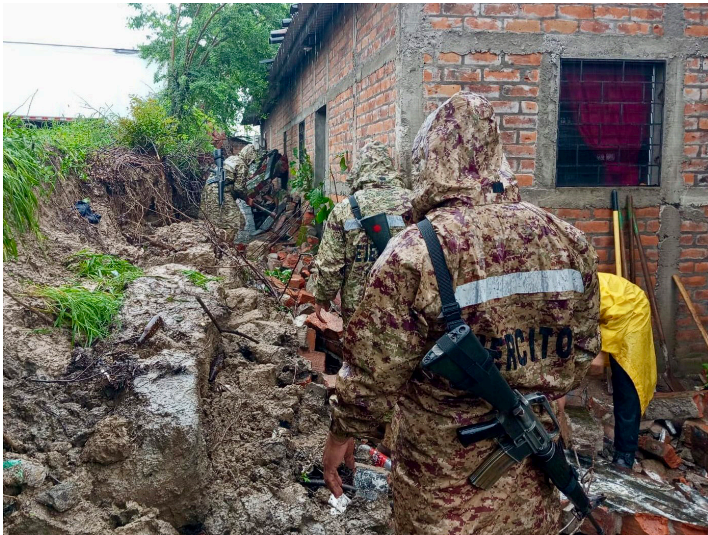
DAÑOS POR SARA. LAS LLUVIAS DE LAS ÚLTIMAS HORAS, DEBIDO AL PASO DE LA TORMENTA TROPICAL SARA, HA DEJADO EN EL PAÍS DAÑOS MATERIALES COMO ÁRBOLES CAÍDOS, CARRETERAS OBSTRUIDAS, RÍOS DESBORDADOS, MUROS DAÑADOS, INUNDACIONES URBANAS, VIVIENDAS ANEGADAS Y DAÑADAS COMO LO OCURRIDO EN LA COLONIA SANTA TERESA, ZACATECOLUCA, LA PAZ, DONDE RESULTARON DAÑADAS DOS VIVIENDAS DEBIDO AL COLAPSO DE UN MURO.