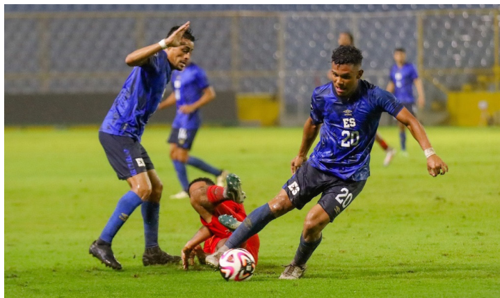
El Salvador vence por la mínima a Montserrat en el Cuscatlán, en la Liga de Naciones de CONCACAF.