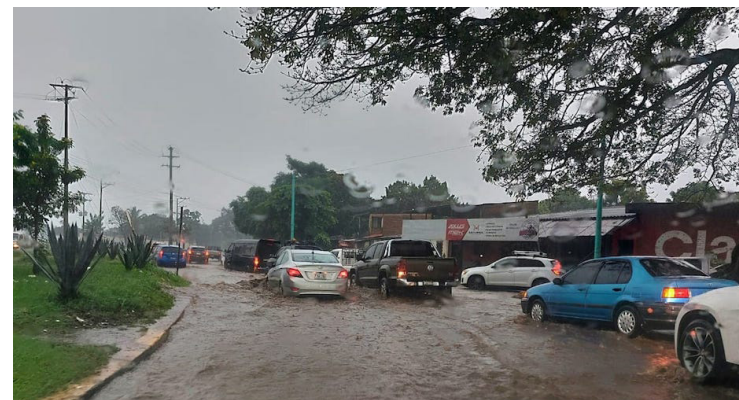
Las calles del desvío Los Naranjos, Santa Ana, resultaron inundadas debido a las intermitentes lluvias por los remanentes de la depresión Sara.

“Durante la mañana de este martes, el cielo estará nublado sobre la cordillera volcánica con probabilidad de lluvias puntuales, en el resto del país, predominará el cielo medio nublado, en la tarde, se desarrollarán las lluvias y tormentas sobre la cordillera volcánica y zona norte del centro y oriente del país, moviéndose al final de la tarde en dirección a la franja costera”, informa el pronóstico del MARN. En el transcurso de la noche, las lluvias puntuales se registrarán en la zona costera oriental, el ambiente se mantendrá cálido en horas diurnas y fresco por la noche y madrugada.