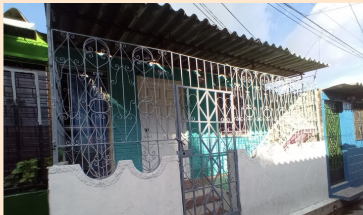
El dictamen pasará al pleno legislativo el jueves durante la sesión plenaria para su aprobación.

La Comisión de Hacienda y Especial del Presupuesto emitió dictamen favorable para aprobar disposiciones transitorias que buscan condonar intereses y recargos por incumplimientos de pago en los servicios de acueducto y alcantarillado.