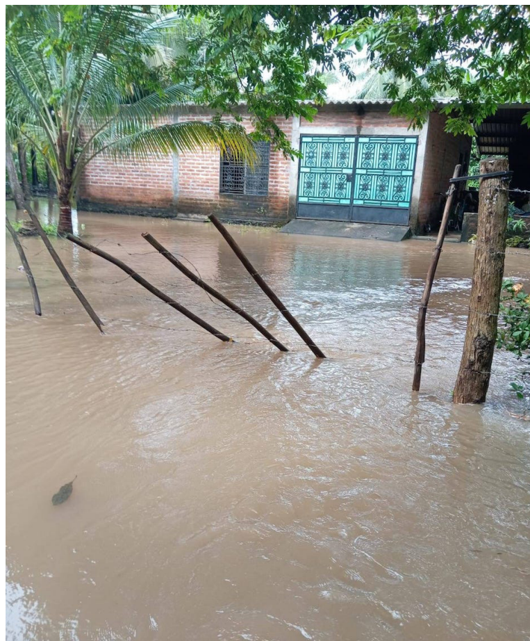
Lluvias persistentes que son remanentes de la Tormenta Tropical Sara, impacta a la población con desbordamientos como el río Moscuca, Acajutla, Sonsonate. Foto Diario CoLatino/Cortesía UNES.

Sobre los efectos negativos, Blanco agregó que en la agricultura y específicamente en la producción de frijol ya se encuentran los cultivos madurando y que mucha gente que ya “ha arrancado”, que es cuando las vainas del frijol