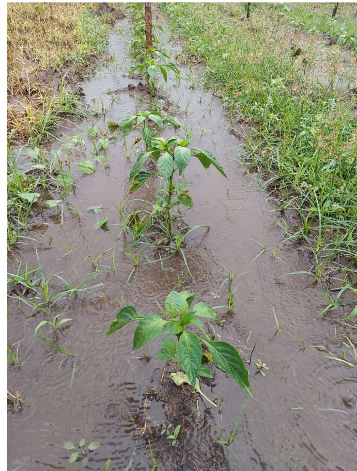
Los efectos negativos de la Tormenta Tropical Sara se ven en la agricultura, ya que los sembradíos se han inundado.

La Red de Monitoreo añadió que Ahuachapán Sur se encuentra en Alerta Verde a escala nacional. Y por la permanencia de lluvias, consideran la posibilidad del aumento de caudales en los ríos y quebradas, escorrentías, deslizamientos y caídas de árboles en la zona norte y sur.