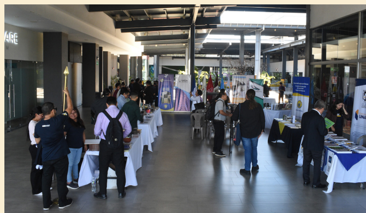
La UES será hogar de la feria del libro este 22 de noviembre.

Según lo informó ExLibris, la feria se llevará a cabo en el edificio de la Facultad de Jurisprudencia y Ciencias Sociales, de la Universidad de El Salvador (UES), este será un espacio dedicado a potenciar la generación de actividades vinculadas con la difusión académica, tanto en formatos impresos como digitales. Será un encuentro entre autores,