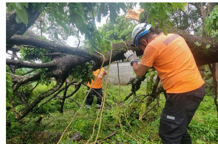
Un árbol caído afectó una vivienda, en el barrio Morazán, Cuyultitán, La Paz.

“Las lluvias anteriores, junto a la vaguada prefrontal por el acercamiento de un frente frío, permitirán la formación de lluvias y tormentas durante la tarde y la noche, a la vez, el ingreso de vientos nortes débiles”