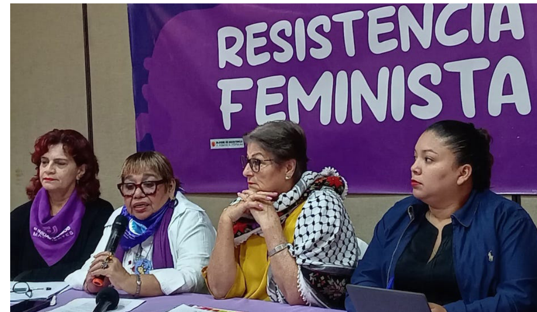
La Federación Democrática Internacional de Mujeres (FDIM), la Resistencia Feminista, la Asamblea Feminista y la REDFEM, así como otras organizaciones, convocan la marcha para el 25 de noviembre, en contra de la violencia contra a la mujer.

Ante esta situación, consideran que en el presente año el “Estado salvadoreño, encabe-