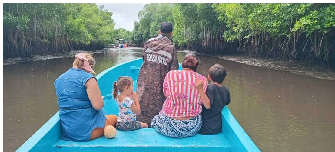
Tres familias afectadas por las lluvias en la Isla El Jobal, fueron trasladadas hacia el albergue de Jiquilisco, en Usulután.