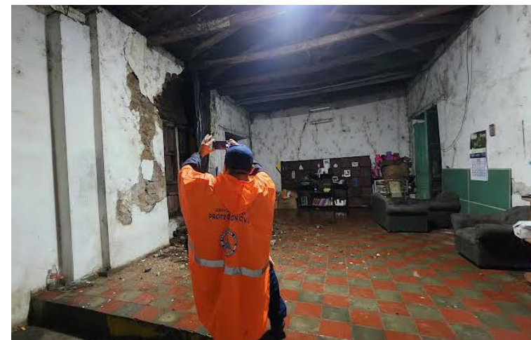
Debido a las lluvias una vivienda resultó con daños, en el barrio Santa Lucía, Zacatecoluca, La Paz.