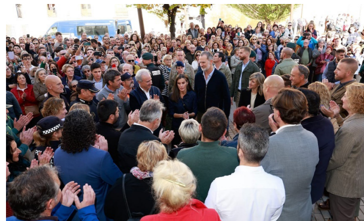
Saul Martínez Corresponsal @DiarioCoLatino

“Que viva el rey, Que viva la reina”, eran las palabras de centenares de valencianos quienes recibieron a los reyes de España en Chiva, Valencia, otro de los pueblos impactados por la Depresión Aislada en Niveles Altos (DANA), el pasado 29 de octubre.