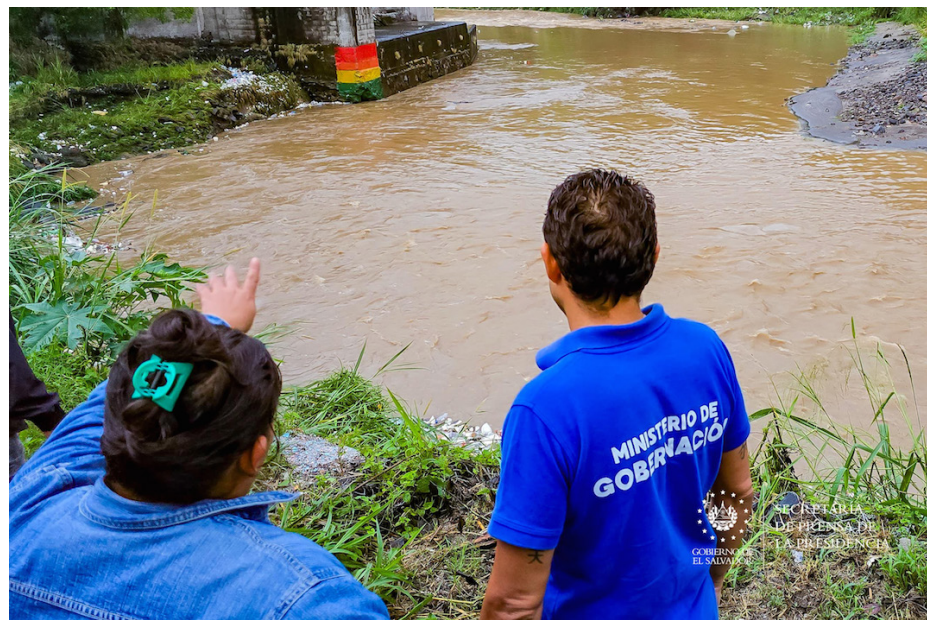
Serán $50 millones los que la Asamblea aprobará durante la plenaria de esta semana.