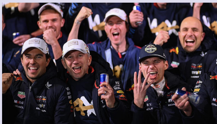
Max Verstappen celebra con la escudería de Red Bull el cuarto título consecutivo del neerlandés.

El neerlandés se conformó con la quinta posición para sellar su cuarto campeonato de