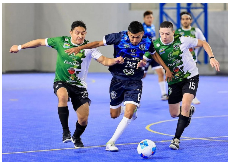
La Liga Mayor de Fútbol Sala se encamina a disputar la jornada 3 del Apertura 2024.

San Jacinto, en calidad de visitante en la Cuna del Mágico, en el estadio Jorge "El Mágico" González, goleó 5-2 a Ciudad Delgado, para ponerse a la cabeza en la tabla de posiciones.