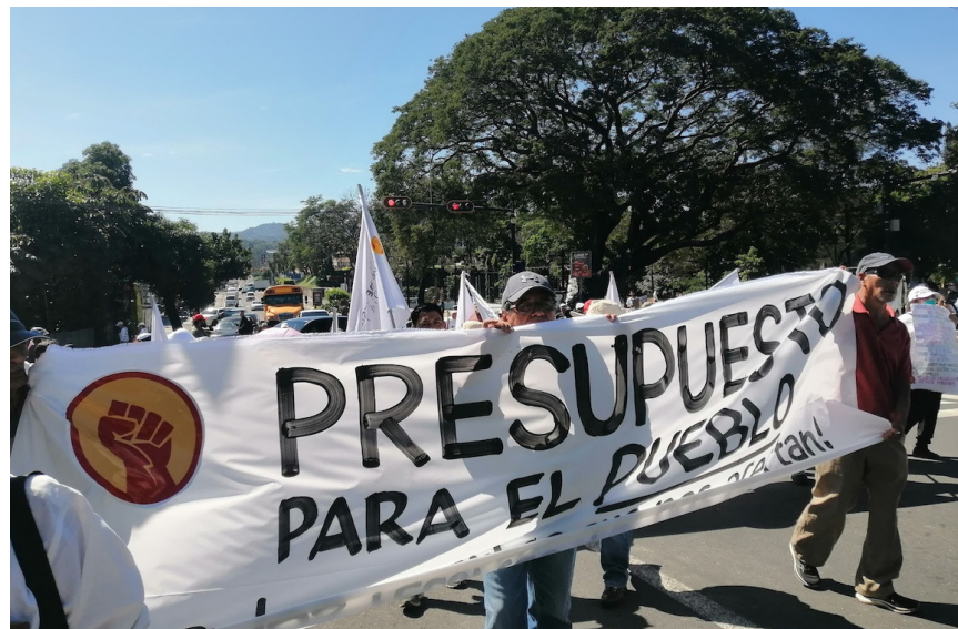
En un inicio se había planteado que la marcha saldría desde la Plaza Divino Salvador del Mundo hasta el Parque Cuscatlán, pero esta, llegó hasta Catedral metropolitana de San Salvador.

“Con la reducción del presupuesto para Salud,