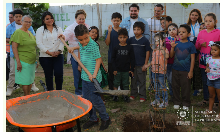
Los menores también colocan la primera piedra para el cubo en Zaragoza.

"El presidente Bukele pidió que fuera construido este espacio acá en Jardines de Zaragoza, fue una comunidad que sufrió mucho la guerra de las pandillas, una guerra absurda y que dejó muchas familias con luto y dolor, en encierro acá dentro de su misma comunidad y que habían perdido la libertad de movilizarse", expresó el funcionario.