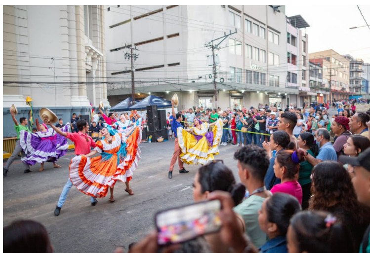
La Nuit Blanche celebrará la sexta edición en el país el 15 de febrero de 2025, para llevar la cultura a las calles, luego de su reprogramación.

La Nuit Blanche de San Salvador celebrará la sexta edición de llevar la cultura a las calles y para reunir la comunidad en torno a una noche llena de arte, crea-