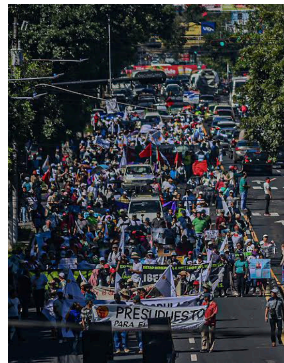
La marcha fue un mensaje al Gobierno para que apruebe un Gobierno justo y equilibrado.

supuesto justo y equilibrado, que atienda las necesidades de los sectores pobres y vulnerables del país.