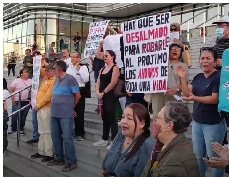
Afectados de COSAVI muestran su descontento con el Gobierno respecto a sus ahorros, ya que los que ahorrantes que tienen más de $20 mil no pueden acceder a estos y lo necesitan para su salud, alimentación y deudas.

Un fideicomiso es un préstamo que lo administraría la banca estatal, pues sería el