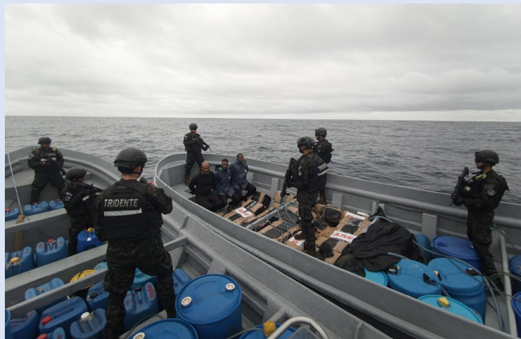
Este fin de semana se decomisaron más de 2 toneladas de cocaína por la Marina Nacional de El Salvador.

En septiembre de 2023, Estados Unidos incluyó a El Salvador en la lista de países de mayor producción y tránsito de drogas. El ministro de Seguridad, Gustavo Villatoro, informó el año pasado que el país había incautado 32.5 toneladas de droga, equivalente a $709,472,513, de enero a abril de 2023.