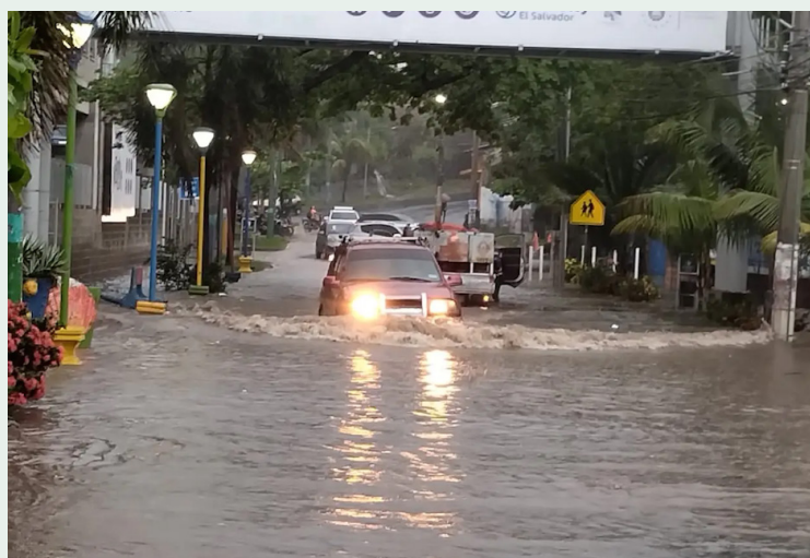
Los fondos servirían para atender las emergencias, pero sin especificar rubros, áreas o proyectos.

para transparentarlos. Sin embargo, Nuevas Ideas rechazó la propuesta.