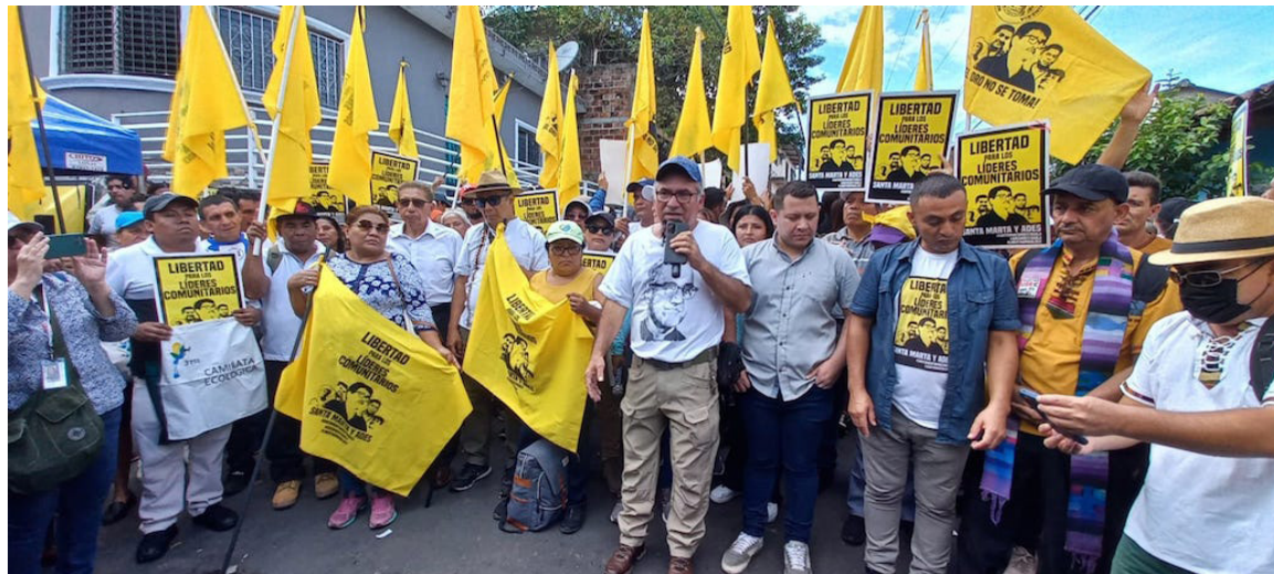
Santa Marta y ADES denuncian la injusticia de anular la absoluci3n definitiva de sus líderes comunitarios y ambientalistas contra la minería metálica por parte de la Fiscalía General de la República.