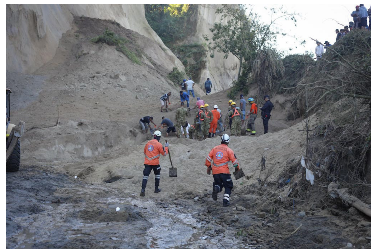
Tres trabajadores murieron soterrados por un talud de tierra, cuando extraían arena, en una quebrada en San Pedro Perulapán, departamento de Cuscatlán. Foto Diario Co Latino/@PNCSV.

Inspectores del Ministerio de Trabajo llegaron a la zona de la emergencia, para corroborar lo