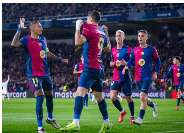
El Barcelona suma el cuarto triunfo en la Champions League para consolidarse en la zona de clasificación de la competición.

Como dato adicional, Lewandowski es el tercer máximo goleador en la historia de la UEFA Champions League, con 101 goles, por debajo de Lionel Messi,