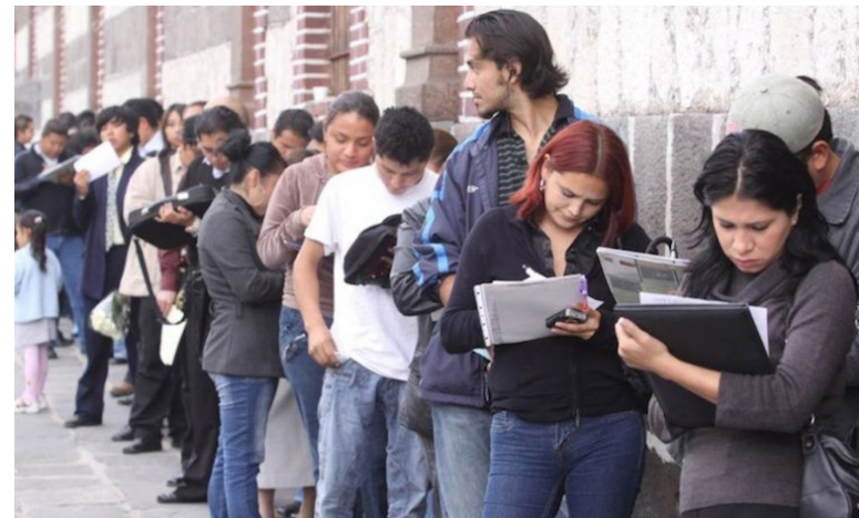
El Observatorio les ha permitido identificar que los derecho más vulnerados entre las juventudes es el acceso a la justicia laboral, atendiendo casos de despidos de mujeres embarazadas y el impago de indemnizaciones por despidos injustificados.

tes libres de violencia, con énfasis de proteger a las mujeres jóvenes”, puntualizó Guidos.