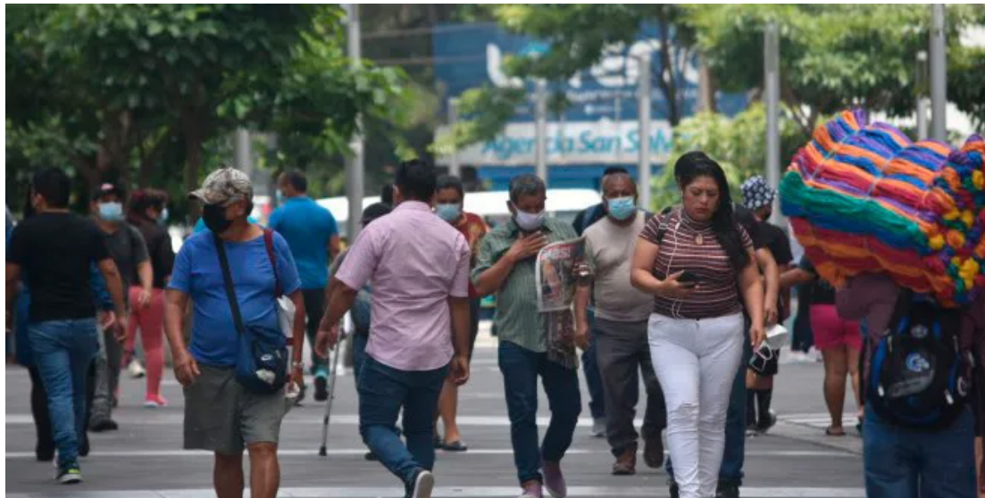
El aguinaldo es una prestación que recibe un trabajador del sector formal a final de año.

Esta disposición transitoria ya ha sido implementada desde años anteriores, esto como una forma de aliviar el bolsillo de los salvadoreños, según lo argumentan los diputados.