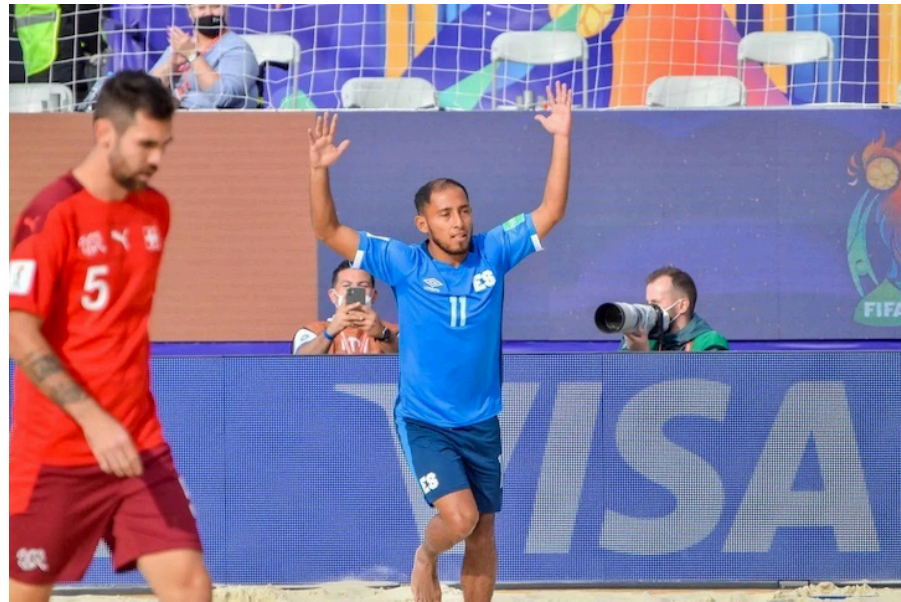
El Salvador es eliminado por Suiza en el Mundial de 2021, en Rusia.

En el grupo B se encuentran Estados Unidos, Panamá, Bahamas, que en este caso es la anfitriona, y Trinidad y To-