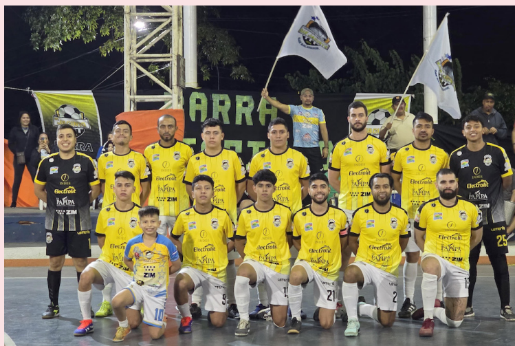
San Jacinto es líder del Apertura 2024 en la Liga Mayor de Fútbol Sala y de forma invicta.