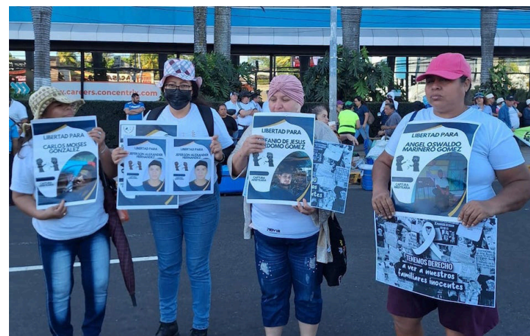
UNIDEHC presenta el “Informe de violación de derechos a la salud en las clínicas de los Centros Penales del país”, que incluye testimonios de un médico que estuvo en dos centros penales del país como preso político.

De 100 casos que actualmente representa UNIDEHC solo 19 personas ha logrado la libertad con medidas sustitutivas, de estos 15 hombres y 4 mujeres, es decir, el 12%, donde ha prevalecido situación de salud para lograr una resolución favorable.