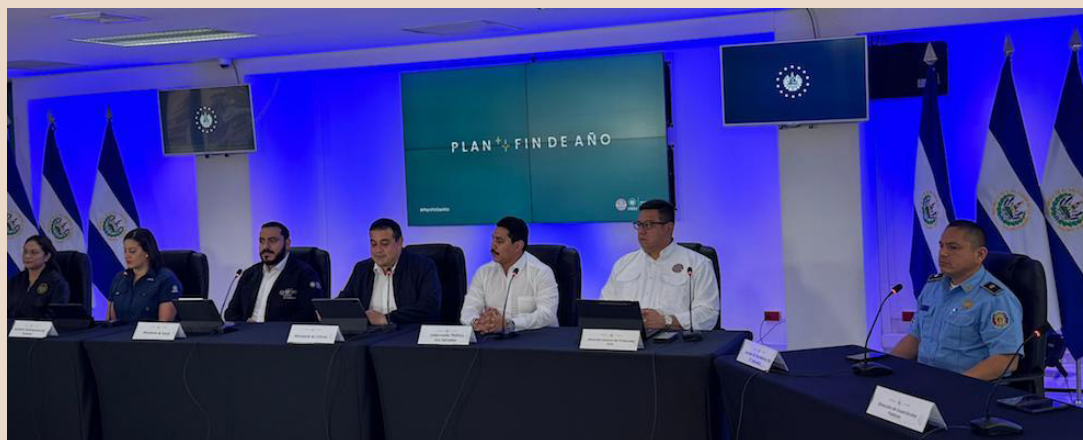
Protección Civil activa el Plan Fin de año 2024 que contempla medidas estratégicas en lugares de alta afluencia.

Según Amaya, el plan incluye verificaciones que el Cuerpo de Bomberos estará haciendo, en los lugares de fabricación y comercialización de pólvora, para asegurar el cumplimiento no solo de las normativas, sino también los procedimientos enfocados en la