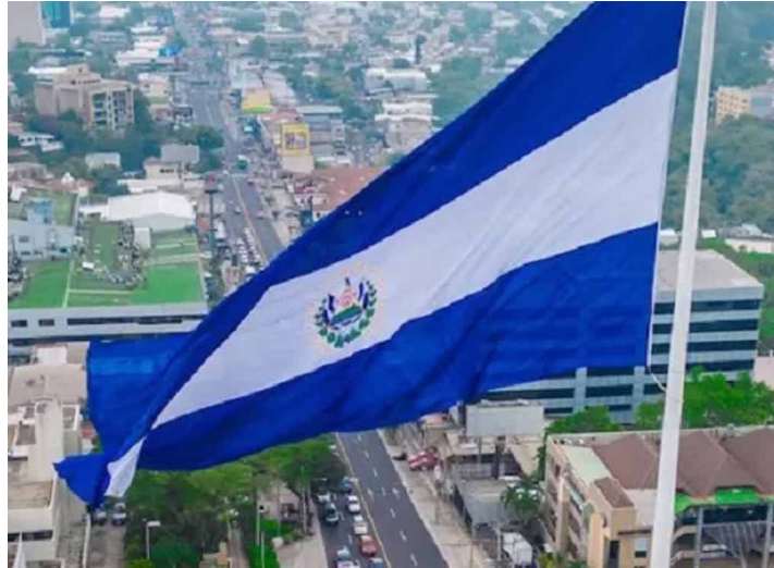
En su primer gobierno, herramientas como el Plan de Control Territorial y el régimen de excepción funcionaron porque tuvieron el apoyo del pueblo pero habría que ver hasta qué punto esa lealtad se mantiene.

Hay avances luego que Bukele asumiera el 1 de junio, con acuerdos, planes de desarrollo