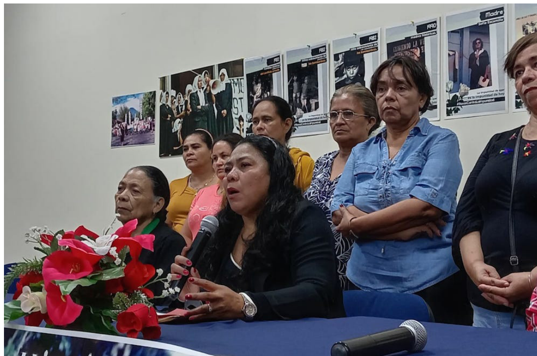
El Comité de Madres y Familiares Detenidos, Desaparecidos y Asesinados Políticos de El Salvador “Monseñor Oscar Arnulfo Romero”, COMADRES, conmemora su 49 aniversario de fundación que unió a madres, hermanas y familiares en busca de desaparecidos y detenidos de la Masacre Estudiantes de la Universidad de El Salvador el 30 de julio de 1975.

El Comité de Madres y Familiares, Detenidos, Desaparecidos y Asesinados Políticos de El Salvador “Monseñor Oscar Arnulfo Romero” (COMADRES), se pronunció en el marco del 49 aniversario de fundación, organización que unió a madres, hermanas y familiares en busca de desaparecidos y detenidos, luego de la masacre estudiantil del 30 de julio de 1975.