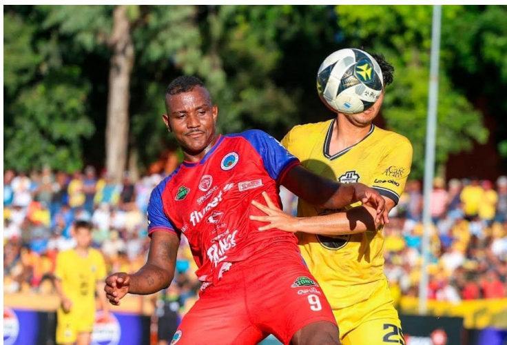
Once Deportivo y Cacahuatique empatan 1-1 en las semifinales del Apertura 2024.

El Once se mostró con más ímpetu en el segundo tramo y logró el empate, luego del acertado ingreso de Kemal Malcolm, que solo algunos minu-