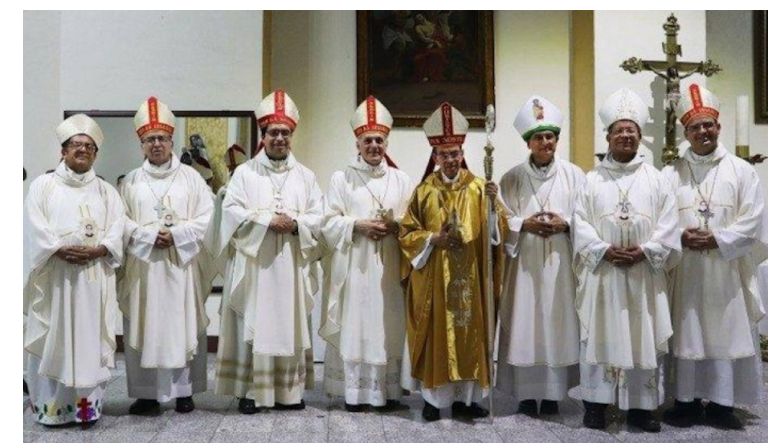
La Conferencia Episcopal de El Salvador, integrada por los obispos católicos del país, presentan pronunciamiento en contra de la activación de la minería metálica en el país.