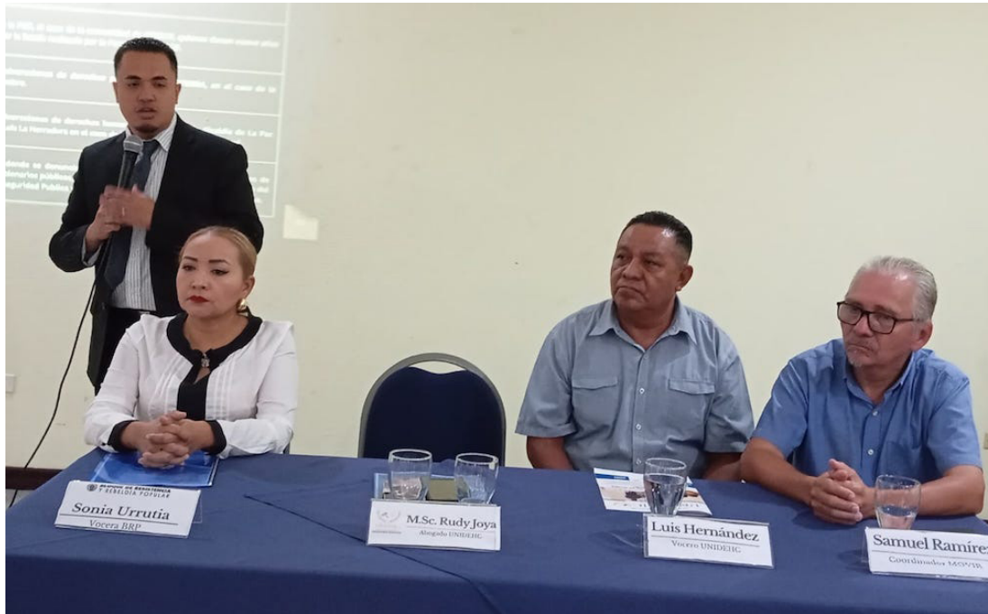
Muchas de las capturas arbitrarias fueron ejecutadas por agentes policiales o soldados de la FAES, con fuerza y golpes; hasta la fecha sus familiares no han logrado verlos.

La Unidad de Defensa de Derechos Humanos y Comunitarios (UNIDEHC) dio a conocer el “Informe de violación de derechos a la salud en las clínicas de los Centros Penales del país”, hallazgos y testimonios de un médico que estuvo en dos centros penales del país como preso político, así como diversas víctimas de detenciones arbitrarias bajo el Régimen de Excepción.